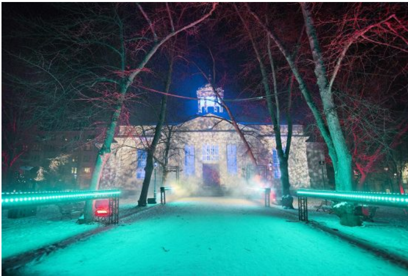
Vanhassa kirkkopuistossa on monen valotaiteilijan yhteisteos, lyhtypuisto Lantern Park.

Tosinin FILUX on Luxiin verrattuna valtava tuotanto, jossa käy festivaalin aikana jopa viisi miljoonaa kävijää.