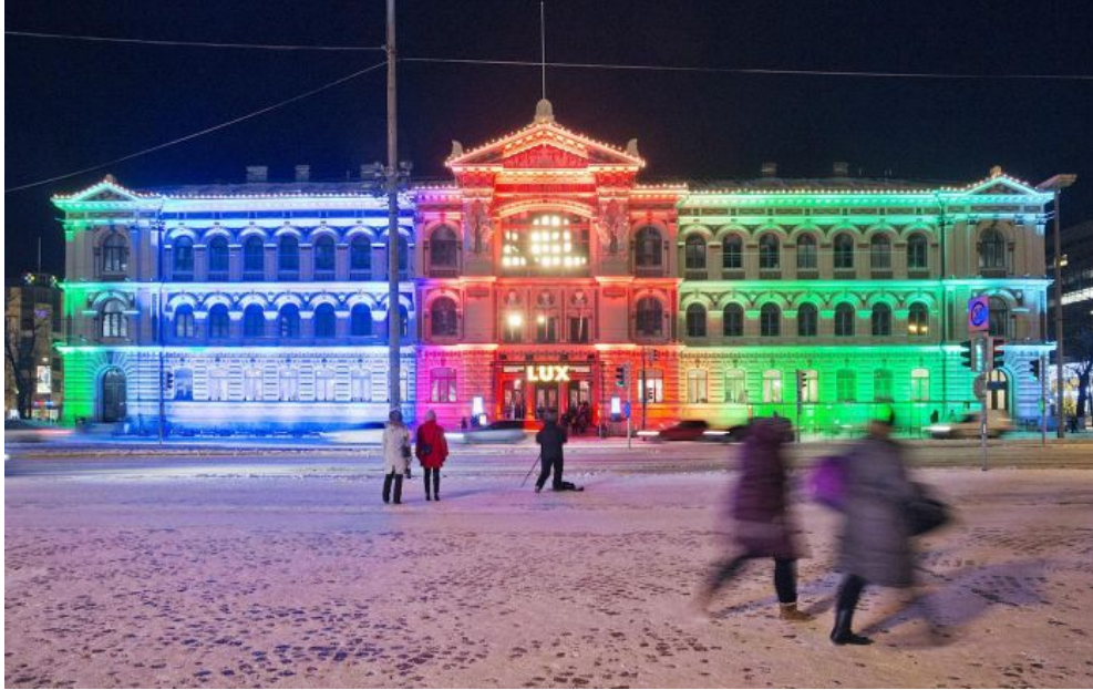
Ateneumin julkisivussa nähdään Sun Effectsin Candy House -teos.

Kova pakkasen ei ole karkottanut valofestivaali Lux Helsingin kävijöitä. Päinvastoin.