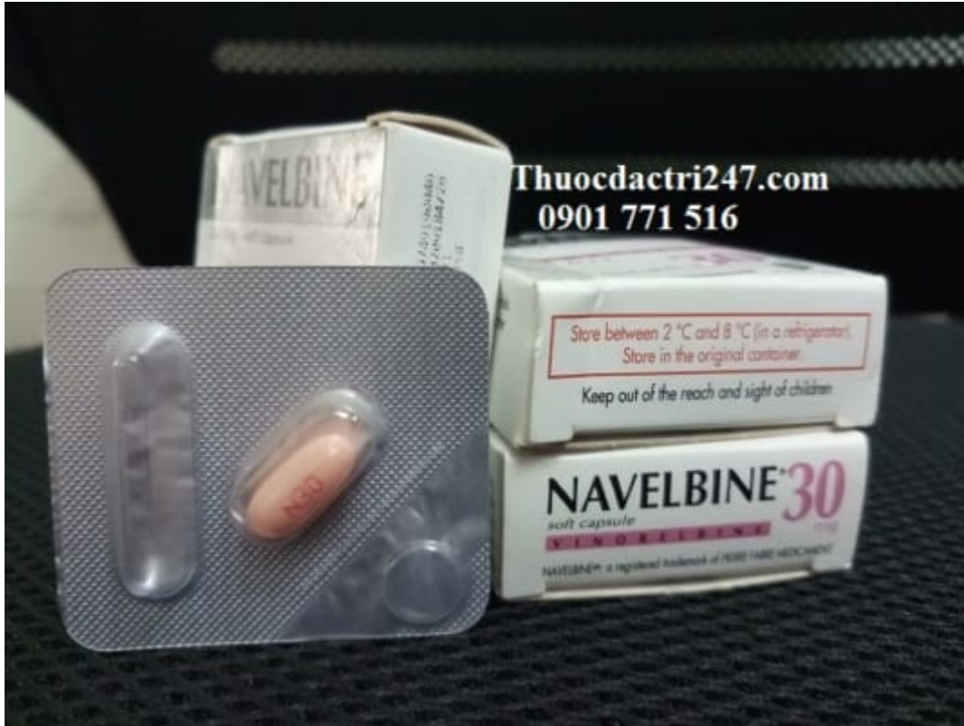
Thuốc navelbine 30mg vinorelbine điều trị ung thư vú, ung thư phổi – Thuốc đặc trị 247 (3)