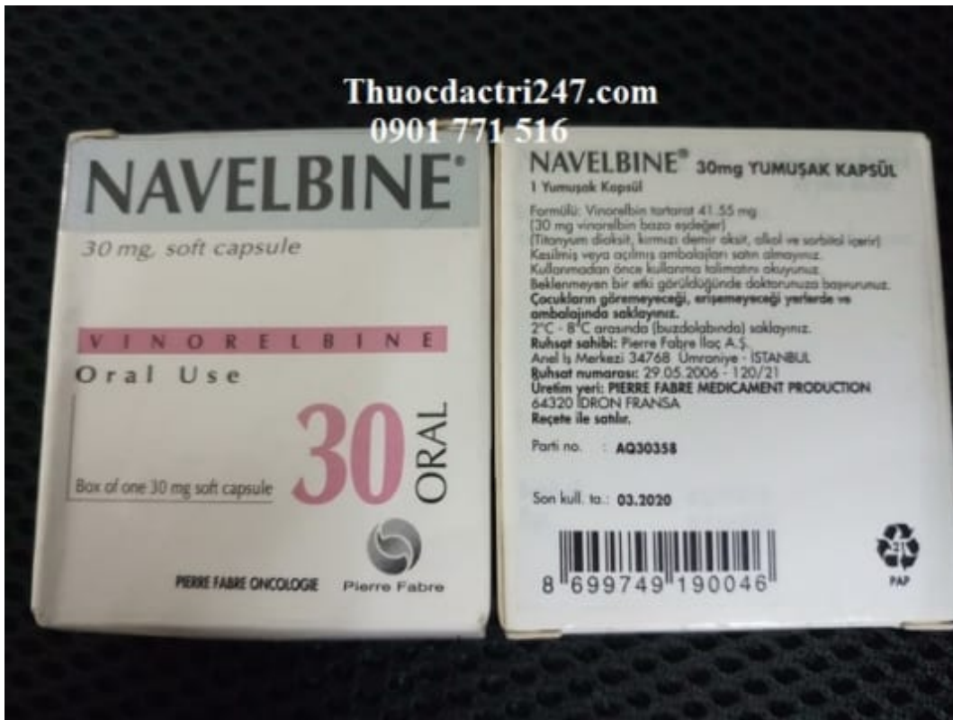
Thuốc navelbine 30mg vinorelbine điều trị ung thư vú, ung thư phổi – Thuốc đặc trị 247 (2)