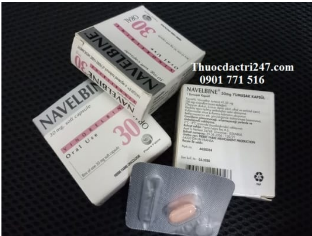
Thuốc navelbine 30mg vinorelbine điều trị ung thư vú, ung thư phổi – Thuốc đặc trị 247 (1)