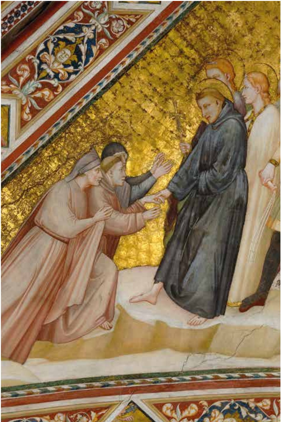
Bottega di Giotto, Allegoria della castità (dettaglio; 1315 ca.): Basilica inferiore di San Francesco ad Assisi, Volta del Presbiterio