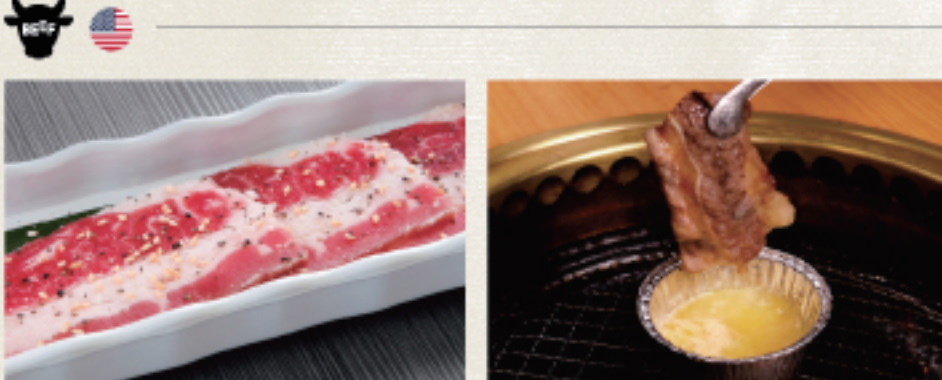
○ 涮涮燒 焼きしゃぶ Yakishabu ・燒烤醬 たれ Tare ・雙胡椒 ダブルペッパー Double Pepper ○ 蒜味奶油牛腹肉 ガーリックバターカルビ Garlic Butter Karubi