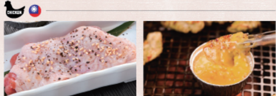
○ 雞腿排 チキン Chicken ・照燒醬 照り焼き Teriyaki ・蒜味醬 ガーリック Garlic ・雙胡椒 ダブルペッパー Double Pepper ○ 雞腿排起士咖哩 チキンチーズカレー Chicken Cheese Curry