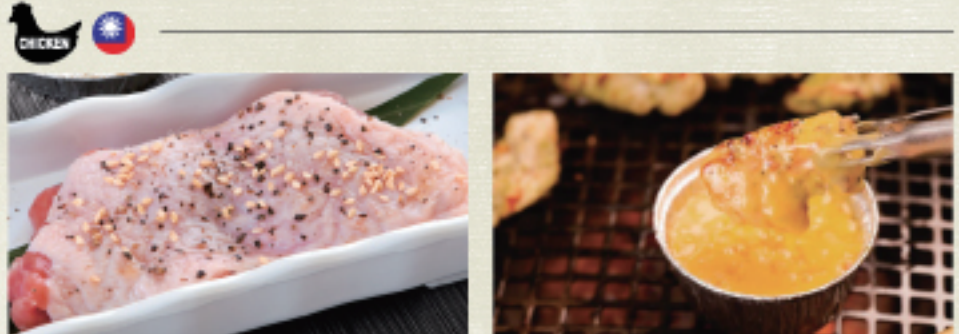
○ 雞腿排 チキン Chicken ・照燒醬 照り焼き Teriyaki ・蒜味醬 ガーリック Garlic ・雙胡椒 ダブルペッパー Double Pepper ○ 雞腿排起士咖哩 チキンチーズカレー Chicken Cheese Curry