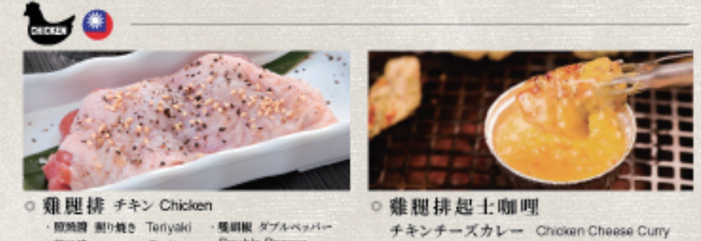
○ 雞腿排 チキン Chicken ・照燒醬 照り焼き Teriyaki ・蒜味醬 ガーリック Garlic ・雙胡椒 ダブルペッパー Double Pepper ○ 雞腿排起士咖哩 チキンチーズカレー Chicken Cheese Curry