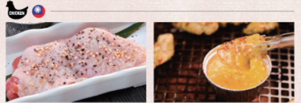
○ 雞腿排 チキン Chicken ・照燒醬 照り焼き Teriyaki ・蒜味醬 ガーリック Garlic ・雙胡椒 ダブルペッパー Double Pepper ○ 雞腿排起士咖哩 チキンチーズカレー Chicken Cheese Curry