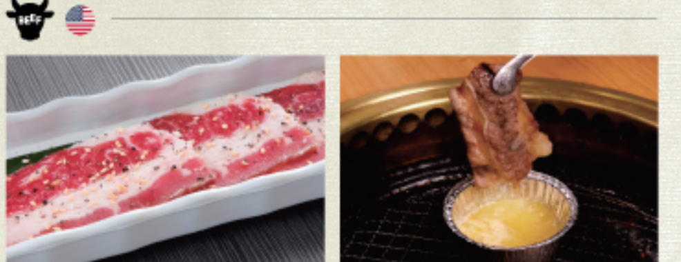
○ 涮涮燒 焼きしゃぶ Yakishabu ・燒烤醬 たれ Tare ・雙胡椒 ダブルペッパー Double Pepper ○ 蒜味奶油牛腹肉 ガーリックバターカルビ Garlic Butter Karubi