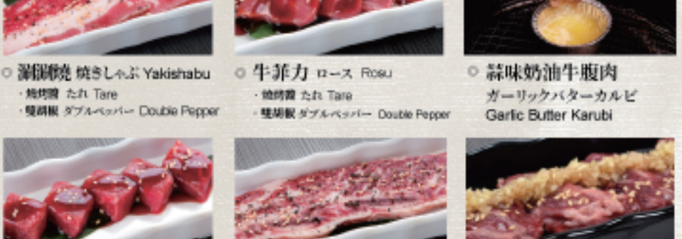
○ 涮涮燒 焼きしゃぶ Yakishabu ・燒烤醬 たれ Tare ・雙胡椒 ダブルペッパー Double Pepper ○ 牛菲力 ロース Rosu ・燒烤醬 たれ Tare ・雙胡椒 ダブルペッパー Double Pepper ○ 蒜味奶油牛腹肉 ガーリックバターカルビ Garlic Butter Karubi