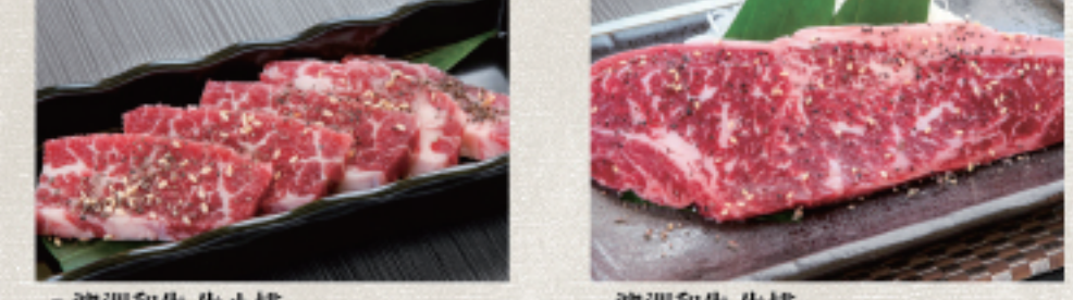
○ 牛舌牛タン Gyu Tan ・鹽焗醬 ねぎ塩 Salted Scallion ・雙胡椒 ダブルペッパー Double Pepper ○ 霜降牛排 霜降ステーキ Shimofuri Steak ・燒烤醬 たれ Tare ・蒜味醬 ガーリック Garlic ・雙胡椒 ダブルペッパー Double Pepper