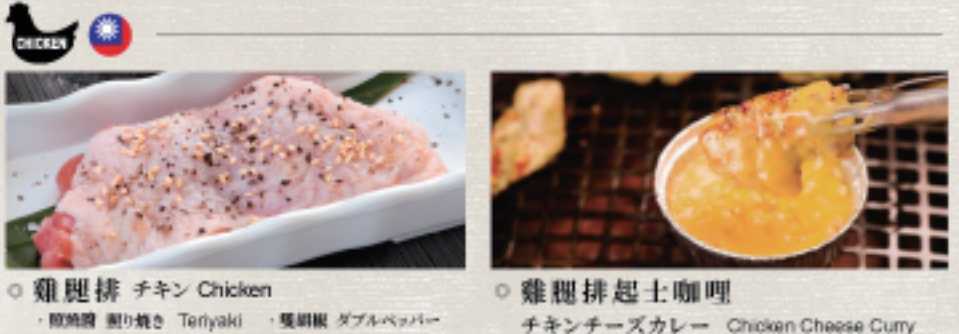
○ 雞腿排 チキン Chicken ・照燒醬 照り焼き Teriyaki ・蒜味醬 ガーリック Garlic ・雙胡椒 ダブルペッパー Double Pepper ○ 雞腿排起士咖哩 チキンチーズカレー Chicken Cheese Curry