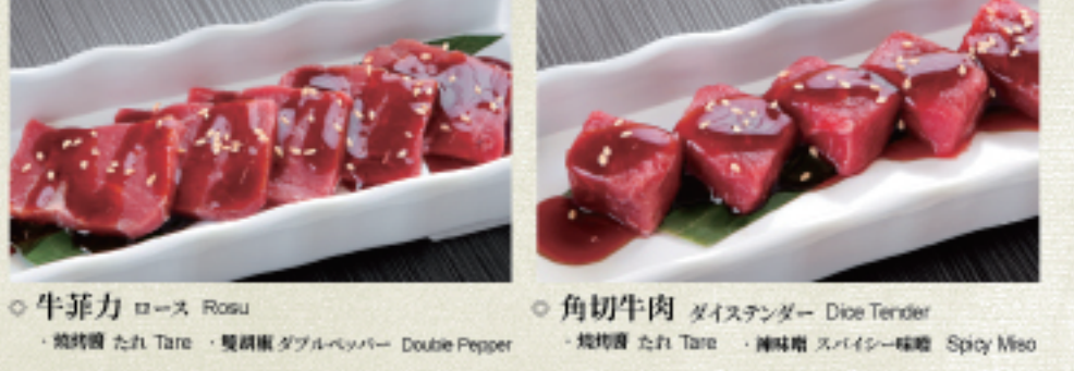
○ 牛菲力 ロース Rosu ・燒烤醬 たれ Tare ・雙胡椒 ダブルペッパー Double Pepper ○ 角切牛肉 ダイスタンダー Dice Tender ・燒烤醬 たれ Tare ・調味醬 スパイス味噌 Spicy Miso