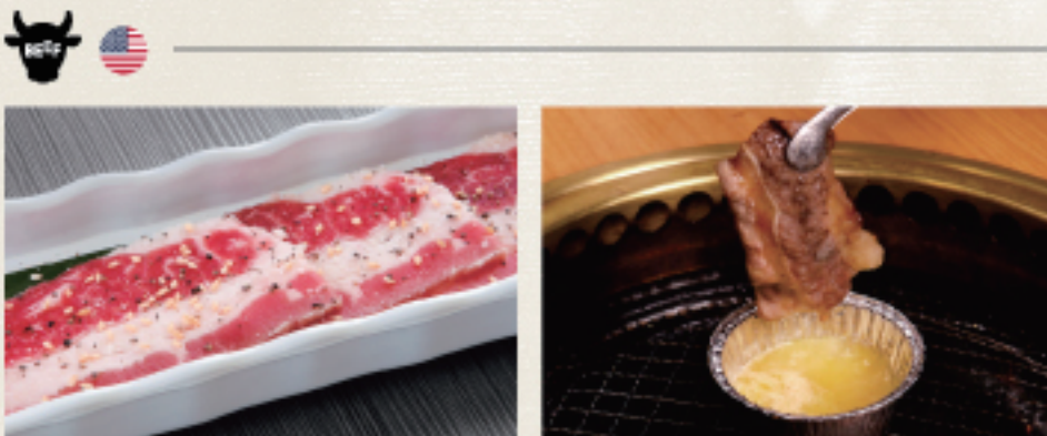
○ 涮涮燒 焼きしゃぶ Yakishabu ・燒烤醬 たれ Tare ・雙胡椒 ダブルペッパー Double Pepper ○ 蒜味奶油牛腹肉 ガーリックバターカルビ Garlic Butter Karubi