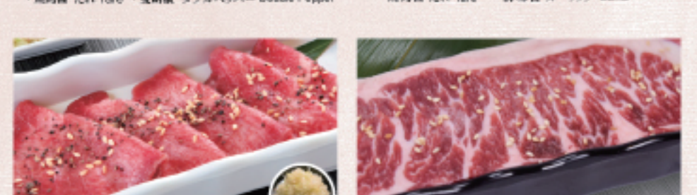
○ Kintan帶骨牛小排 キンタンカルビ Kintan Karubi ・燒烤醬 たれ Tare ・雙胡椒 ダブルペッパー Double Pepper ○ 橫膈膜 はらみ Harami ・燒烤醬 たれ Tare ・蒜味醬 ガーリック Garlic