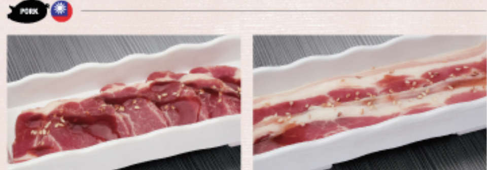
○ 豬梅花 豚ロース Pork Shoulder ・照燒醬 照り焼き Teriyaki ・原味 オリジナル Original ○ 豬五花 豚バラ Pork Belly ・蒜味醬 ガーリック Garlic ・原味 オリジナル Original