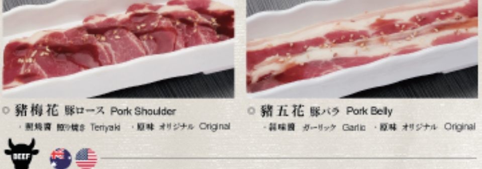
○ 豬梅花 豚ロース Pork Shoulder ・照燒醬 照り焼き Teriyaki ・原味 オリジナル Original ○ 豬五花 豚バラ Pork Belly ・蒜味醬 ガーリック Garlic ・原味 オリジナル Original