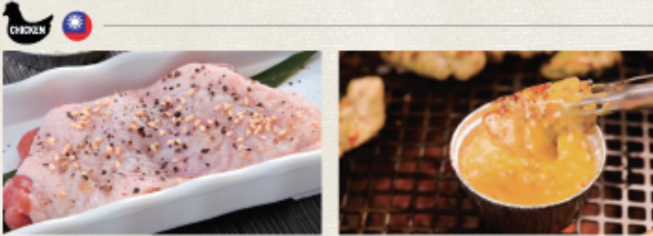
○ 雞腿排 チキン Chicken ・照燒醬 照り焼き Teriyaki ・蒜味醬 ガーリック Garlic ・雙胡椒 ダブルペッパー Double Pepper ○ 雞腿排起士咖哩 チキンチーズカレー Chicken Cheese Curry