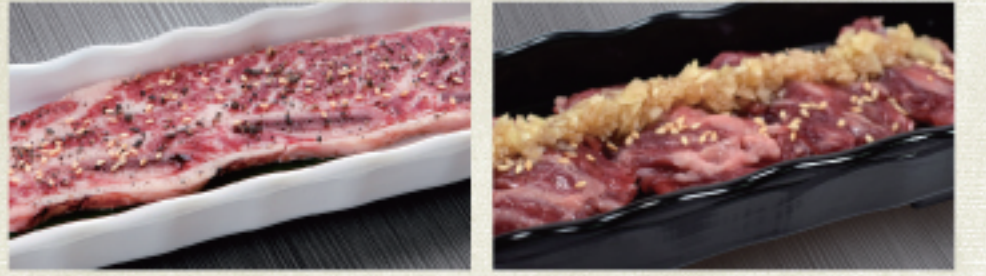
○ Kintan帶骨牛小排 キンタンカルビ Kintan Karubi ・燒烤醬 たれ Tare ・雙胡椒 ダブルペッパー Double Pepper ○ 橫膈膜 はらみ Harami ・燒烤醬 たれ Tare ・蒜味醬 ガーリック Garlic