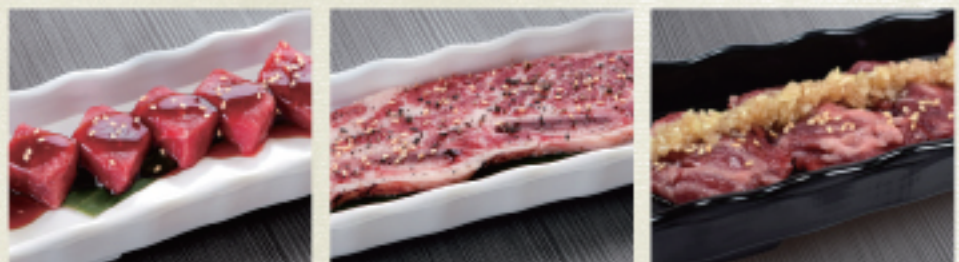
○ 角切牛肉 ダイスステーキ Dice Tender ・燒烤醬 たれ Tare ・辣味噌 スパイス味噌 Spicy Miso ○ Kintan帶骨牛小排 キンタンカルビ Kintan Karubi ・燒烤醬 たれ Tare ・雙胡椒 ダブルペッパー Double Pepper ○ 橫膈膜 はらみ Harami ・燒烤醬 たれ Tare ・蒜味醬 ガーリック Garlic

お肉が選べるお得なランチセット Order 2 plates from your preferred buffet course.