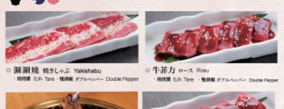
○ 涮涮燒 焼きしゃぶ Yakishabu ・燒烤醬 たれ Tare ・雙胡椒 ダブルペッパー Double Pepper ○ 牛菲力 ロース Rosu ・燒烤醬 たれ Tare ・雙胡椒 ダブルペッパー Double Pepper