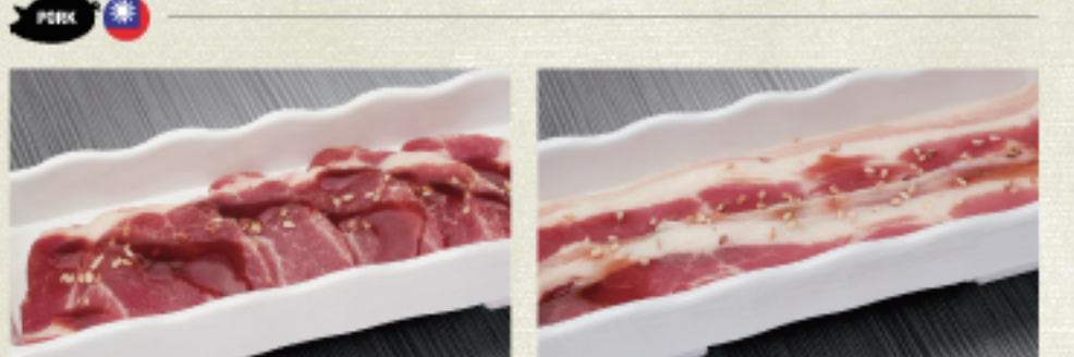
○ 豬梅花 豚ロース Pork Shoulder ・照燒醬 照り焼き Teriyaki ・原味 オリジナル Original ○ 豬五花 豚バラ Pork Belly ・蒜味醬 ガーリック Garlic ・原味 オリジナル Original