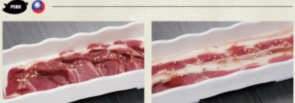
○ 豬梅花 豚ロース Pork Shoulder ・照燒醬 照り焼き Teriyaki ・原味 オリジナル Original ○ 豬五花 豚バラ Pork Belly ・蒜味醬 ガーリック Garlic ・原味 オリジナル Original