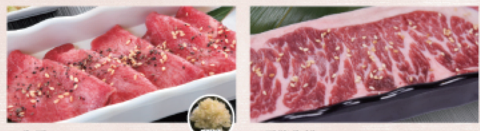
○ 牛舌 牛タン Gyu Tan ・鹽漬醬 ねぎ塩 Salted Scallion ・雙胡椒 ダブルペッパー Double Pepper ○ 霜降牛排 霜降ステーキ Shimofuri Steak ・燒烤醬 たれ Tare ・蒜味醬 ガーリック Garlic ・雙胡椒 ダブルペッパー Double Pepper