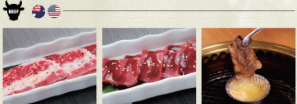
○ 涮涮燒 焼きしゃぶ Yakishabu ・燒烤醬 たれ Tare ・雙胡椒 ダブルペッパー Double Pepper ○ 牛菲力 ロース Rosu ・燒烤醬 たれ Tare ・雙胡椒 ダブルペッパー Double Pepper ○ 蒜味奶油牛腹肉 ガーリックバターカルビ Garlic Butter Karubi