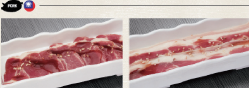
○ 豬梅花 豚ロース Pork Shoulder ・照燒醬 照り焼き Teriyaki ・原味 オリジナル Original ○ 豬五花 豚バラ Pork Belly ・蒜味醬 ガーリック Garlic ・原味 オリジナル Original