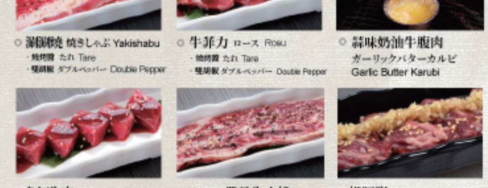
○ 涮涮燒 焼きしゃぶ Yakishabu ・燒烤醬 たれ Tare ・雙胡椒 ダブルペッパー Double Pepper ○ 牛菲力 ロース Rosu ・燒烤醬 たれ Tare ・雙胡椒 ダブルペッパー Double Pepper ○ 蒜味奶油牛腹肉 ガーリックバターカルビ Garlic Butter Karubi