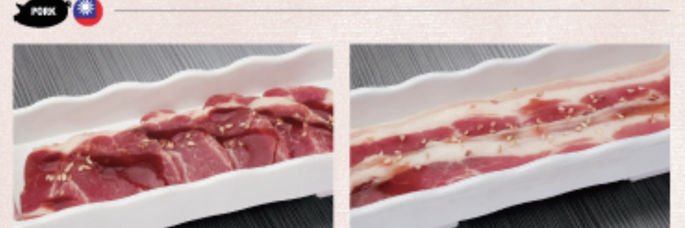
○ 豬梅花 豚ロース Pork Shoulder ・照燒醬 照り焼き Teriyaki ・原味 オリジナル Original ○ 豬五花 豚バラ Pork Belly ・蒜味醬 ガーリック Garlic ・原味 オリジナル Original