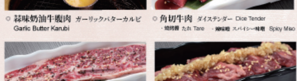
○ 角切牛肉 ダイスステーキ Dice Tender ・燒烤醬 たれ Tare ・辣味噌 スパイス味噌 Spicy Miso ○ Kintan帶骨牛小排 キンタンカルビ Kintan Karubi ・燒烤醬 たれ Tare ・雙胡椒 ダブルペッパー Double Pepper ○ 橫膈膜 はらみ Harami ・燒烤醬 たれ Tare ・蒜味醬 ガーリック Garlic