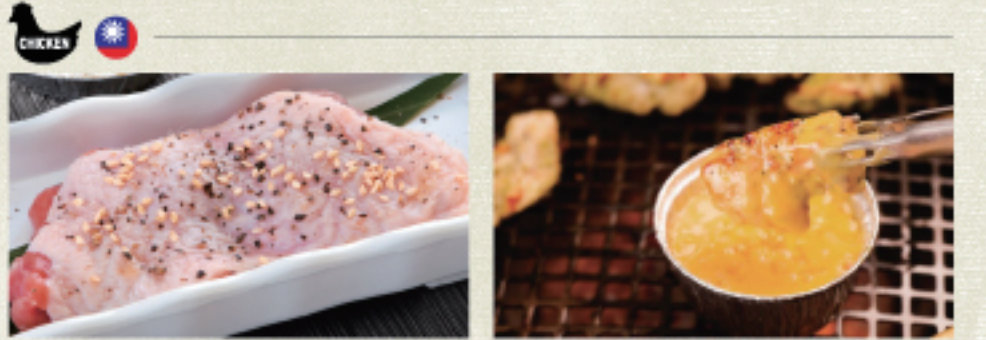
○ 雞腿排 チキン Chicken ・照燒醬 照り焼き Teriyaki ・蒜味醬 ガーリック Garlic ・雙胡椒 ダブルペッパー Double Pepper ○ 雞腿排起士咖哩 チキンチーズカレー Chicken Cheese Curry