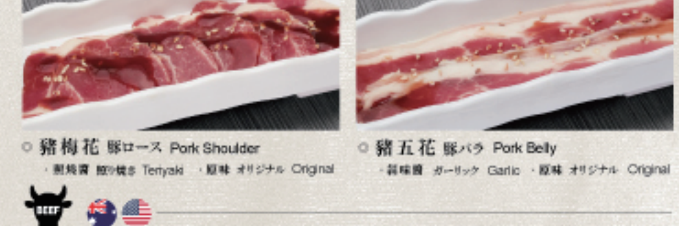
○ 豬梅花 豚ロース Pork Shoulder ・照燒醬 照り焼き Teriyaki ・原味 オリジナル Original ○ 豬五花 豚バラ Pork Belly ・蒜味醬 ガーリック Garlic ・原味 オリジナル Original