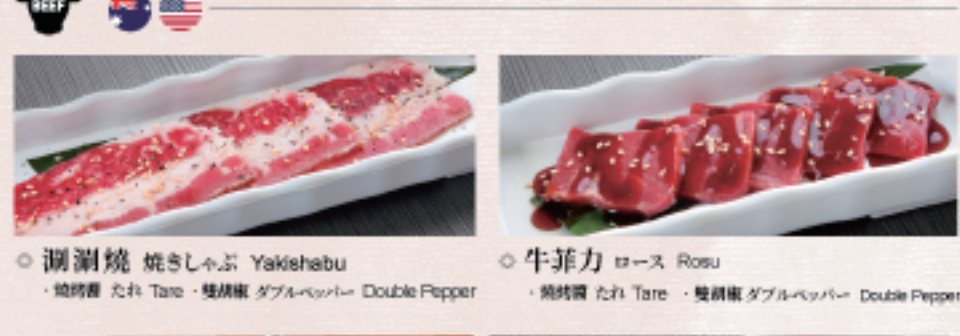
○ 涮涮燒 焼きしゃぶ Yakishabu ・燒烤醬 たれ Tare ・雙胡椒 ダブルペッパー Double Pepper ○ 牛菲力 ロース Rosu ・燒烤醬 たれ Tare ・雙胡椒 ダブルペッパー Double Pepper ○ 蒜味奶油牛腹肉 ガーリックバターカルビ Garlic Butter Karubi