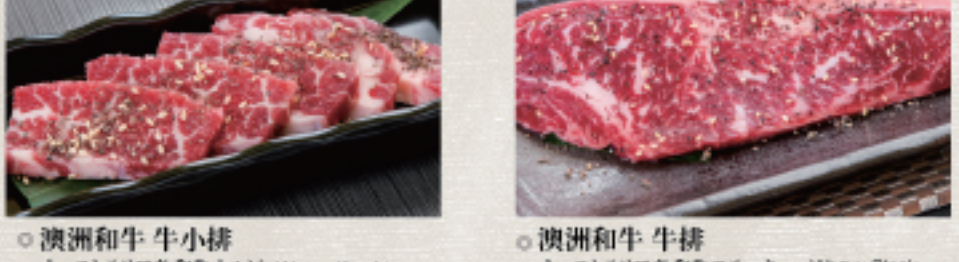
○ 澳洲和牛牛小排 オーストラリア産和牛カルビ Wagyu Karubi ・燒烤醬 たれ Tare ・雙胡椒 ダブルペッパー Double Pepper ○ 澳洲和牛牛排 オーストラリア産和牛ステーキ Wagyu Steak ・燒烤醬 たれ Tare ・雙胡椒 ダブルペッパー Double Pepper