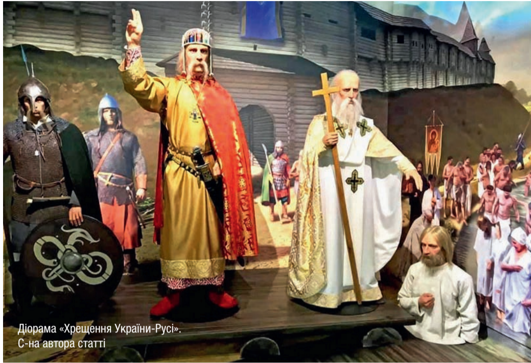
Діорама «Хрещення України-Русі».

Найширший розділ презентує звичайну боротьбу за Українську державу – від часів великого гетьмана Мазепи до наших днів. Перед глядачем постають гетьман Іван Мазепа, автор першої української Конституції Пилип Орлик, творці УНР, лідери визвольного руху новітньої доби. Відвідувачі стають очевидцями проголошення незалежності 1991 року, Помаранчевої революції та Революції Гідності. Я побачив тут і мужніх кіборгів – захисників До-