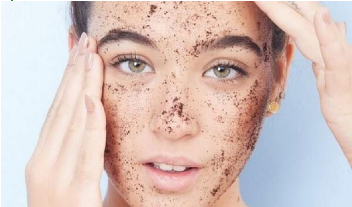
Sử dụng dầu dừa để tẩy tế bào chết cho da mặt

Sử dụng dầu dừa kèm cơm dừa xay nhuyễn hoặc một chút đường nâu là bạn đã có ngay 1 hỗn hợp tẩy tế bào chết vô cùng an toàn. Mỗi tuần bạn nên tẩy tế bào chết 1-2 lần để loại bỏ da chết, giúp da hồng hào và khỏe mạnh.