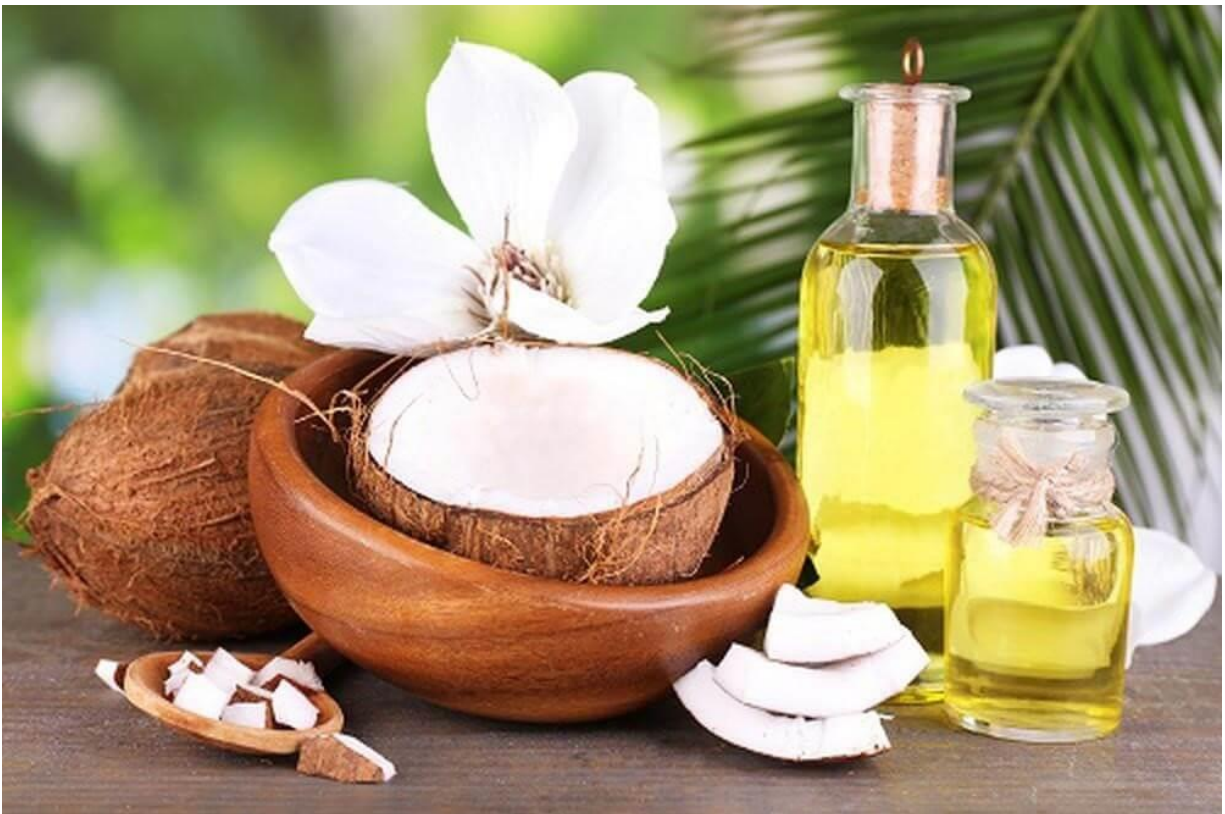
Dầu dừa giúp làn da khỏe đẹp và tươi trẻ

Ngoài ra, cơ địa một số người có thể không phù hợp với dầu dừa, do đó có thể gặp phải tình trạng ngứa, nổi mề đay trên da. Người có da dầu không nên sử dụng dầu dừa để tránh da bị đổ dầu nhiều hơn, gây mất thẩm mỹ và sinh mụn trên da. Sau khi sử dụng, hãy làm sạch da thật kỹ, không để dầu thừa tồn tại trên da, làm bít tắc lỗ chân lông, khiến da trở nên xấu xí.