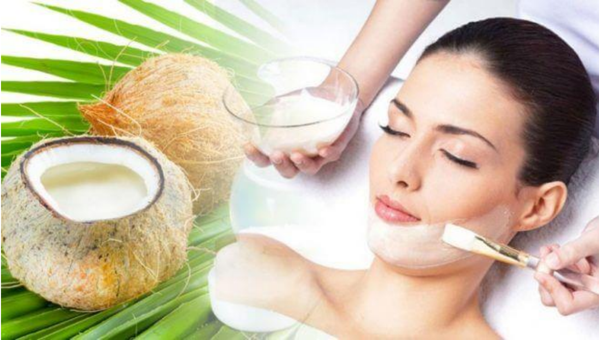
Đắp mặt nạ dầu dừa

Dầu dừa kết hợp với vitamin E, nghệ, sữa chua,... đều tạo thành mặt nạ làm đẹp da hiệu quả. Bạn hãy sử dụng thường xuyên các loại mặt nạ này để giúp da tươi trẻ và khỏe mạnh.