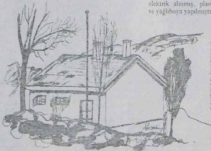
ÇAMPINAR İLKOKULU (Çizim: İbrahim Şengül)

Cuma namazı için Göy- nükler ya da Hacivelli'ye gidiliyor.