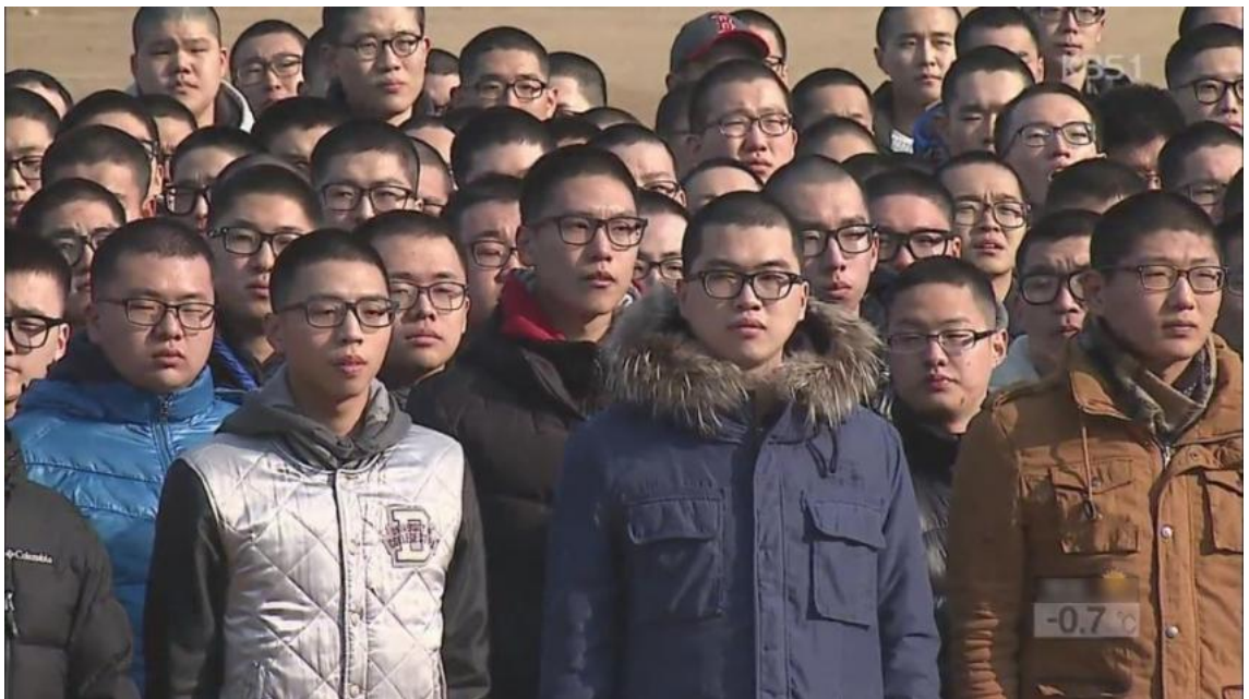
"인종차별에 성희롱까지 하는 스트리머 수준 알만하다"