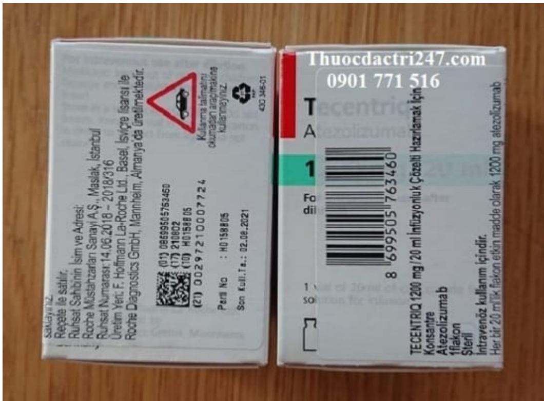
Thuốc tecentriq 1200mg/20ml atezolizumab điều trị một số bệnh ung thư di căn (1)