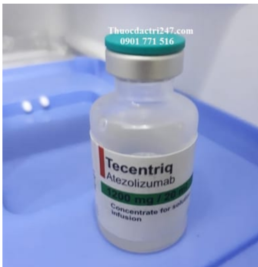
Thuốc tecentriq 1200mg/20ml atezolizumab điều trị một số bệnh ung thư di căn (3)