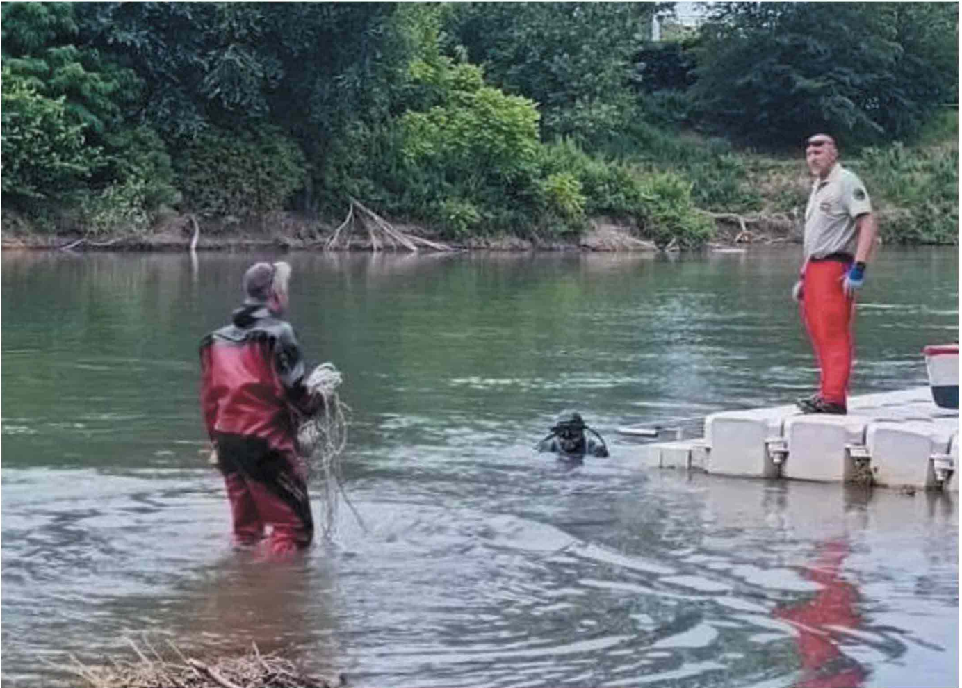
Le ricerche dei sommozzatori hanno raggiunto anche le sponde di fronte ai Murazzi