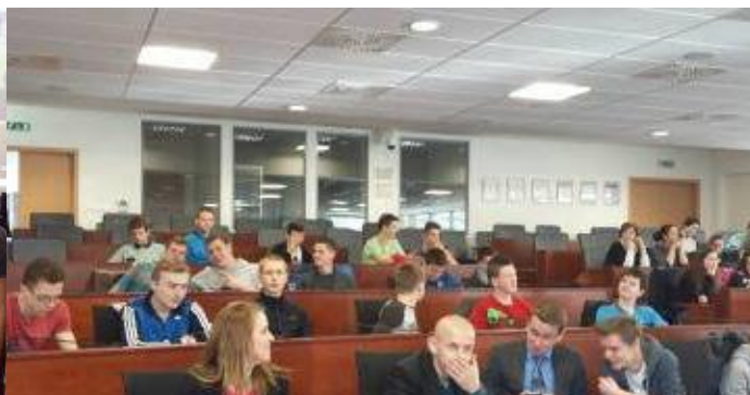
FOTOSÚŤAŽ V TRENČÍNE