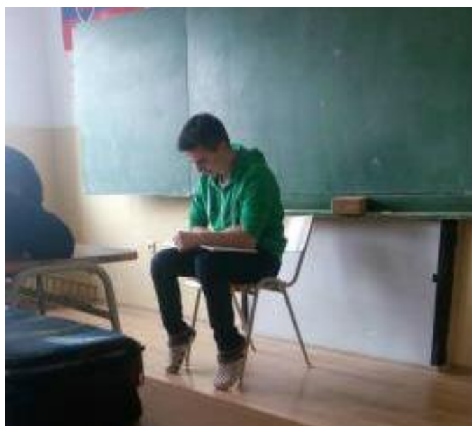
MAREC - MESIAC KNÍH