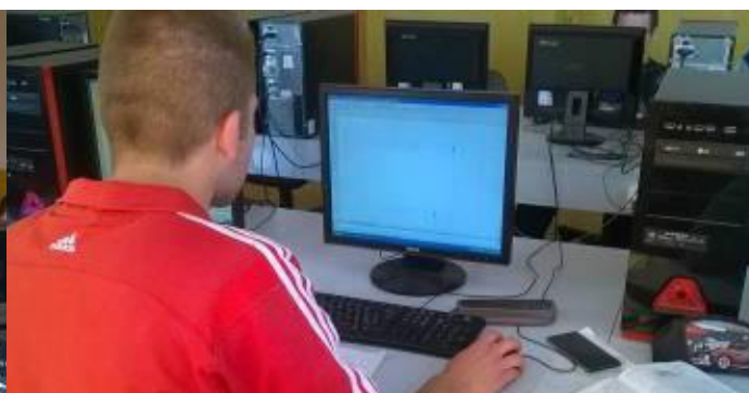
SÚŤAŽ V TECHNICKOM KRESLENÍ