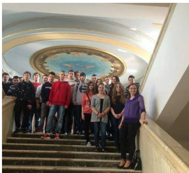
V MESTSKOM DIVADLE - ŽILINA