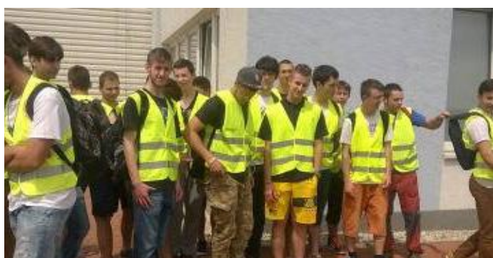
EXKURZIA V PSL