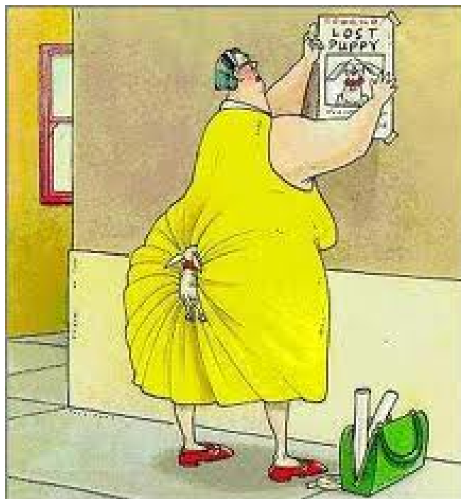
Zaginął mi Piesek

- Phi! Do jednego kłosa będę kombajn zapuszczać?