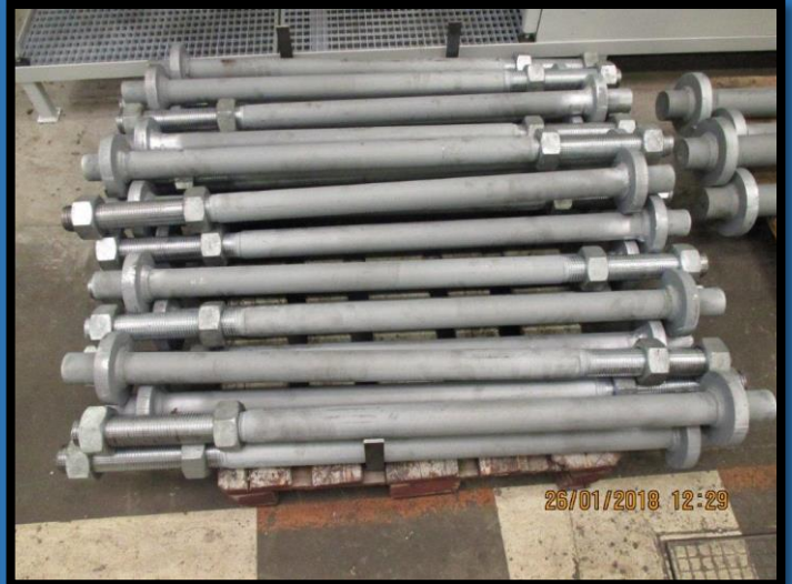
Ankerstangen M56 en M80 met opgelaste ring (thermisch verzinkt)