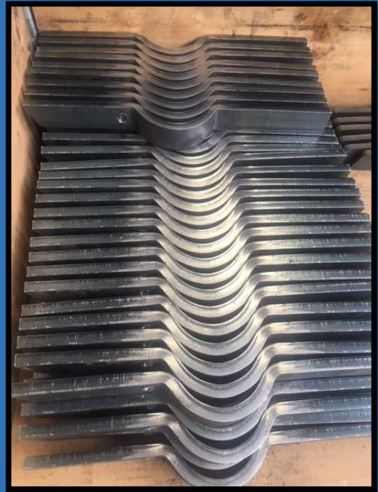
Geplooide beugels 30x10