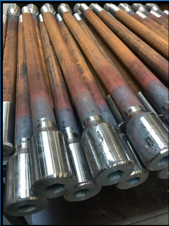
Slijtbouten kop diameter 70 M36x730 42CrMo4