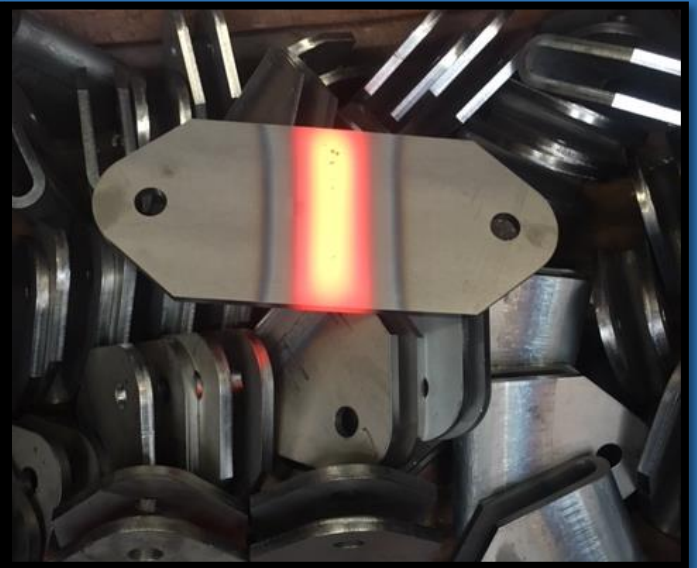
Warmgevormde beugels in plaatdikte 10mm