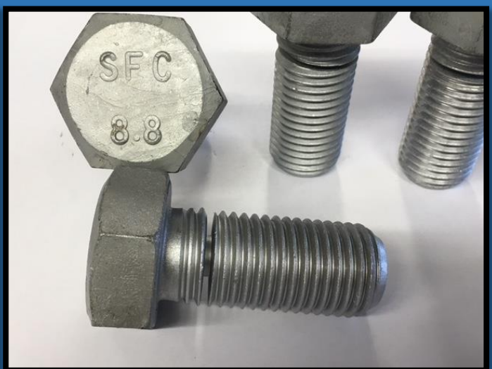
Breekbouten 8.8 M36 met keeldiameter