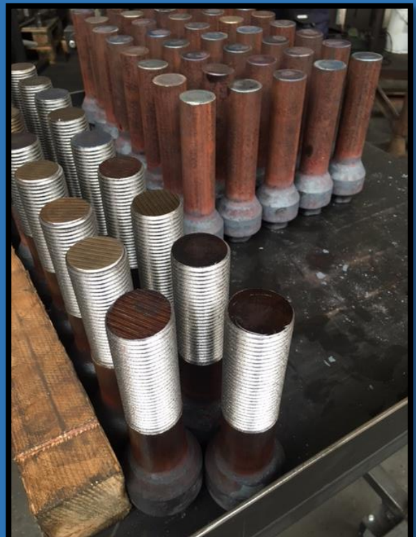
Slijtbouten diameter 25 M36x175