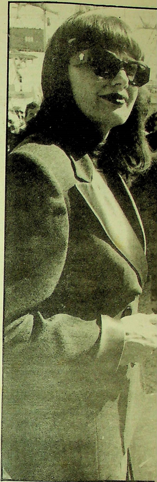
Aneta Valentić ljupkim je zamahom sjek

Zbog toga, svaki sporazum na papiru može biti uspješan, ali treba sačekati njegovu provedbu. Jugoslaviji za opstanak nije prije ili kasnije, a cjelovitoj Bosni i Hercegovini dajem ih jave manje. Ne znam zašto oni prave novu bačvu baruta.