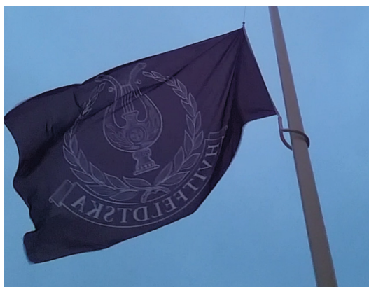
Hvitfeldtskas flagga hissades i de nya flaggstängerna.