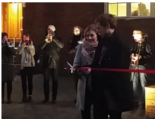
Elevkårens representanter klippte bandet.