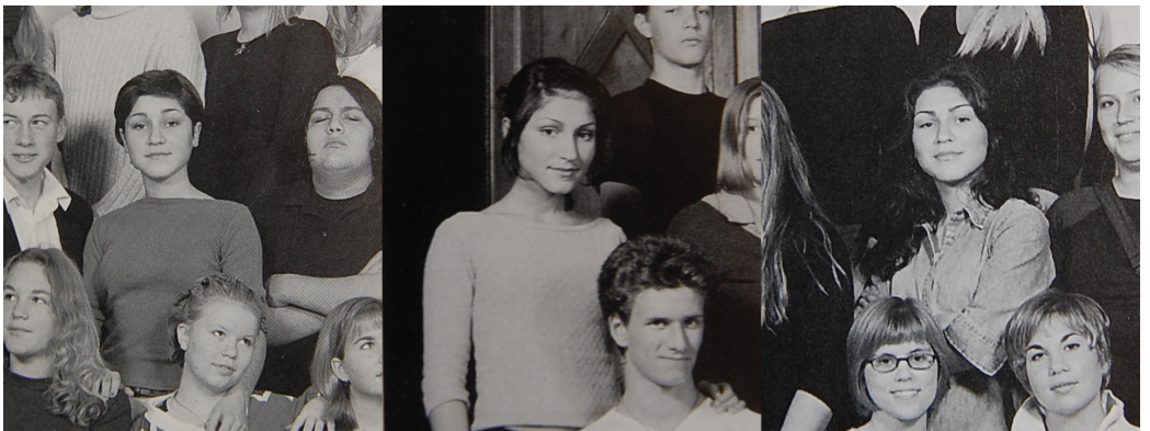
Laleh genom åren.