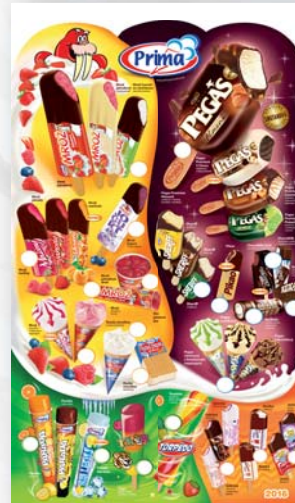
Plastové menu Prima