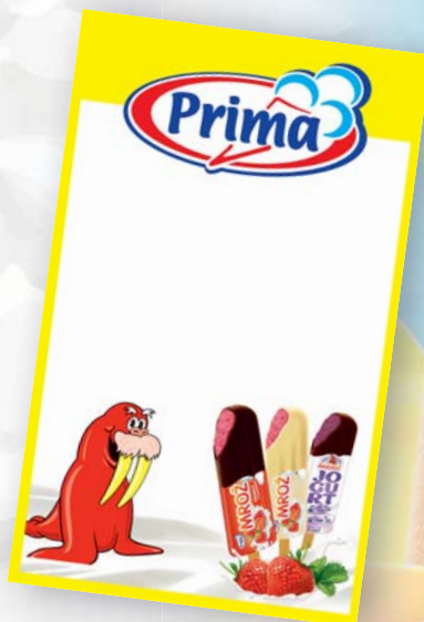
Popisovateľná tabuľa Prima