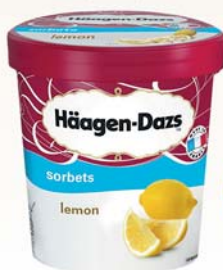
LEMON sorbet (519547)