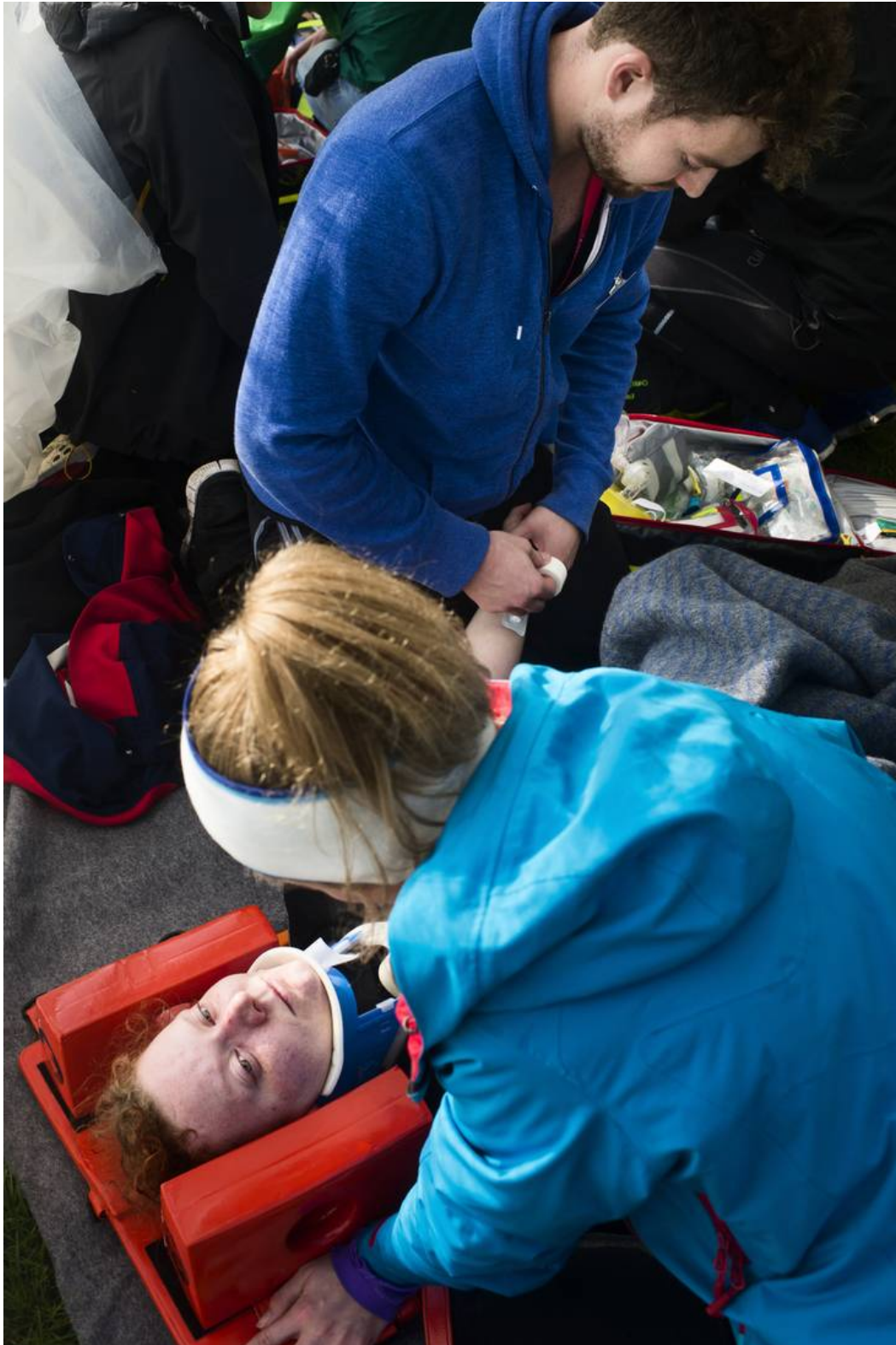
Er der mistanke om brud på nakke eller ryg, er det vigtigt, at kun professionelle flytter på patienten.