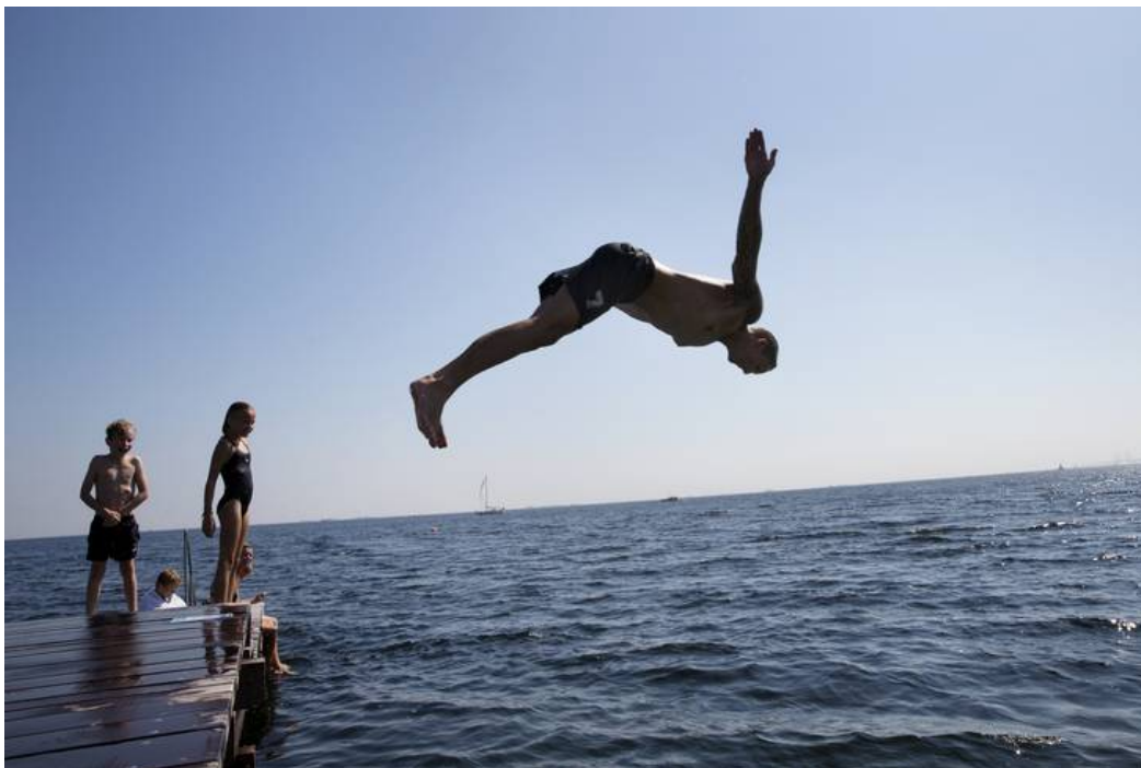
Det kan koste både liv og førlighed, hvis man foretager et hovedspring uden at have sat sig ind i forholdene.

- Det klassiske er jo, hvis det er en fest, hvor der er alkohol involveret, og en er lidt kæk og i mørket tager et spring et sted, hvor de ikke er kendt. Et øjeblik uopmærksomhed kan få alvorlige konsekvenser.