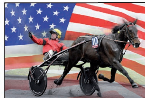
BOLD EAGLE 1'10 READY CASH - REETHI RAH JET CLASSIQUE - GAINS : 2 239 300 €