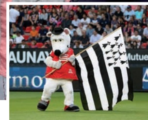
Erminig, la mascotte du Stade Rennais.