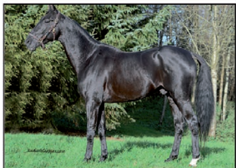
A NOUS TROIS 1'12 ORLANDO VICI - QUALLAS GAINS : 383 760 €