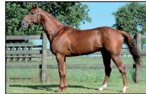
VILLEROI 1'11a - 1'13m OISEAU DE FEUX - POCAHONTAS CLASSIQUE - GAINS : 643 890 €