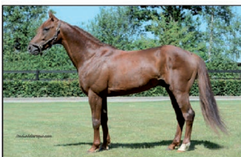
BOOSTER WINNER 1'10a - 1'11m LOVE YOU - QUILLE VIRETAUTE CLASSIQUE - GAINS : 892 250 €