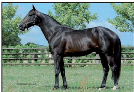
URIEL SPEED 1'13 INDY DE VIVE - NADIA SPEED SEMI-CLASSIQUE - GAINS : 198 280 €