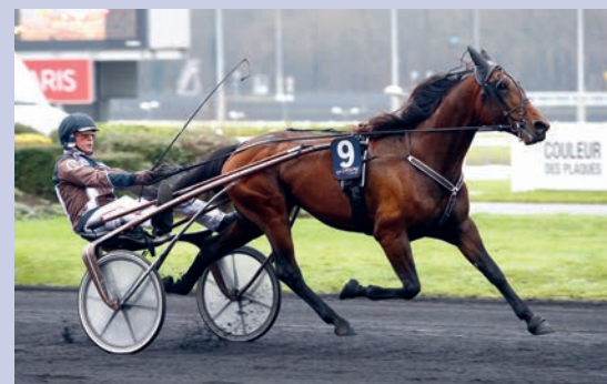
Call Me Keeper (@ScoopDyga)

LE TICKET MALIN : Cette dernière épreuve qualificative pour le Prix d'Amérique Opodo est très difficile à déchiffrer. Toutefois, Call Me Keeper (3) et Boléro Love (9), dont la forme est sûre, semblent les bases les plus fiables pour les trois premières places. Derrière, ils sont sept ou huit à pouvoir prétendre monter sur le podium. Couplé G/P : 3-9