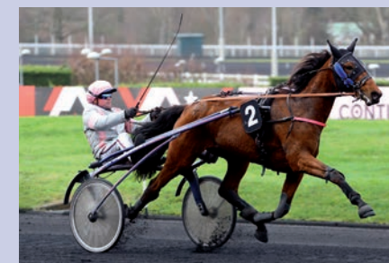
Erminig d'Oliverie

LE TICKET MALIN : la belle impression laissée par Erminig d'Oliverie (7) dans le Prix Une de Mai en fait ici une favorite incontournable. Écume de Réville (8) devrait apprécier le parcours. Couplé Ordre : 7-8.