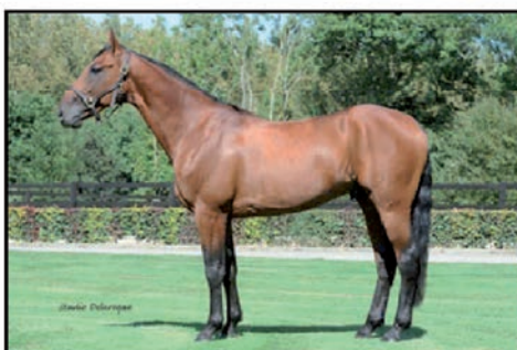
BOLERO LOVE 1'10 LOVE YOU - ORELADY CLASSIQUE - GAINS : 714 080 €