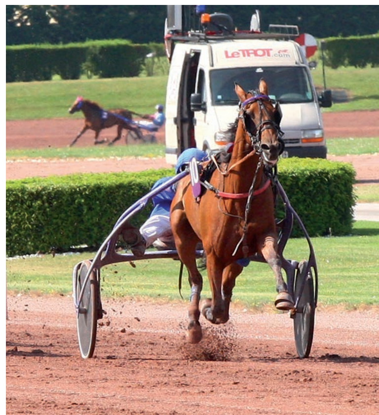
Class Pettevinière a été l'un des bons achats à réclamer de l'année 2016, s'imposant au cours de l'été à Enghien et prenant plusieurs places.

« Je trouve le principe mal fait : les taux de réclamation devraient aller en décroissant au cours de l'année et non pas le contraire, comme c'est le cas maintenant. On pourrait ainsi avoir des prix assez bas en fin de saison, nous permettant de faire du turn-over dans nos écuries à l'arrivée des jeunes chevaux. Et en proposant des prix bas, cela pourrait motiver des amateurs, par exemple, prêts à acheter un cheval peu cher et surtout à un prix plus proche de son espoir de gains que trop élevé. De plus, je souhaiterais qu'on puisse choisir nous-mêmes le taux de réclamation, avec une première fourchette pour les chevaux s'élançant au premier échelon et une seconde pour le second échelon. Le prix serait le plus proche de la réalité ou, en tout cas, de la valeur qu'on lui attribue. Un tel système m'aurait permis de ne pas passer à côté de quelques transactions, j'en suis convaincu. »