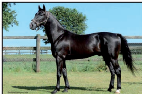
REVE DE BEYLEV 1'09a - 1'12m FORTUNA FANT - HELOISE POTERIE CLASSIQUE - GAINS : 1 234 060 €