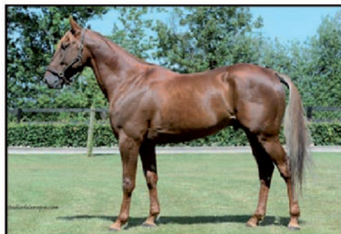
ALADIN D'ECAJEUL 1'09 QUAKER JET - NANCY D'ECAJEUL CLASSIQUE - GAINS : 998 640 €