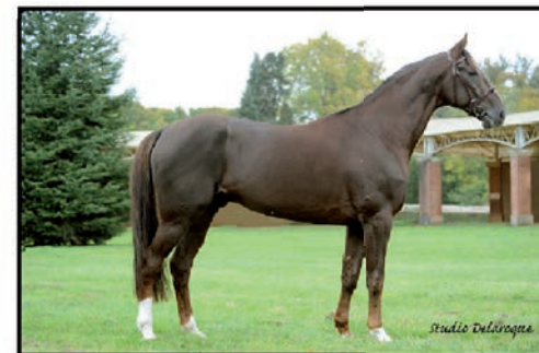
TWIST DE LA VALLEE 1'13 IN LOVE WITH YOU - EILLEN DU CHENE GAINS : 259 320 €