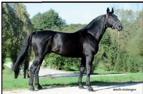
VALKO JENILAT 1'11a - 1'13m KEPLER - PERLE DU ROC SEMI-CLASSIQUE GAINS : 582 690 €