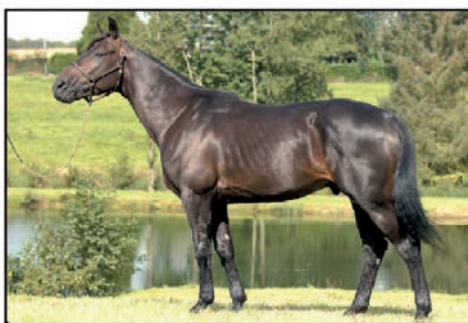
PRINCE D'ESPACE 1'11 HIMO JOSSELYN - EDEN'S STAR CLASSIQUE - GAINS : 713 950 €