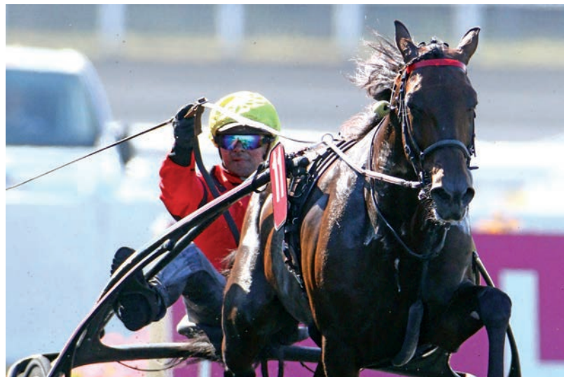
Bold Eagle (@ScoopDyga)

En 2016, Bold Eagle avait mis fin à la malédiction des gagnants du Prix de Belgique dans le Prix d'Amérique. Le fils de Ready Cash est d'ailleurs le seul à avoir réalisé ce doublé au cours des vingt dernières années. Il faut remonter en 1993 pour retrouver Queen L, lauréate de la dernière des « 4B » avant de s'imposer dans le Prix d'Amérique deux semaines plus tard. À noter que l'entourage de Bold Eagle a décidé de ne pas passer par le Prix de Belgique cette année pour garder plus de fraîcheur en vue de la fin du meeting d'hiver. L'objectif est clair : remporter la Triple Couronne (Prix d'Amérique, Prix de France et Prix de Paris).