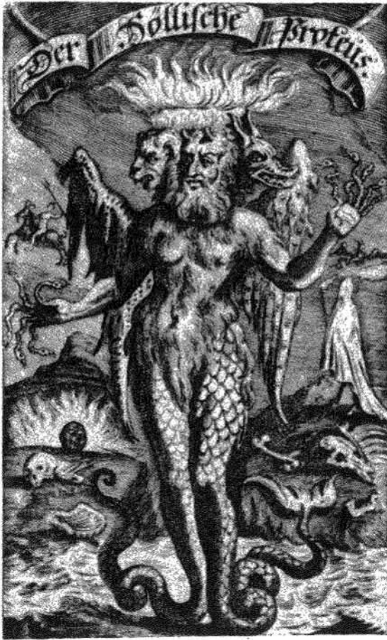
Τρικέφαλος ΔΑΙΜΩΝ. Γερμανική χαλκογραφία. 1695.

και νῦν εἰς τὰς Νεράιδας, αἱ ὁποῖαι ἀντιστοιχοῦν πρὸς τὰς ἀρχαίας νύμφας. Αὗται δὲν εἶναι μόνον ἐπιβλαβεῖς, ἀλλὰ καὶ εὐεργετικαὶ εἰς τὸν ἄνθρωπον. Οἱ δὲ ὑμφόληπτοι τῶν ἀρχαίων εἶναι οἱ σημερινοὶ «νεραϊδοπαρμένοι».