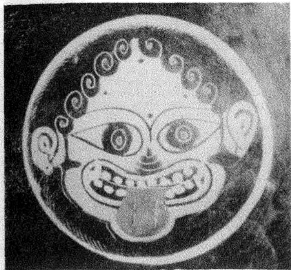
Δαιμονόμορφος Γοργώ. 'Αρχαϊκή 'Ελληνική Τέχνη. ΣΤ' αίών π.Χ.

σ. 440). Είς μόνον τὸ βιβλίον τοῦ Ἰωβίτ' ἀπαντᾷ τὸ ὄνομα τοῦ ἀνθρώποκτόνου καὶ πονηροῦ δαιμονίου Ἄσμοδαίου, διημφεσβητήθη ὁμως σοβαρῶς, ἐάν προήλθεν ἐκ τοῦ Βεδικοῦ Aeshma, καὶ δι' ἄλλους μὲν λόγους, ἀλλὰ καὶ διότι ἡ ρίζα τοῦ ὀνόματος τούτου εἶναι καθαρῶς σημιτική καὶ οὐχὶ περσική (hasmod=ἀπολλύων, καταστρέφων). ἐπὶ πλέον δὲ ὁ ρόλος τῶν δύο τούτων δαιμόνων εἶναι διάφορος, τοῦ μὲν Ἄσμοδαίου ἔχοντος ἐξουσίαν ἐπὶ τῶν παραδιδόντων ἑαυτοὺς εἰς τὰ πάθη τῶν, ἐνῶ ὁ Aeshma εἶναι ὁ δαίμων τῆς βίας καὶ τῆς ὀργῆς, ὁ ἐπικινδυνώδεστος πάντων τῶν δαιμόνων τῆς Avesta.