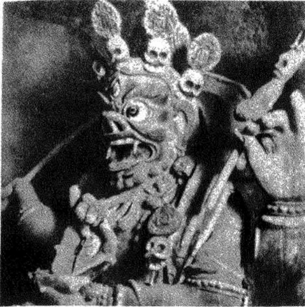
Ἄγαλμα ΔΑΙΜΟΝΟΣ. Θιβέτ. 19 ος αἰών.

τοῦ Θεοῦ ἀγαθός, ἀλλ' ἐλεύθερος, ἔχων ἐπ' αὐτῷ κειμένην τὴν ἐξουσίαν ἢ παραμένειν τῷ Θεῷ ἢ ἀλλοτριωθῆναι τοῦ ἀγαθοῦ, ἐξέπεσε τῶν οὐρανῶν (Μ. Βασίλ., Εἰς τὸν Ἦσ. ΙΔ' § 278· τοῦ αὐτοῦ, Ὅτι οὐκ ἔστιν αἴτιος τῶν κακῶν ὁ Θεός § 8· Δαμασκηνοῦ, Ἐκθεσις Ὁρθοδ. πίστ., Β' 4 κ.λπ.) ἀποστατήσας κατὰ τοῦ Θεοῦ καὶ ὁ διὰ τὴν προτέραν λαμπρότητα αὐτοῦ Ἐωσφόρος ἀποκλήθεις, σκότος διὰ τὴν ἔπαρσιν καὶ ὑπερηφάνειαν αὐτοῦ ἐγένετο, μετ' αὐτοῦ δὲ καὶ αἱ συναποστατήσασαι ἀγγελικαὶ δυνάμεις, εἰς ἀγγέλους σκότους μεταπεσοῦσαι (Δαμασκ., ἐνθ' ἄν. Γρηγορίου Ναζ., Λόγος 38 § 9). Καὶ ἴνα κατὰ τὸν Μ. Ἀθανάσιον εἰπῶμεν, ὁ σατανᾶς δὲν κατερρίφη ἐκ τῶν οὐρανῶν «ἐνεκεν πορνείας ἢ μοιχείας ἢ κλοπῆς», ἀλλὰ διὰ τὴν ὑπερηφάνειαν αὐτοῦ. «Ὅτω γὰρ εἰρηκεν Ἀναβήσομαι καὶ θήσομαι τὸν θρόνον μου ἐνώπιον τοῦ Θεοῦ καὶ ἔσομαι ὁμοίος τῷ Ὑψίστῳ» (Περὶ παρθενίας § 5).