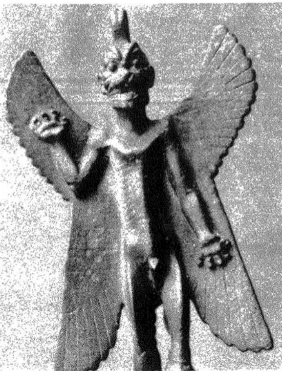
Ὁ ΔΑΙΜΩΝ Παζόζου τῶν Ἀσσυρίων. Ζ' αἰὼν π.Χ. Μουσείον Λούβρου.

4. Κατὰ τῶν χρόνων τῆς Βαβυλωνίου αἰχμαλωσίας καὶ μετέπειτα εἶναι ἀξιοπαρατήρητον, ὅτι ἐπέδρασε μὲν ἡ ἐν Βαβυλῶνι καὶ Περσίᾳ ἀνεπτυγμένη διδασκαλία περὶ πνευμάτων ἐπὶ τῆς ἀποκρύφου γραμματείας τοῦ Ἰσραὴλ, εἰς τὴν ὁποίαν παρεοῶγονται καὶ στοιχεῖα ξένα πρὸς τὴν Μωσαϊκὴν καὶ τὴν προβαβυλωνίων προφητικὴν παράδοσιν, τὸ γνήσιον ὁμοῦ προφητικὸν πνεῦμα παραμένον μακρὰν παντὸς ὀθνείου στοιχείου ὀθεῖται μόνον πρὸς πληρεστέραν ἀνάπτυξιν τῆς περὶ πονηρῶν πνευμάτων διδασκαλίας, πρὸ παντός ὡς πρὸς τὸ πλῆθος αὐτῶν (παρὰ τῷ Δανιὴλ) καὶ ὡς πρὸς τὸν ρόλον αὐτῶν ἐναντι τοῦ Θεοῦ καὶ τοῦ κόσμου (πρὸ παντός ἐν Β' Μακκαβαίων), εἰς τὸν ὅσον ὥστε ἐπεκροτήθη τελικῶς ἡ παρατήρησις τοῦ Smit, καθ' ἣν ἡ βαβυλωνιακὴ, περσικὴ καὶ ἑλληνικὴ δαιμονολογία δὲν ἤσκησαν ἄλλην τινὰ ἐπίδρασιν ἐπὶ τῆς περὶ δαιμόνων ἰουδαϊκῆς διδασκαλίας, πλην μόνον τοῦ ὅτι ἔδωκαν ἀφορμὴν, ὅπως ἐξελιχθῇ αὐτὴ ἐκ τῶν ἐνδον δι' ἀναπτύξεως κανονικῆς τῶν ἰδίων αὐτῆς καὶ ἐν μορφῇ σπέρματος στοιχείων (Παρά Π. Τρεμπέλα, Δογματικῆ, Α',