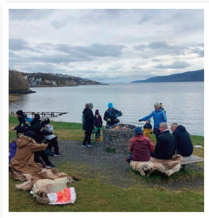
Verdensdagen for psykisk helse ble markert i Ornesvika med bålcaffe og natursti.

Folk flest er for lite fysisk aktive. Kun tre av ti voksne og eldre er aktive nok, og bare halvparten av 15-åringene. Ungdom og eldre bruker også en stor del av våken tid stillesittende. Fysisk aktivitet kan blant annet bidra til at vi kan stå lengre i arbeid, at vi kan være selvhjelpne lengst mulig og at behovet for helse- og omsorgstjenester reduseres.