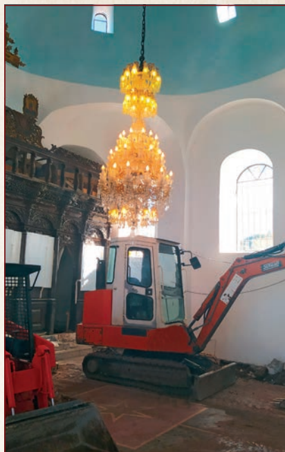
Από τις εκτελούμενες εργασίες