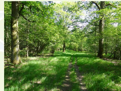
de plaatselijke 'Allée Royale' in Regniessart

De grasweg eindigt na een halve kilometer, voor sparren, hier sla je linksaf. Wat verder laat je een grasweg rechts liggen en je blijft rechtdoor gaan. Wat verder begint een prachtige afdaling die je weer naar Regniessart brengt.