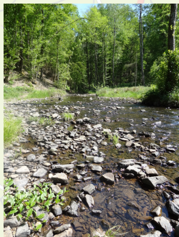
Ruisseau de Nouée

TOPOGRAFISCHE KAARTEN NGI: 58/5-6 (1:20.000)