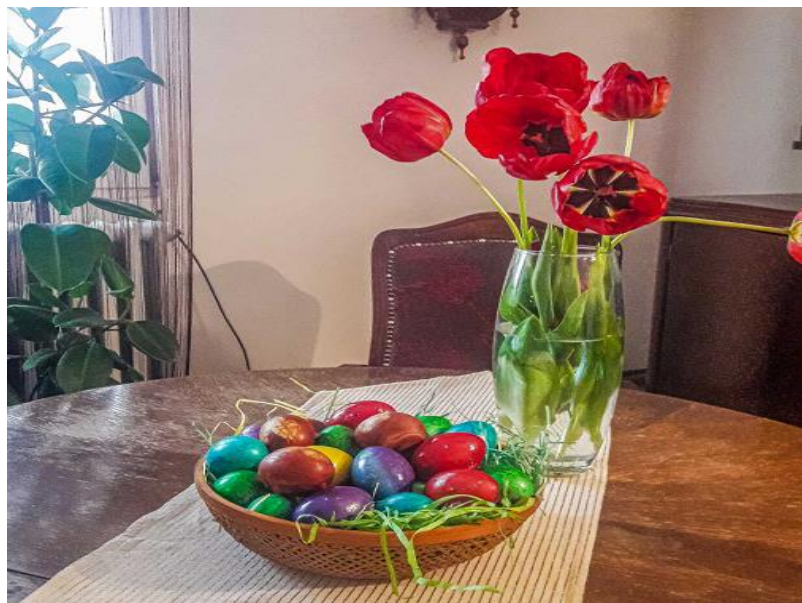
Ilija Lazić 7-3