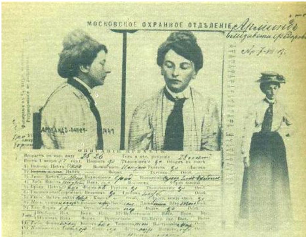
La camarade Inessa Armand, morte du choléra en 1920, à l'âge de 46 ans

(Quelques problèmes dans l'analyse de la crise actuelle)