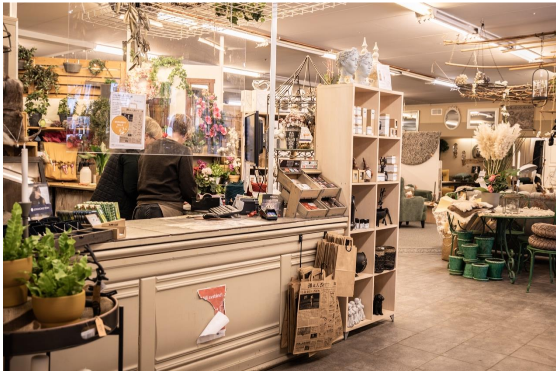
Entré och kassa

I bilagor finns mer detaljerad information.