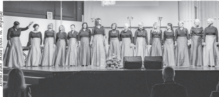
Ženski zbor Sklad