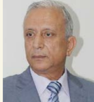
لواء حسين مصطفى

ولفت إلى أن الدولة المصرية اقتحمت القرار الصعب لاستكمال خطوات الإصلاح الاقتصادي ولا عودة للوراء، مشدداً على ضرورة العمل الجاد للتحويل من الهيكلية المالية إلى الهيكلية الفنية عبر زيادات الصادرات وخفض الواردات.