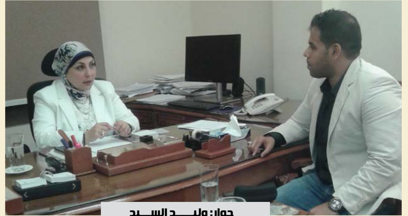
حوار: وليد السيد

لا يعترف إلا بالموهوبات ، وباعتبار أن المرأة الريفية بوجه خاص تواجهها تحديات معينة منها التقاليد والعادات وأن المجتمع يرفض عمل المرأة وكونها سيدة أعمال واجهت الكثير من الصعوبات في ظل هناك الثقافة ذكورية التي تسيطر على قطاع كبير .