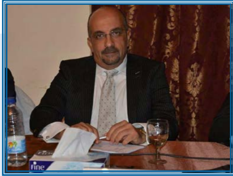
حوار: نثروك علاء

■ السوق في حاجة إلى ضخ بضاعة جديدة وزيادة الفرص والأدوات الممنوحة