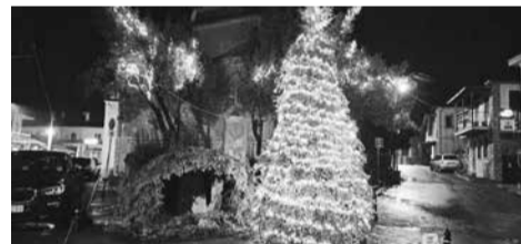
Ο Χριστουγεννιάτικος στολισμός του κέντρου.

Δεύτερο Σαββατοκύριακο του Δεκέμβρη: Χειμωνιάτικος καιρός. Βροχή, χαμηλή θερμοκρασία, αέρας και ψηλά στο Μαίναλο χιόνι. Η θερμοκρασία κυμαίνεται σε μονοψήφια νούμερα. Κίνηση αρκετή το διήμερο και σε αυτό βοήθη η χειμωνιάτικη ατμόσφαιρα. Η βδομαδιάτικη εικόνα του χωριού παρουσιάζει δύο όψεις εξαιρετικά αντίθετες. Τις πέντε πρώτες μέρες ήσυχη ατμόσφαιρα, αραϊή κίνηση στους δρόμους και λίγοι θαμώνες στις καφετέριες. Και ξαφνικά όλα αλλάζουν την Παρασκευή το βράδυ. Οι δρόμοι γεμίζουν και τα καταλύματα φωτίζονται. Το Σάββατο και ιδιαίτερα την Κυριακή πολυκοσμία και όλα γεμάτα με επισκέπτες του διημέρου. Όλα αυτά διακό-