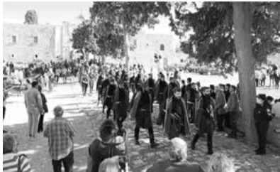
Από τον φετινό εορτασμό.