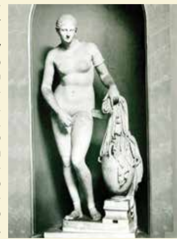
Η Αφροδίτη της Ταυρίδας

Στο μουσείο λοιπόν του Ερμιτάζ εκτίθενται πάνω από χίλια Ελληνικά εκθέματα της κλασικής και της βυζαντινής περιόδου αποδεικνύοντας ότι η Ελληνική τέχνη οποιασδήποτε περιόδου είναι παγκοσμίως κορυφαία και ανεξάντλητη και θα δημιουργεί πάντα τον παγκόσμιο θαυμασμό και αναγνώριση.