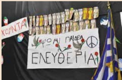
Από τις εικαστικές δημιουργίες των μαθητών