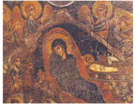
«Η Γέννηση» έργο Κόντογλου

Κρύο τάντανο έκανε, παραμονή Χριστούγεννα. Ο αγέρας σα να 'τανε κρύα φωτιά κι έκαιγε. Μα ο κόσμος ήτανε χαρούμενος, γεμάτος κέφι. Είχε βραδιάσει κι ανάψανε τα φανάρια με το πετρόλαδο. Τα μαγαζιά στο τσαρσί φεγγοβλούσανε, γεμάτα απ' όλα τα καλά. Ο κόσμος μπεινόβγαινε και ψώνιζε: από το 'να το μαγαζί έβγαινε, στ' άλλο έμπαινε. Κι όλοι χαιρετιόντανε και κουβεντιάζανε με γέλια, με χαρές. Οι μεγάλοι καφενέδες ήτανε γεμάτοι καπνό από τον κόσμο που φουμάριζε. Ο καφενές τ' Ασημένιου είχε μεγάλη φασαρία, χαρούμενη φασαρία. Είχε μέσα δύο σόμπες και τα τζάμια ήτανε θαμπά, απ' όξω έβλεπες σαν ήσκιους τους ανθρώπους. Οι μουσερήδες είχανε βγαλμένες τις γούνες από τη ζέστη, κόσμος καλός, καλοπερασμένοι νοικοκυραίοι. Κάθε τόσο άνοιγε η πόρτα και μπαίνανε τα παιδιά που λέγανε τα κάλαντα. Άλλα μπαίνανε, άλλα βγαίνανε. Και δεν τα λέγανε μισά και μισοκούτελα, μα τα λέγανε από την αρχή ίσαμε το τέλος, με φωνές ψαλτάδικες, όχι σαν και τώρα, που λένε μοναχά πέντε λόγια μπρούμυτα κι ανάσκελα, και κείνα παράφωνα.