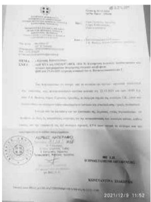
Το έγγραφο της Δ/σης Υγείας Αρκαδίας.