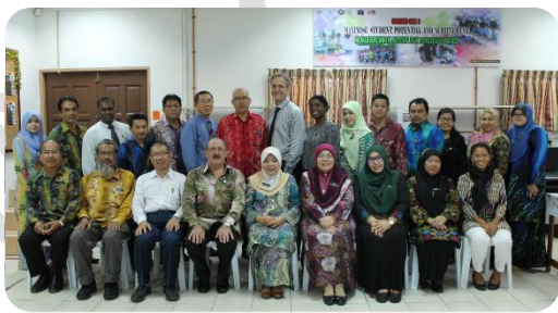
CPD LeadED : SLTs ,EA & EP with Sarawak Education Director