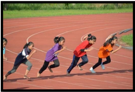
Para atlit perempuan memulakan larian di balapan.

Disediakan oleh : MALIZAN BINTI MUSTAPHA