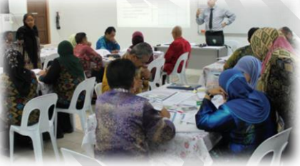
CPD LeadED for SLTs in session