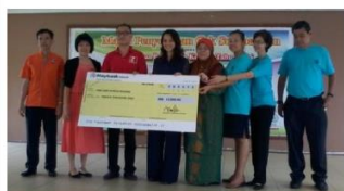
Sempena Pameran Kerjaya II pada 8 April 2016, EduQuest Education Services telah menyumbang sebanyak RM12,000 kepada Tabung Pendidikan dan Kebajikan Murid di SMK Sungai Maong.