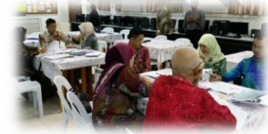
Collaborative /cooperative activities for SLTs