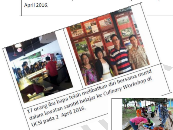
17 orang ibu bapa telah melibatkan diri bersama murid dalam lawatan sambil belajar ke Culinary Workshop di UCSI pada 2 April 2016.