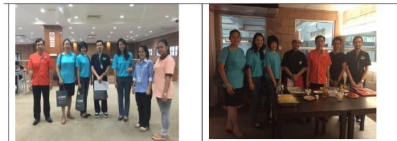
3 orang ibu bapa selaku AJK PIBG DAN ahli KSIB yang diketuai oleh YDP PIBG telah menyertai lawatan sambil belajar ke ICATs pada 29 April 2016.

Pegawai dari PULAPOL (Malaysian Police Training Centre) dan Persatuan Pengakap juga menyumbang tenaga sebagai hakim untuk acara lintas hormat semasa Kejohanan Balapan dan Padang SMK Sungai Maong pada 4 Mei 2016.