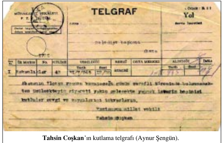
Tahsin Coşkan'ın kutlama telgrafı (Aynur Şengün).