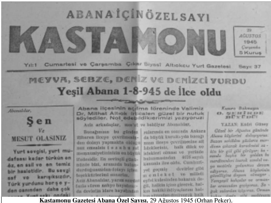
Kastamonu Gazetesi Abana Özel Sayısı. 29 Ağustos 1945 (Orhan Peker).

Kaymakamlığına' deyimini kullanarak, Abana-Kastamonu yolunun açılmasını ve Abana'ya liman yapılmasını istedim. (...) İlçe olunca, Abana'ya vapur uğratma girişiminde bulduk ve bunu başardık. İnebolu 'dan dönen ve adına ' Cide Postası ' denen vapur, daha önceleri Cide 'den dönerdi ve adını buradan alıyordu. Daha sonra İnebolu 'ya kadar uzatılmıştı. Cide Postası , bizim sürekli isteğimiz sonunda Abana 'ya kadar geldi(*). Daha sonra Ayancıklılar direndi, Ayancık 'tan dönmeye başladı bu vapur. Elbette Abana'ya da uğradı" (AG, 15 Kasım 1977). *) Abana 'ya "Cide Postası"ndan uğratılan ilk vapur " Tırhan "dır (18 Mayıs 1946).