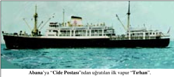
Abana'ya “Cide Postası”ndan uğratılan ilk vapur “Tırhan”.

mağşeri bir kalabalıktı. O tarihten itibaren Abana'da yeni bir ticaret, deniz ticareti başladı. Ben de nakliyecilik ve puantörlük işlerine başladım. 1953'te politik nedenlerle ilçeliğimiz elimizden alınca, Abana'ya vapur uğratmayı da kaldırdılar. Ben yine yılmadım. Tüccar gemilerinin acentalığını aldım. Böylece, Abana'ya vapur uğratmayan Denizyolları ile rekabete girmiş olduk. Abana'dan koyun, sandalye ve öteki ticari eşyaları serbest ticaret gemileri ile yollamaya başladık. Aradan uzun