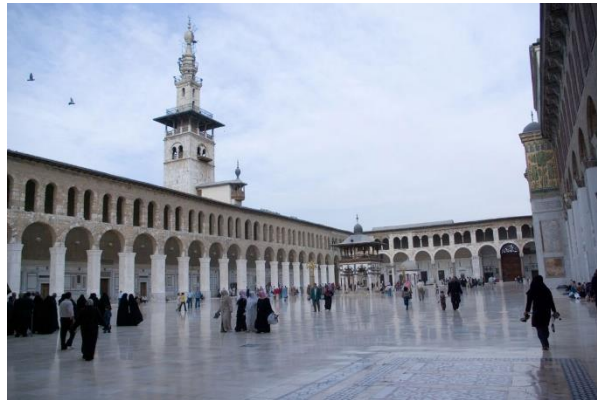
Masjid Umayyah di Damsyik, lokasi Imam Al-Ghazali beruzlah

Musuh-musuh Islam sama ada dari luar atau dari dalam kalangan umat Islam sering mefitnah Imam Al-Ghazali sebagai penganut ajaran kaum falsafah. Benarkah begitu? Tentu sahaja tidak benar!