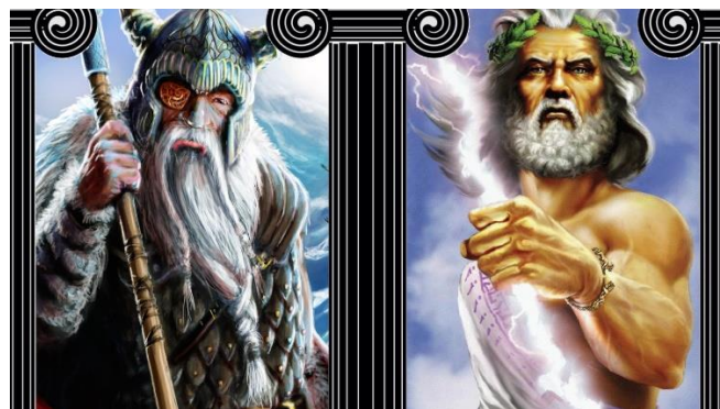
Odin dan Zeus

Kesimpulannya, semua itu bersifat lemah. Mengapa? Kerana semuanya miskin, yakni perlukan itu ini. Yang bersifat lemah pasti bukan Tuhan. Mengapa mereka pula yang dipertuhankan?