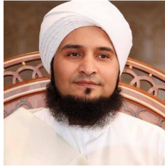
Habib Ali Al-Jufri

Dia pun menyampaikan jawabannya sebagai berikut : “Ketahuilah, sesungguhnya Tarekat Saadah Aal Abi ‘Alawi merupakan salah satu tarekat kaum sufi yang dasarnya adalah ittibâ’ (mengikuti) Quran dan sunah, pokoknya adalah sidqul iftiqôr (benar-benar berasa kepada Allah) dan syuhûdul minnah (menyaksikan bahawa kesemuanya merupakan kurniaan Allah). Tarekat ini mengikuti ittiba’ manshûsh dengan cara khusus dan menyempurnakan semua dasar (ushûl) untuk mempercepat wusul.