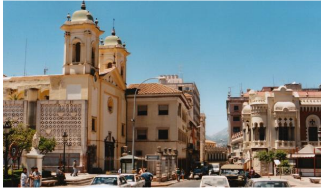
Sabtah (Ceuta), Morocco. Salah satu tempat berjejaknya pengasas Tarekat Asy-Syaziliyyah