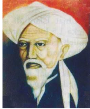
Gambaran wajah Syeikh Abdus Samad

Kitab-kitab susunan Syeikh Abdus Samad al-Falimbani yang bersangkutan dengan Hujjatul Islam Imam Al-Ghazali :