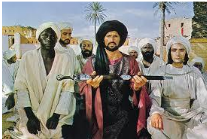
Gambaran daripada filem : Bilal dan Khaild al-Walid menghadap kekasih mereka - Rasulullah saw

https://alexanderwathern.blogspot.com/2018/03/tidak-ada-cinta-dan-rindu-allah.html