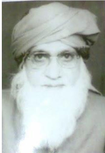
Maulana Muhammad Ilyas