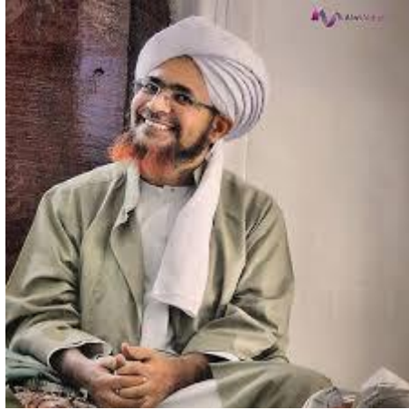
Habib Umar bin Hafiz

Tarekat Alawiyyah atau Tarekat As-Sadah Al-Ba'Alawi (Arab: طريقة السادة آل باعلوي Thariqah As-Sadah Al-Ba'Alawi) ialah satu tarekat sufi Islam Sunni yang terkenal, yang didirikan oleh Imam Muhammad bin Ali Ba'alawi, bergelar Al-Faqih Al-Muqaddam (lahir di Tarim, Yaman, 574 H/k. 1178 M, dan wafat 653 H/k. 1256 M). Tarekat ini kemudiannya semakin berkembang dengan pesat di tangan Imam Abdullah bin Alawi Al-Haddad.