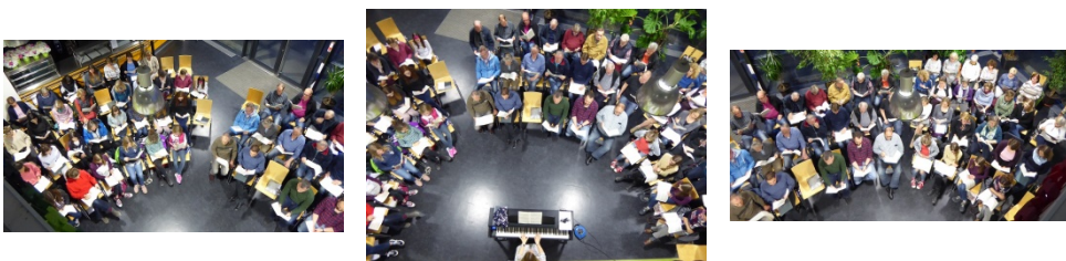
Der TMG-Chor bei der Probenarbeit für die Mozart-Messe am 26.03.2019