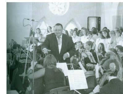
Der TMG-Chor bei einem Auftritt in einer St. Petersburger Kirche im Jahre 2009