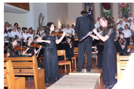
„Vasiliev Ostrov“ mit zwei Solistinnen beim Konzert mit dem TMG-Chor Stutensee am 12.07.2013 in der ev. Kirche in Weingarten (Baden)