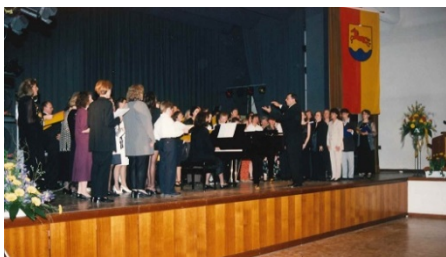
1. Auftritt des damals noch „Schüler, Lehrer, Eltern-Chors“ beim Festakt „25 Jahre Thomas-Mann-Gymnasium Stutensee“ am 20.03.1999 in der Festhalle in Stutensee-Blankenloch