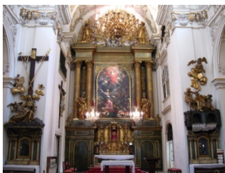
Innenraum der (Hochschul-)Kirche St. Ursula Wien, wahrscheinlich der Ort der Uraufführung der „Missa brevis in G-Dur“

Die „ Missa brevis in G-Dur “ wurde vermutlich am 3. Dezember 1768 im Wiener Ursulinen-Kloster , in dem heute u. a. die Universität für Musik und darstellende Kunst Wien untergebracht ist, uraufgeführt. Aus diesem Grund trägt sie auch den Beinamen „ Ursulinenmesse “.