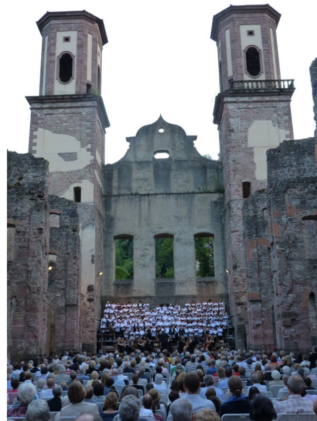
Aufführung der „Missa brevis in G-Dur“ am 14.07.2013 in der Klosterruine Frauenalb