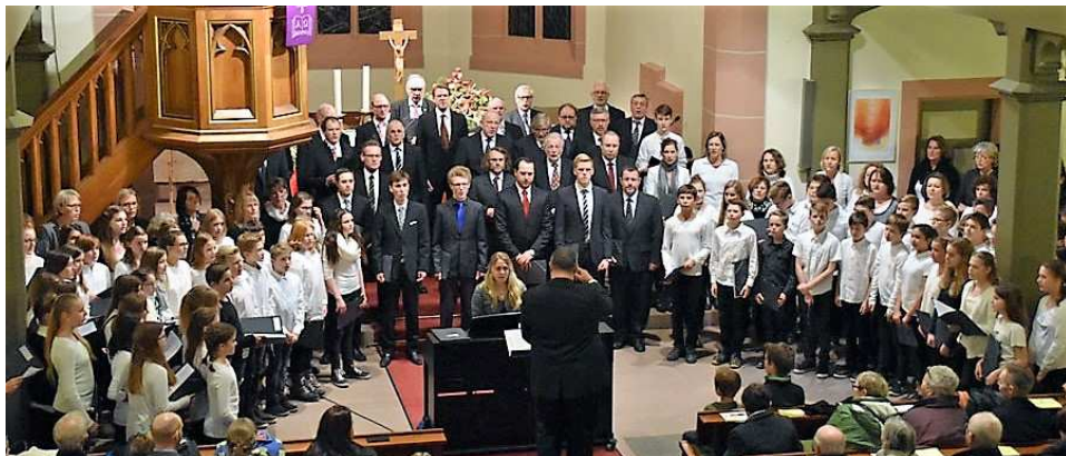
Der TMG-Chor beim traditionellen Auftritt am 3. Advent im Rahmen des Blankenlocher Weihnachtsmarktes in der ev. Michaeliskirche

Regelmäßig beteiligt sich der TMG-Chor überdies an den Weihnachtskonzerten des Thomas-Mann-Gymnasiums im Rahmen des Blankenlocher Weihnachtsmarktes.