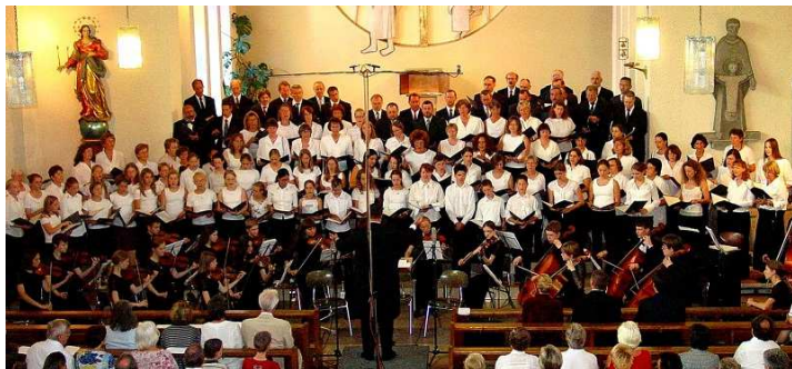
1. gemeinsame Auftritte des TMG-Chors mit dem St. Petersburger Jugendkammerorchester – Aufführung der „Schubertmesse in G-Dur“ am 10./11.07.2003 in der kath. Kirche St. Josef in Stutensee-Blankenloch

Wir wünschen Ihnen ein eindrückliches Musikerlebnis.