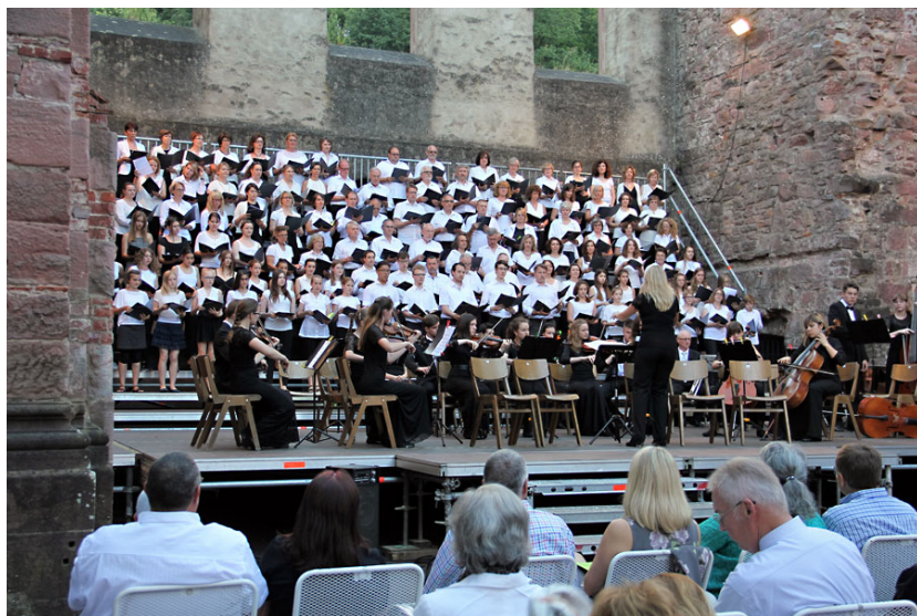
Konzert „Klassische Meisterwerke“ am 09.07.2016 in der Klosterruine Frauenalb; 10 J. Frauenalb