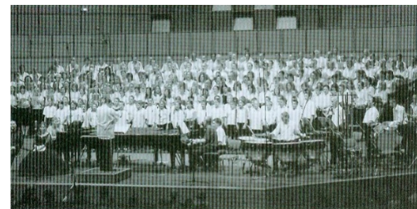
230 Stimmen erfüllten den Johannes-Brahms-Saal am 23.07.2004 mit Wohlklang und wurden mit stehenden Ovationen belohnt – eine Sternstunde des Chorgesangs!

Weitere Höhepunkte der Chorarbeit waren neben der Aufführung der „Carmina Burana“ von Carl Orff zusammen mit dem Liederkranz Friedrichstal vor 1.700 Zuhörern im Johannes-Brahms-Saal in der Stadthalle Karlsruhe (2004), an die sich noch heute alle Beteiligten mit leuchtenden Augen erinnern, die gemeinsamen Konzerte mit dem Jugendkammerorchester „Vasiliev Ostrov“ aus St. Petersburg : Die „G-Dur-Messe“ (D 167) von F. Schubert (2003); das „Requiem“ (KV 626; 2006), die „Krönungsmesse“ zusammen mit dem Kantatenchor des Walahfrid-Strabo-Gymnasiums Rheinstetten (KV 317; 2010), die „Missa brevis in G-Dur“ (KV 49; 2013) sowie die „Orgelsolomesse“ (KV 259; 2016) von W. A. Mozart und das „Gloria“ (RV 589) von A. Vivaldi (2008) sind Meisterwerke der klassischen Musik, die den hohen kulturellen Stellenwert des TMG-Chors in Stutensee und der Region dokumentieren.