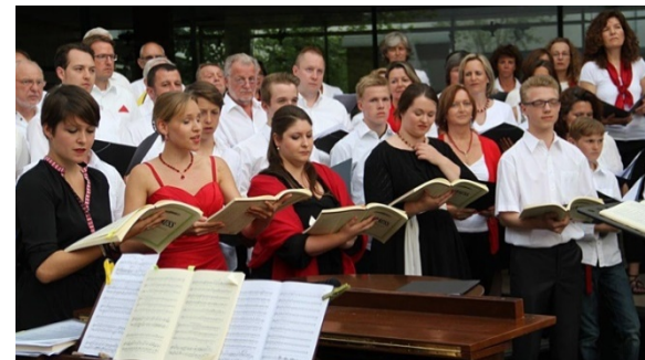
Sommerkonzert „40“ am 27.06.2014 „Im Feuerstrom der Reben“ aus „Die Fledermaus“ von J. Strauss