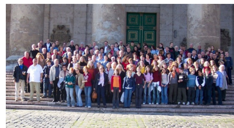
Der TMG-Chor in Ungarn im Jahre 2004

Konzertreisen führten den Chor nach Budapest, Esztergom, Tolna und Százhalombatta ( Ungarn ; dort wurden zusammen mit dem Liederkranz Friedrichstal u. a. nochmals die „Carmina Burana“ zu Gehör gebracht, wobei die Aufführung noch tagelang Stadtgespräch war – natürlich im positiven Sinne; 2004) sowie ins russische St. Petersburg (2009).