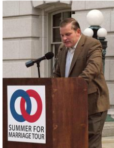
Brian Brown (Estados Unidos), presidente de National Organization for Marriage