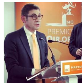
Luca Volonté (Italia), ex europarlamentario, presidente de la Fundación Novae Terrae y defensor de la iniciativa europea "One of Us"