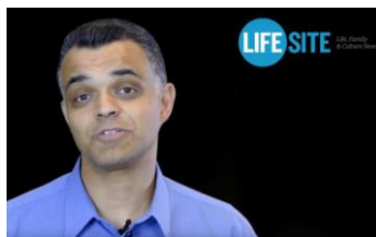
John-Henry Westen (Estados Unidos), fundador de LifeSiteNews.com