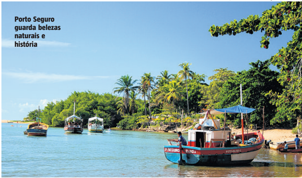
Porto Seguro guarda belezas naturais e história

João Cordeiro / Prefeitura Porto Seguro / 29.6.2007