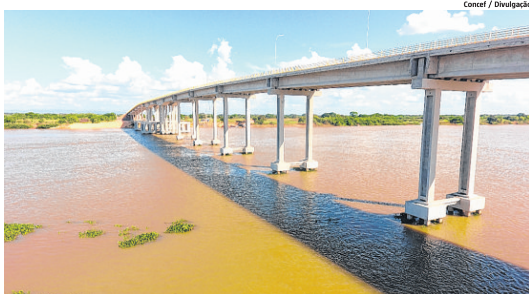
Concef / Divulgação