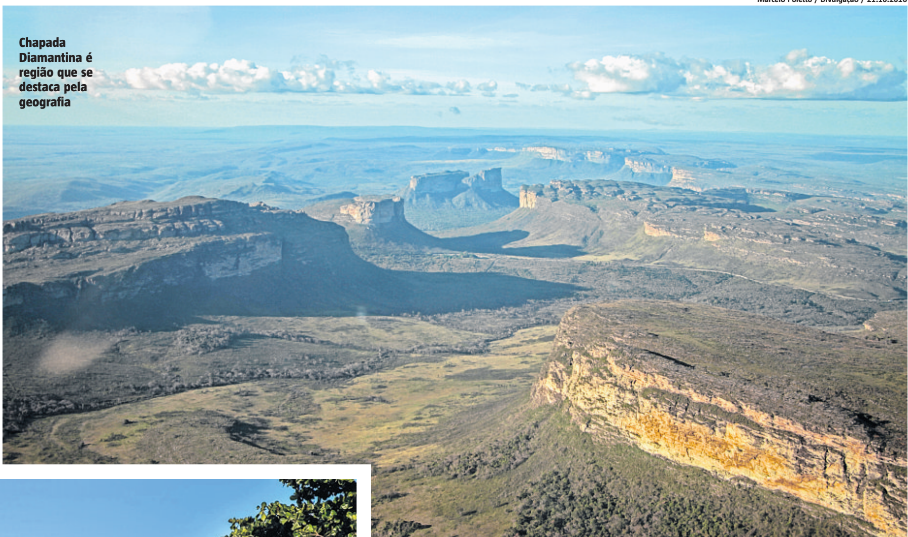
Chapada Diamantina é região que se destaca pela geografia