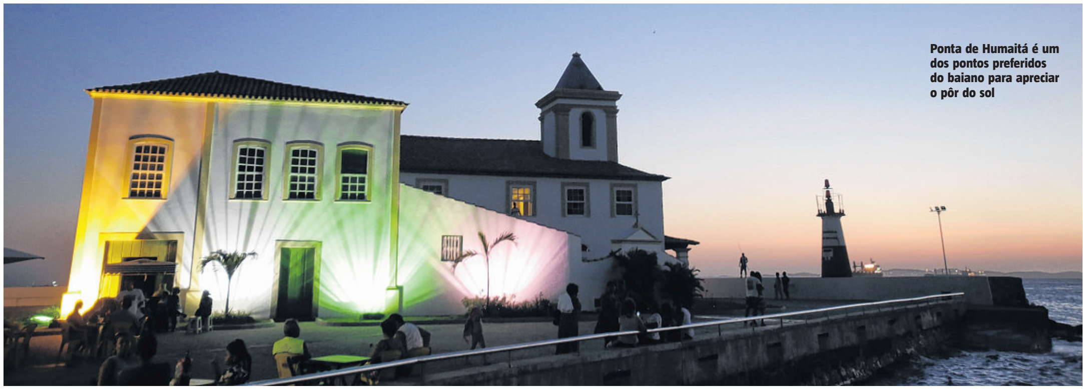
Ponta de Humaitá é um dos pontos preferidos do baiano para apreciar o pôr do sol

19.9.2019