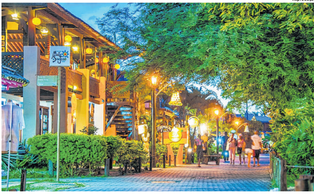
A vila é um dos atrativos de Praia do Forte, um dos principais destinos do Litoral Norte baiano

João Cordeiro / Prefeitura Porto Seguro / 29.6.2007