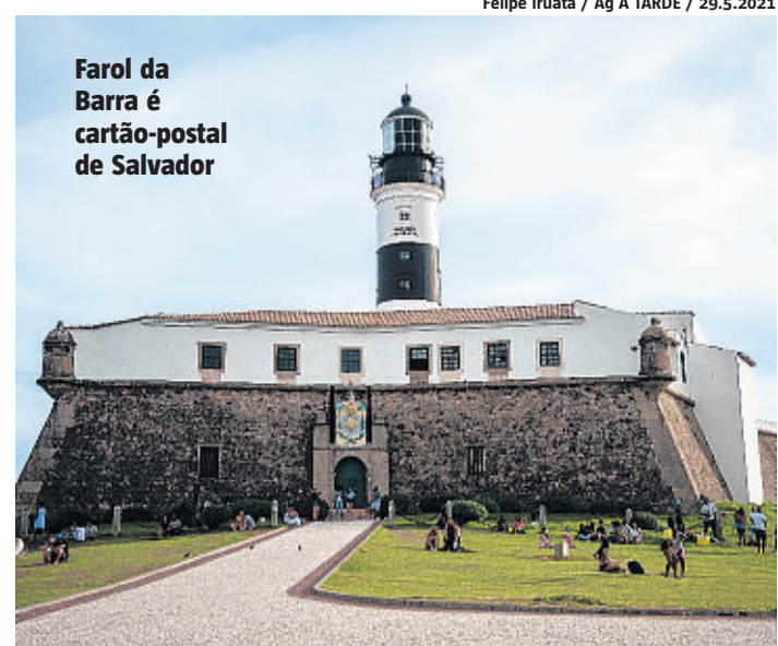
Farol da Barra é cartão-postal de Salvador