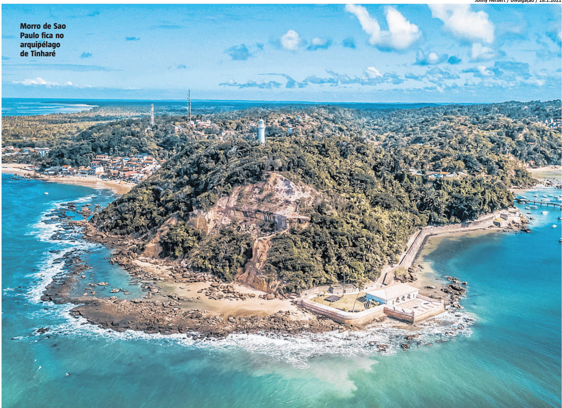
Morro de São Paulo fica no arquipélago de Tinharé

O modelo já tem boa aceitação na região da Costa do Cacaú, com visitas a fazendas e demais elos até a produção do chocolate. Também em Porto Seguro, na Chapada Diamantina e na região do polo de