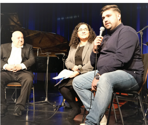
türkülerimizin gerçekleşmesinde emeği geçenlere teşekkür ederim. Biz vatandaşlarımızın her zaman yanındayız. "