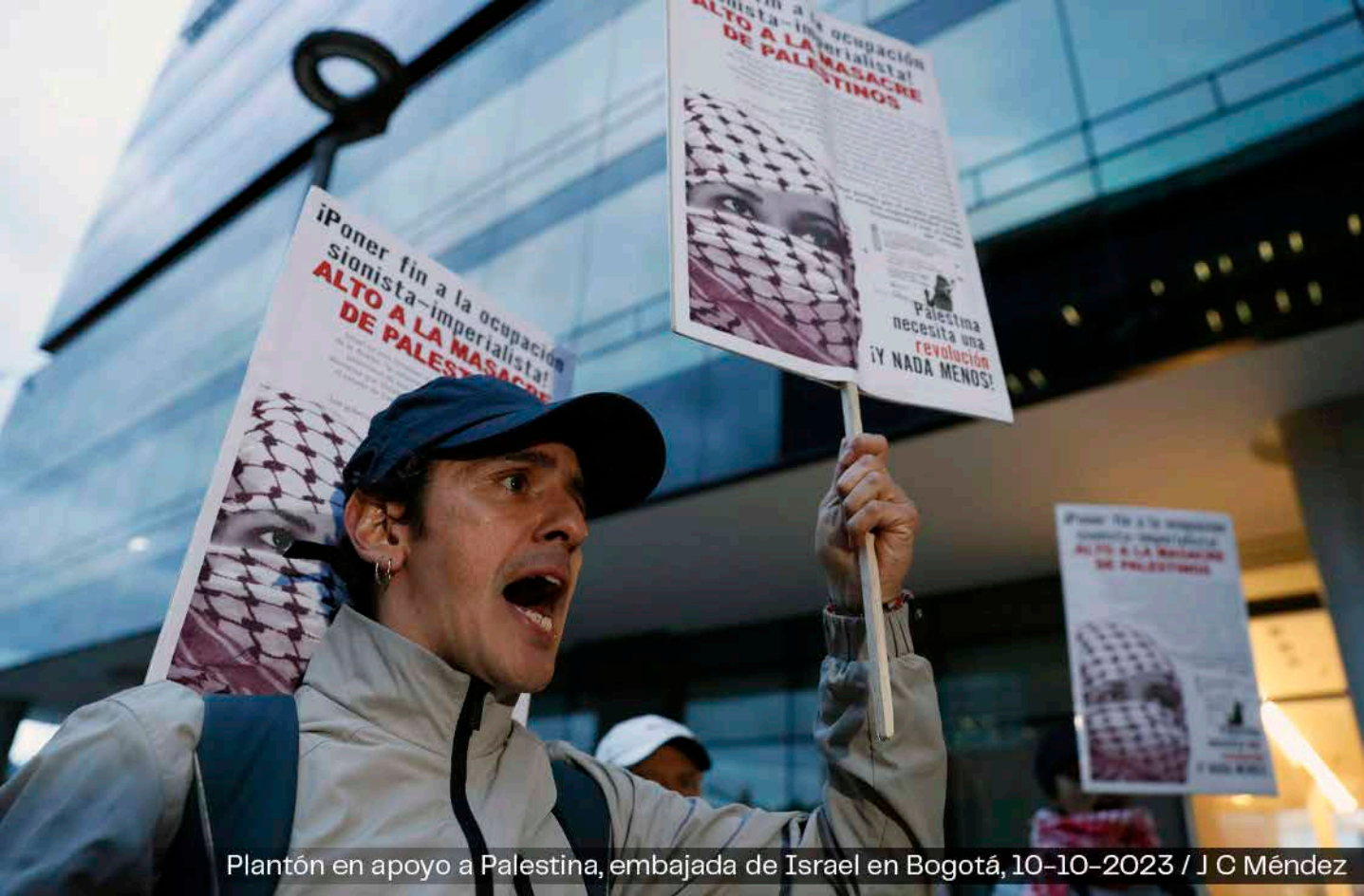
Plantón en apoyo a Palestina, embajada de Israel en Bogotá, 10-10-2023