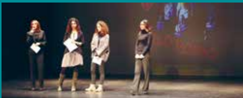
Un momento della serata 'Filo Rosso'

La serata è stata organizzata dall'Assessorato alle Pari Opportunità del Comune di Broni, in collaborazione con il Centro Liberamente di Pavia e la partecipazione di OltreDanza.