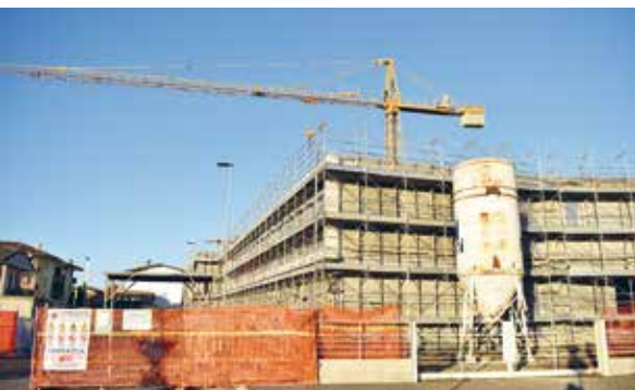
Il cantiere del secondo lotto della nuova scuola Baffi