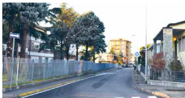
Una delle vie oggetto dell'intervento di asfaltatura