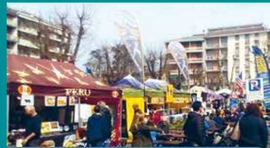
Street Food a Broni

Una serie di nuove iniziative, oltre a quelle storiche come la Festa dell'Uva e consuete come il "Broni by Night", sono state realizzate nel corso del 2017 per sostenere gli esercizi commerciali e i locali pubblici, continuando il lavoro di rilancio della vocazione turistica della nostra Città. Tra queste, il fine settimana dedicato allo 'street food', cibo da strada, che la scorsa primavera hanno animato le vie del centro, e le bancarelle di Forte dei Marmi, che sabato 14 ottobre hanno portato a Broni le bellezze della Versilia richiamando una grande folla di persone.