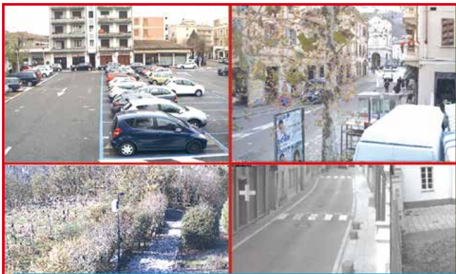
Una delle schermate dei monitor di controllo della polizia locale

Gli addetti incaricati svolgono un'attività di vigilanza e controllo del territorio nelle ore serali e