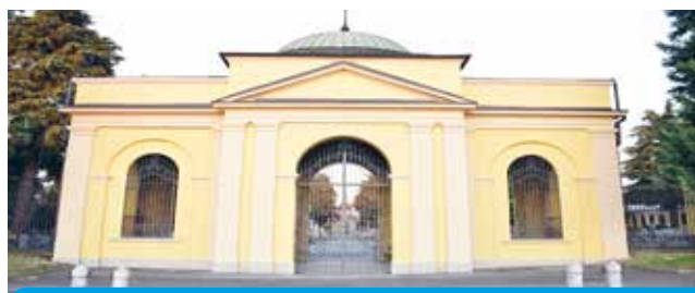
L'ingresso del cimitero ridipinto e sistemato

✓ Rimosso l'amianto dal tetto della caserma dei Carabinieri