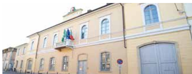
La scuola elementare, oggetto di interventi di manutenzione