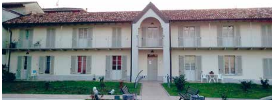
Il secondo lotto del nuovo housing sociale di Piazza Meriggi