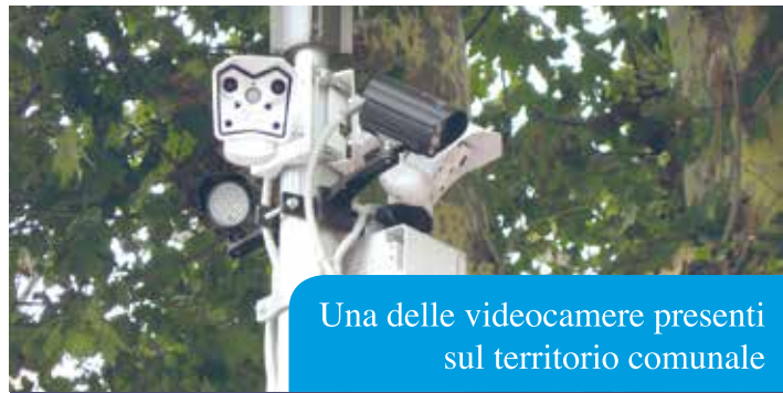
Una delle videocamere presenti sul territorio comunale