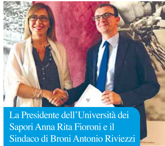
La Presidente dell'Università dei Sapori Anna Rita Fioroni e il Sindaco di Broni Antonio Riviezzi

Con l'arrivo a Broni della Scuola di Cucina, prende sempre più forma quella che diventerà una vero e propria 'centro per la valorizzazione dell'agroalimentare d'eccellenza' di Cassino Po, polo di eccellenza per visitatori e turisti, biglietto da visita del nostro territorio in Lombardia, in Italia e nel mondo.