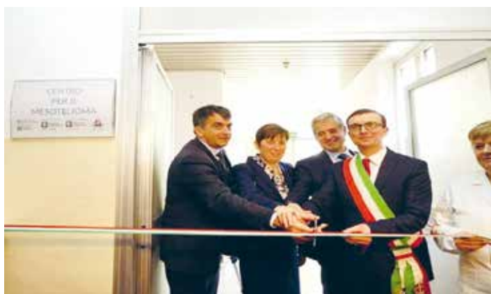
Inaugurazione dello sportello Mesotelioma