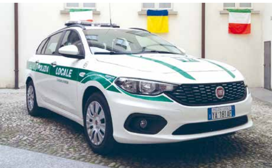
Il nuovo mezzo in dotazione alla polizia locale

A fine settembre è entrato in funzione un nuovo veicolo in dotazione alla Polizia locale, in dotazione alla Polizia Locale, che garantirà maggiore rapidità di intervento sul territorio. Prima dell'estate ha preso servizio un nuovo agente, senza dimenticare del completo rifacimento dell'impianto di illuminazione pubblica, in grado di garantire una potenza visiva di 3 - 4 volte superiore a quella precedente.