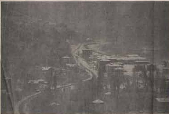
İLK KAR YAĞDI. Abana Merkezde ilk kar 10 Şubat'ta yağdı ve bir hafta kadar yerde kaldı. 11 Şubat'ta Devlet Hastanesinden çekilen bu fotoğrafta Abana'nın batı yakası görülüyor.