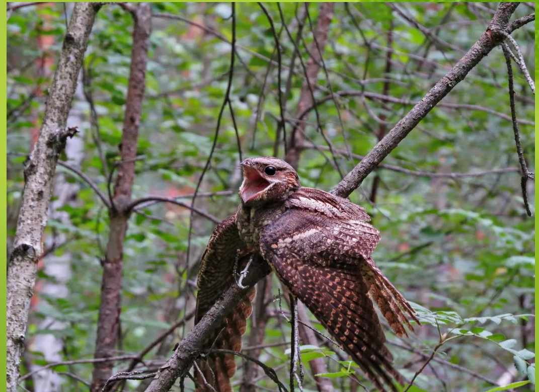
Козодой - сетконос