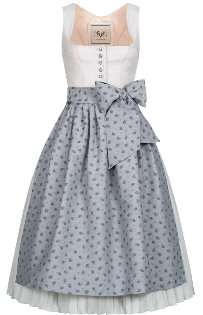
HEDI PLISSEE GREY