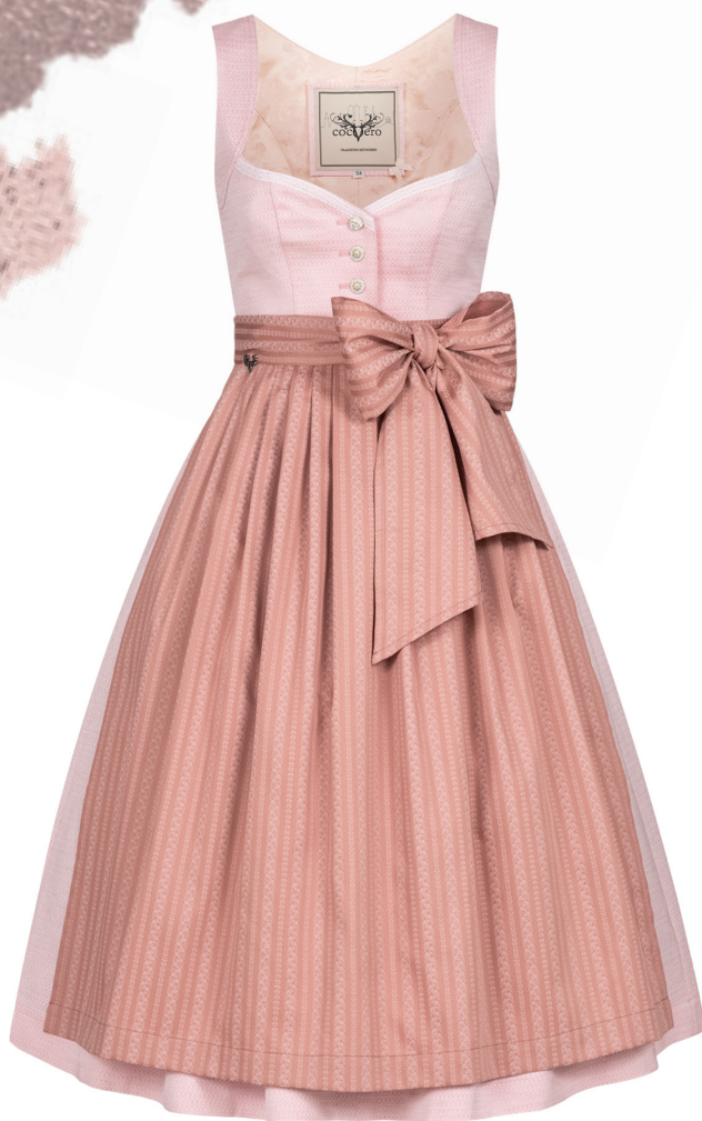
JOSEPHINE PRETTY ROSE