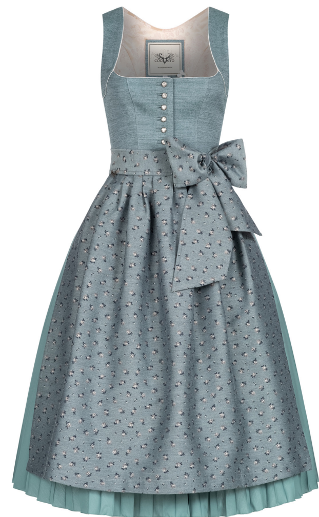
HEDI PLISSEE SPEARMINT