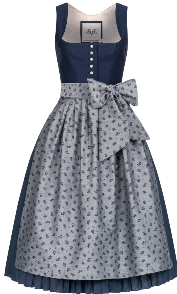
HEDI PLISSEE MOONLIGHT