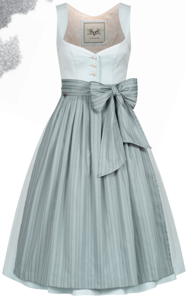
JOSEPHINE SERENITY BLUE