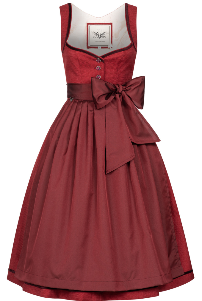
JOSEPHINE SPICY ROUGE