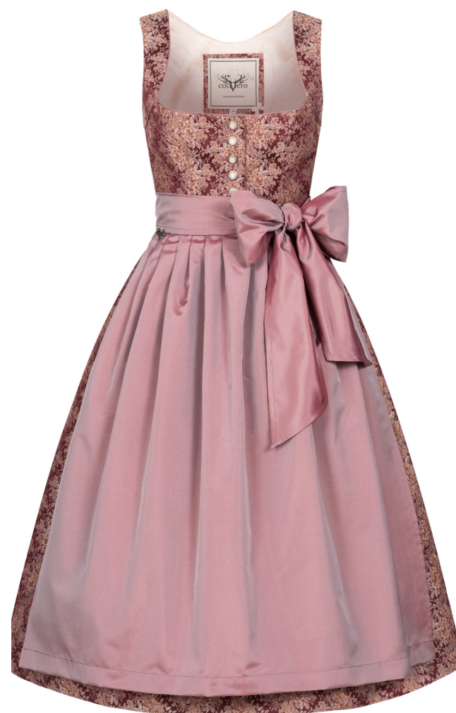
HEDI VINTAGE ROUGE