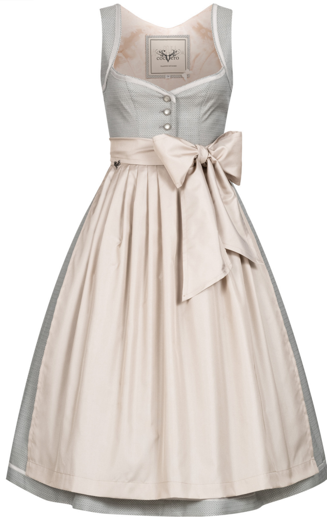
JOSEPHINE POWDER GREY