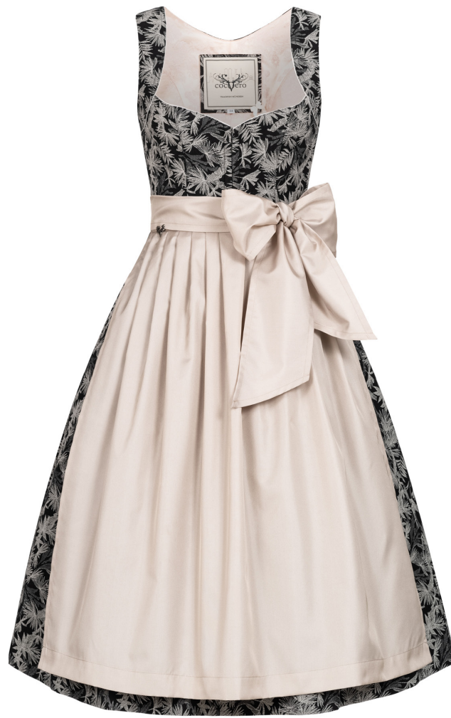
ANNELIE PALM SILVER