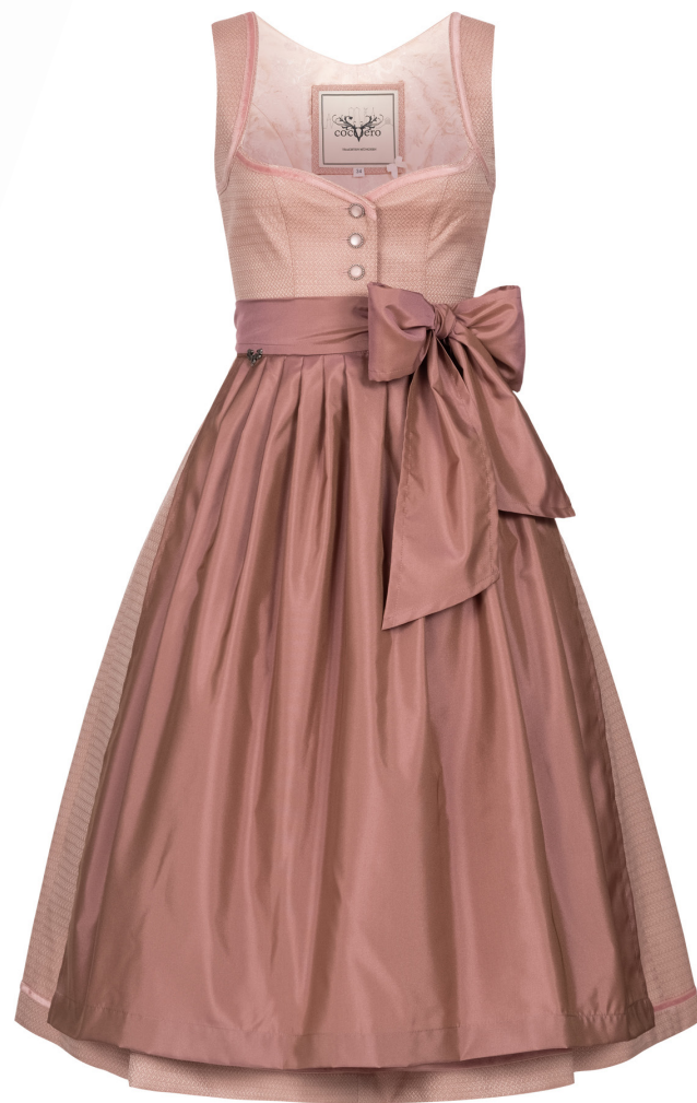
JOSEPHINE BLUSHY ROSE