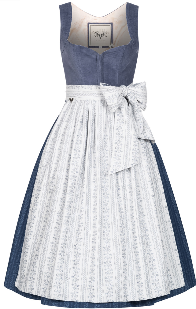
ANNELIE FLAWLESS SKY