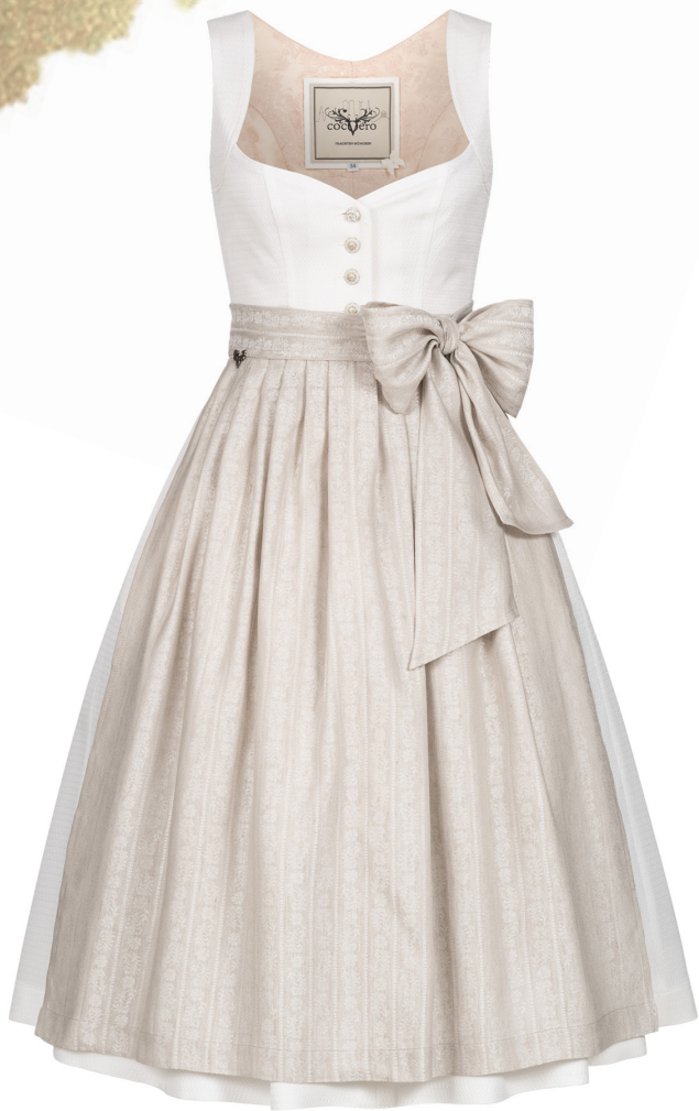
JOSEPHINE BRIDAL WHITE