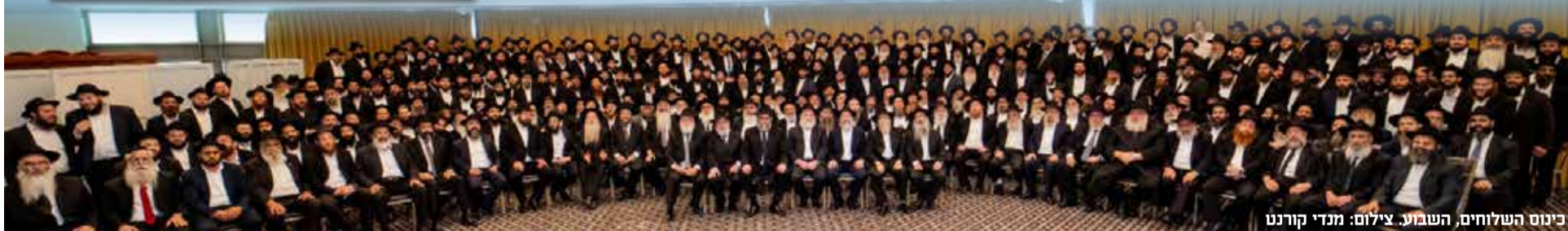
כינוס השלוחים, השבוע.