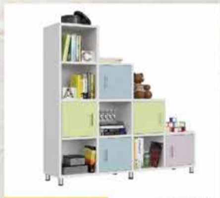
1560 ₪ כוורת אורסט