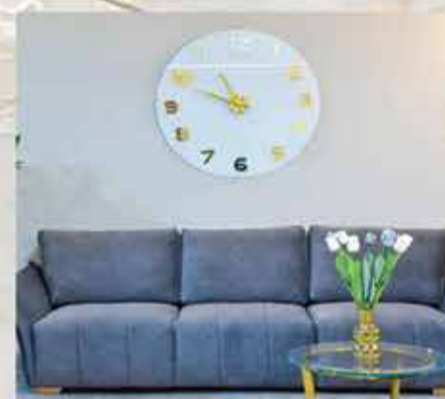
2040 ₪ ספה תלת 2.1 מ' דגם למבורגיני