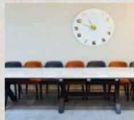
4500 ₪ שולחן רגל גודל 1.8 נפתח 3.6