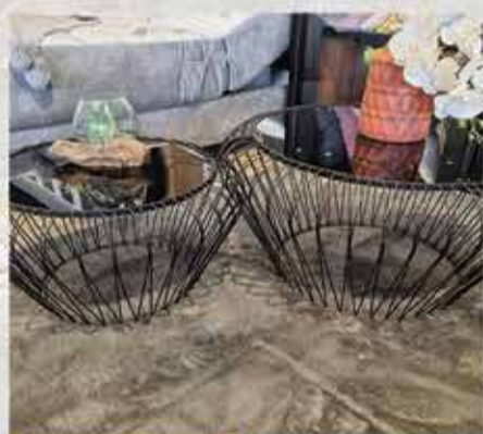
1325 ₪ זוג שולחנות סלון מעוצבים