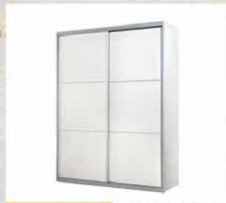
1450 ₪ ארון הזזה דגם בלה 1.60 מ'