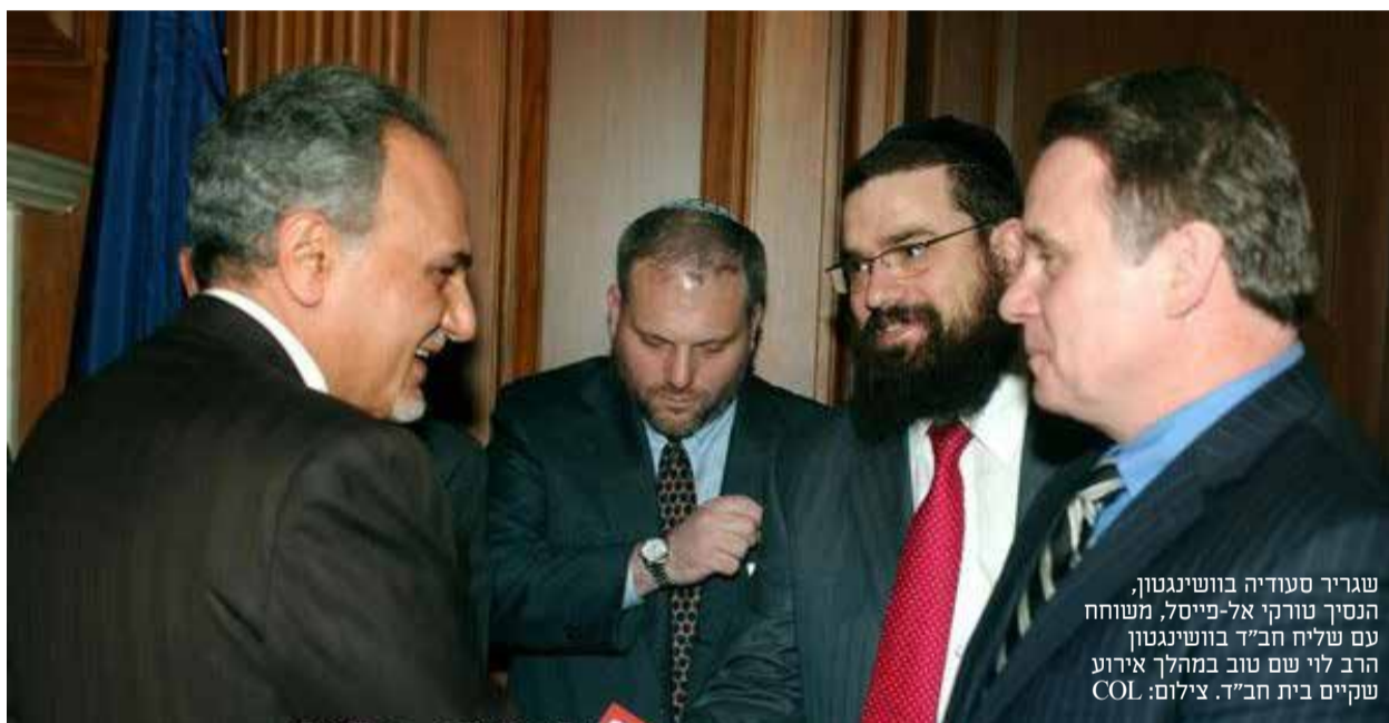
שגריר סעודיה בווינגטון, הנסיך טורקי אל-פייסל, משוחח עם שליח חב"ד בווינגטון הרב לוי שם טוב במהלך אירוע שקיים בית חב"ד.