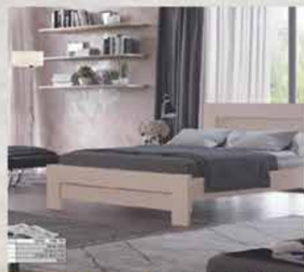
2750 ₪ מיטה יהודית ארגזים+שידה דגם בוניטה