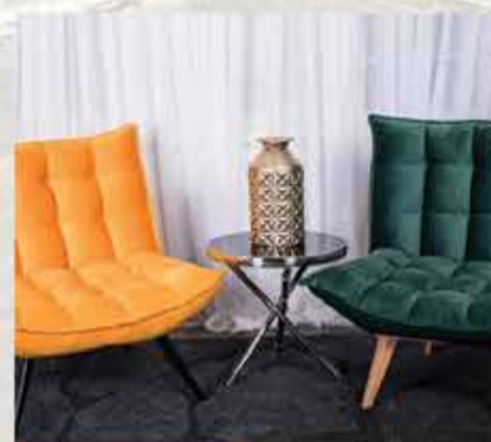
799 ₪ כורסאת אמדאוס