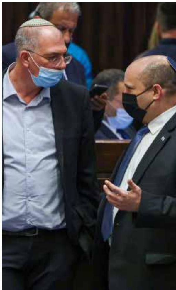
כ"כ אורבך בשיחה עם בנט.

ובנט רואה את זה, בנט יודע את זה, בנט מכיר את הנתונים הללו. אחרי כל זה, איך יש לך חשק לשיר?