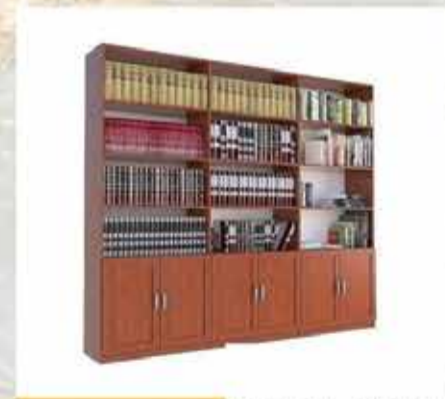
2190 ₪ ספריית קודש יהונתן 2.40 מ'

ועוד מגוון ענק של מבצעים באתר : http://www.ysrihut.co.il