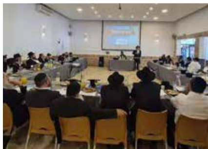
כינוס המנהלים, השבוע

שיתוף פעולה ייחודי בין הצוות החינוכי בתלמודי התורה לראשי ישיבות 'תומכי תמימים', יביא לצמצום תופעת תלמידי כיתות ח' ש'נופלים בין הכיסאות'