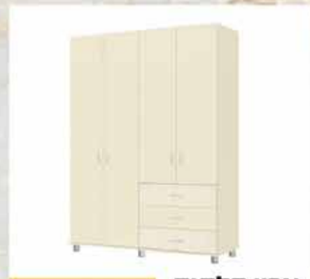
1490 ₪ ארון דלתות דגם דור 1.6 מ' 3 מגירות