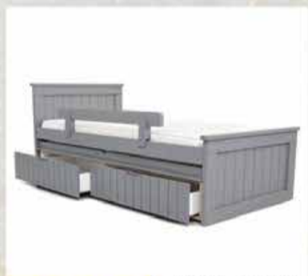
2400 ₪ מיטת חבר כולל מגירות ומזרנים