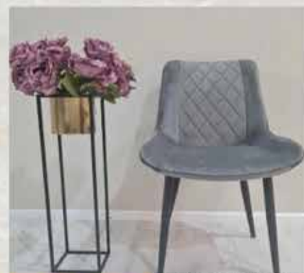
350 ₪ כיסא מרוכד דגם 700