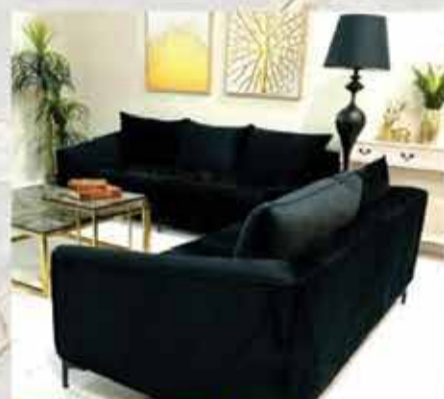
3950 ₪ סט ספות 2+3 דגם קרואטיה