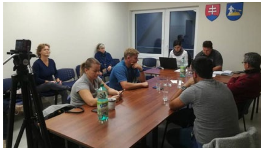
V deň návštevy Bešeňovej sme stihli aj zasadanie zastupiteľstva, kde sme zažili takmer všetko presne tak, ako sme sa na stretnutí pred zasadaním zastupiteľstva dozvedeli. Slovo sme si vynútili až po skončení zasadania obecného zastupiteľstva.