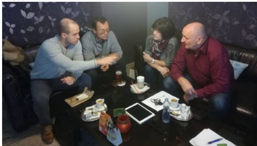
V Zlatých Moravciach sme si ujasňovali stanoviská a zhodli sa na častejších konzultáciách.

aj občanom okolitých obcí, ktoré na chod nemocnice neprispievali vôbec.