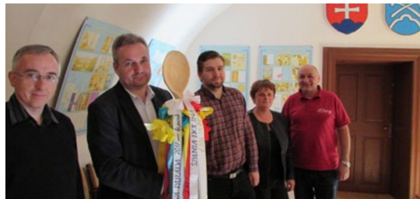
A ako by to bolo, aby nebolo aj foto s pani starostkou v budove Obecného úradu v Španej Doline.