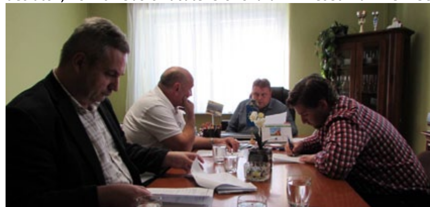
Pozorne sme počúvali starostu a žasli nad tým, čoho je schopný jeden notorický sťažovateľ.

množstvom infožiadostí a trestných oznámení. Tých bolo niekoľko desiatok, no nič nebolo začaté. S ohováraním nešetril ani ZOMOS.