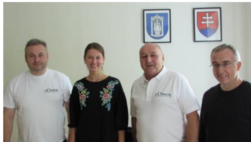
Radi sme sa spoločne vyfotili.

Najmladšia starostka na Slovensku tak dáva signál, že ani mladý