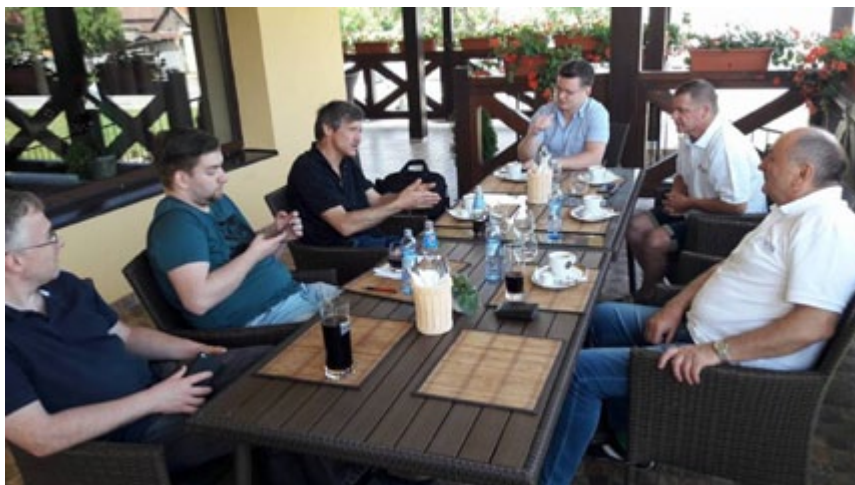
Pri starostovi akého majú v Čiernom Polí je pochopiteľné, že sme sa pri analýze protiopatrení zdržali dlhšie.

Na jeho otázku: „Kto ste?“, sa spravidla dozvedel, že sme občania, na čo reagoval ozaj rozkošne a „fundovane“, asi takto: „Ale nie ste občania našej obce a toto je len pre našich ☺ a poslanci tu majú také svoje stretnutie.“ Ozaj kvalifikovaná odpoveď starostu s právnym vzdelaním a titulom JUDr. Aj ďalšie jeho chaotické vedenie zasadania zastupiteľstva sa nieslo v tomto štýle.