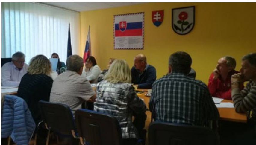
Na zasadanie obecného zastupiteľstva sme prišli deklarovat podporu obyvateľovi obce.