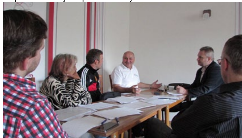
Množstvo papierov na stole vypovedá o množstve problémov.