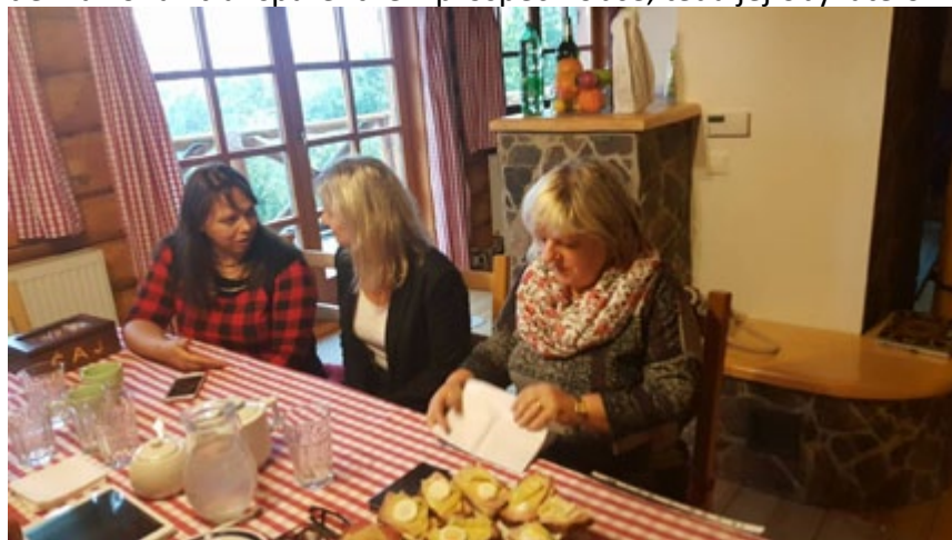
„Zlé ženy“ Hodruše – Hámrov.

Trojicu aktivistiek, resp. obecných poslankyň, ktoré mu dozerajú na prsty jednoducho nemajú radi, lebo narúšajú zaužívané stereotypy a pokoj v obci. Mohla by to byť ale pravda len v prípade, keby starosta a jeho verní poslanci rešpektovali Zákon o obecnom zriadení a konali transparentne v prospech obce, teda jej obyvateľov.