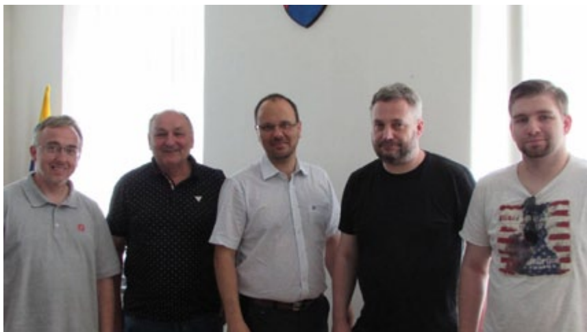
Dali sme aj fototermín s primátorom ☺.