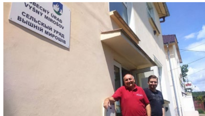
Pred obecným úradom vo Vyšnom Mirošove, kde sme márne hľadali starostu obce.

Inštitút referenda o odvolaní starostu je síce dokonalý nástroj na jeho odvolanie, je však veľmi dôležité, aká je nálada voličov a či bude dosiahnutá ich potrebná nad 50% účasť. V tomto prípade teda trezlivito čakáme, kedy prejde trezlivosť sudcovi.