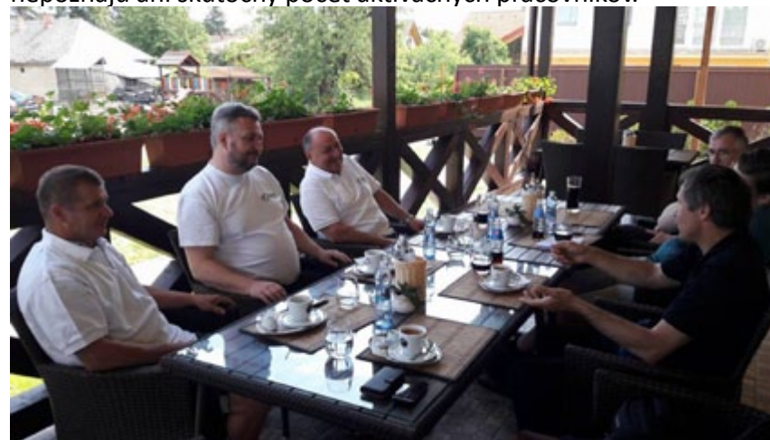
Smejeme sa, lebo niektoré činy starostu sú až tragikomické.

Starosta neodpovedá, prípadne reaguje na žiadosti na základe infozákona nekompetentne, a to ako poslancom zastupiteľstva, občanom obce, členom ZOMOSu, tak aj právnym zástupcom poslancov. Taktiež nedostatočne informuje o činnosti samosprávy. Na webe obce sa nachádza ako posledná zápisnica z májového zasadnutia v roku 2016. Zamestnávaný je neznámy počet zamestnancov pre administratívne práce, účtovníctvo či opatrovateľskú službu. Poslanci nepoznajú ani skutočný počet aktívnych pracovníkov.