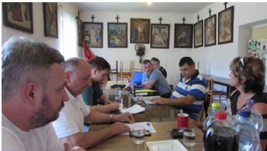
V Malčiciach sme si podelili témy, pretože ich starosta produkuje neúrekom