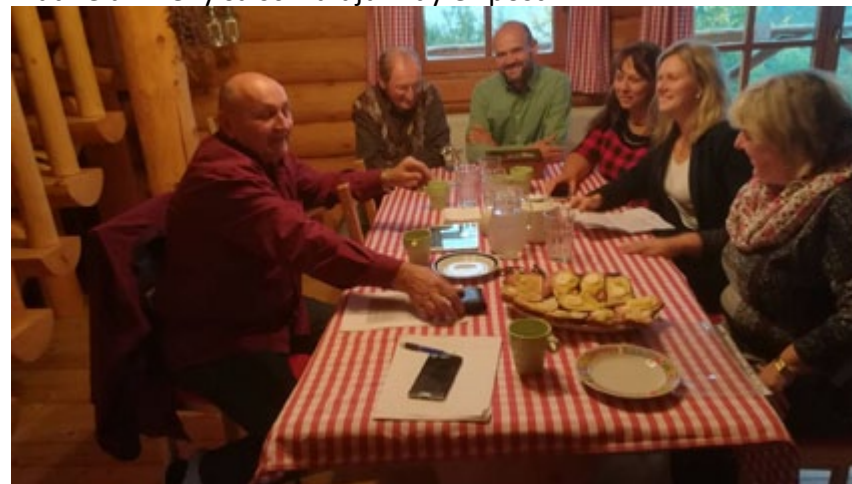
Dve poslankyne, dvaja aktívni občania a bývalý prednosta OcÚ sú nádejou pre obec.

V obci sa dlhodobo rieši aj problém s vodou, neskolaudovaným vodovodom, nedostatočnou informovanosťou obyvateľov a trvalo sa porušuje rozpočtová disciplína, keď čerpanie rozpočtu je neprehľadné a zmeny sa schvaľujú vždy ex post.