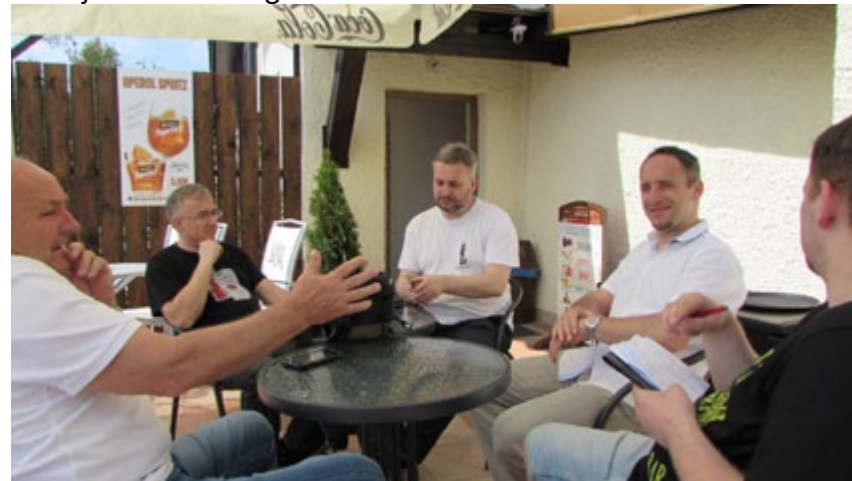
V Tatranskej Lomnici sme okrem medvedov riešili aj spôsob ako vylepšiť prípravu mestského rozpočtu.