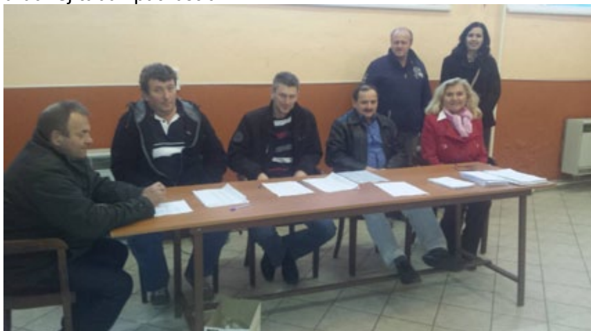
Členovia komisie pri referende o odvolaní starostky obce Čičava.

Občania zorganizovali petíciu za odvolanie starostky a zastupiteľstvo následne vyhlásilo referendum za jej odvolanie. To však bolo neúspešné pre nízku účasť a nerozhodnosť druhej skupiny rómskych voličov. Tá bola pod vplyvom starostky dostala pokyn nezúčastniť sa. Starostka ešte v príprave napadla neplatnosť vyhlásenia referenda a podala trestné oznámenie pre jeho nezákonnosť. Namietala, že VZN, ktorým poslanci schválili miestne referendum, neviselo na úradnej tabuli pätnásť dní.