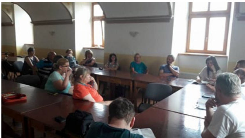
Svoje problémy so starostom nám prišlo vyrozprávať až 15 obyvateľov Cejkova.

Riaditeľ je voči starostovi až príliš servilný a umožňuje mu, aby školu riadil vlastne sám. Obzvlášť hrubý je najmä voči ženám učiteľkám. Tie sa sťažujú na bossing, teda na psychické šikanovanie. Mnohé si musia pred vyučovacím dňom zobrať tabletku, aby prežili deň. V tejto veci sa ich zastal aj ich mužský kolega.