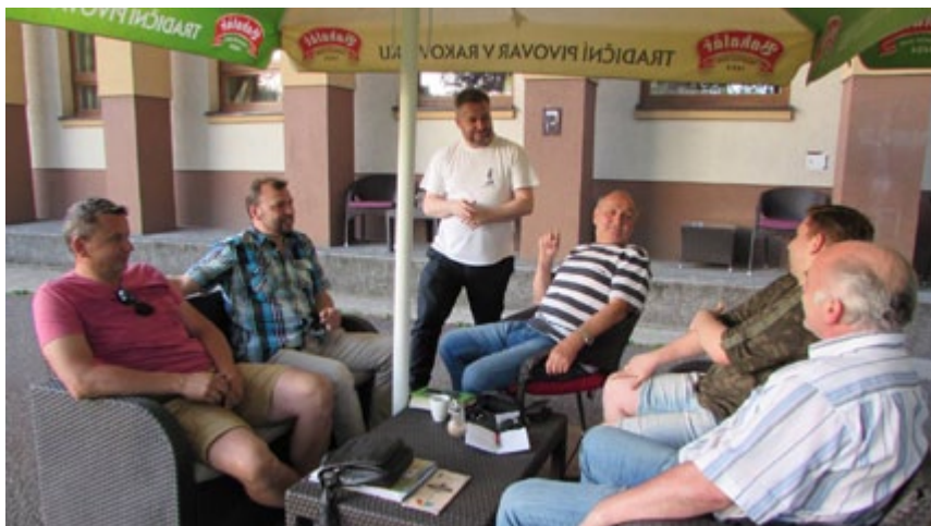
Vzťahy „poslanci - kontrolór“ v obci Pribylina prišiel komunikovať aj poslanec NR SR Ondrej Dostál.