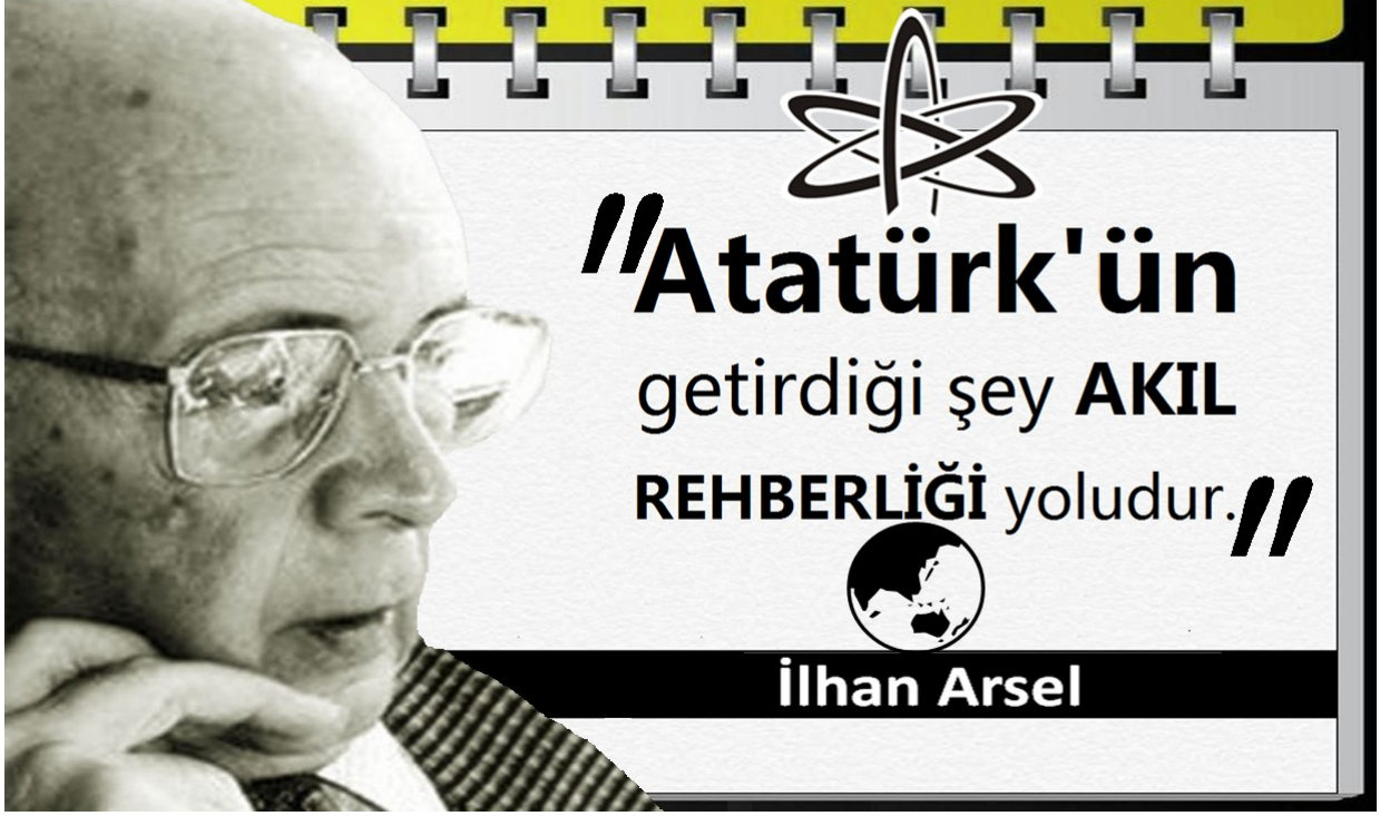
İlhan Arsel , Türk anayasa hukukçusu, Türk akademisyen, yazar, araştırmacı ve senatör. Wikipedi