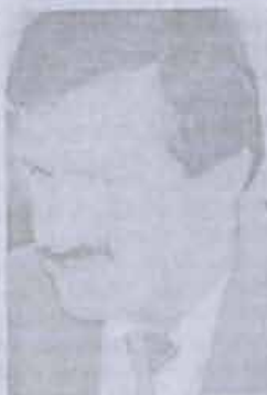
Belediye Başkanı Şekket YAZGAN

Şenlikler 2 Ağustos Cuma günü belediye başkanı, kaymakam ve Abana halkının çarşı başından yapacağı yürüyüşle başlayacak. Geceleri konser, tiyatro, gitar dinletisi, şenlik şerhi ve hava fişekleri gösterileri sürecek.