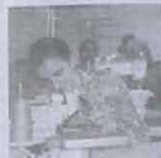
İÇİ KIZLARINIZDAN BİR DİKEŞ MARMARİSİNİN BAŞPİDA