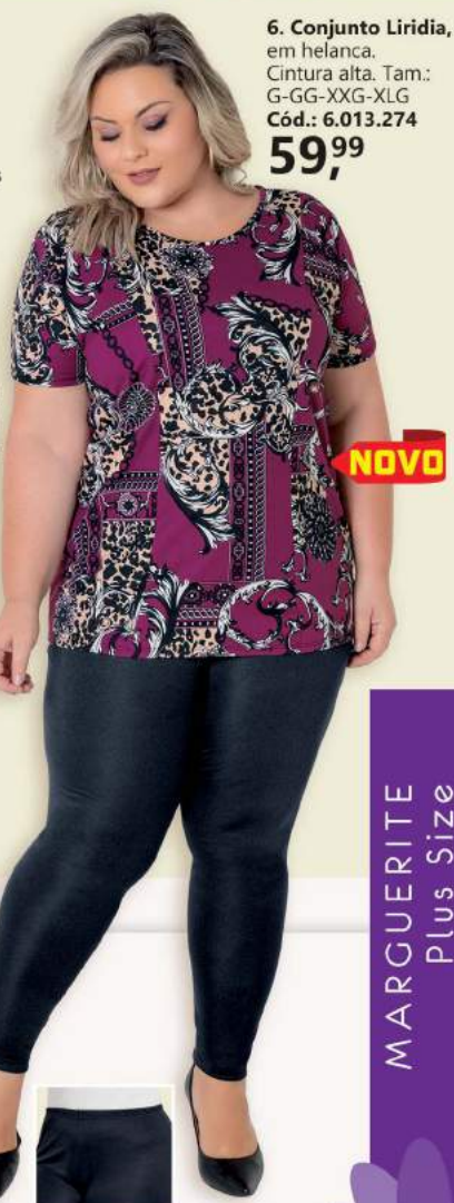
6. Conjunto Liridia, em helanca. Cintura alta. Tam.: G-GG-XXG-XLG Cód.: 6.013.274 59,99