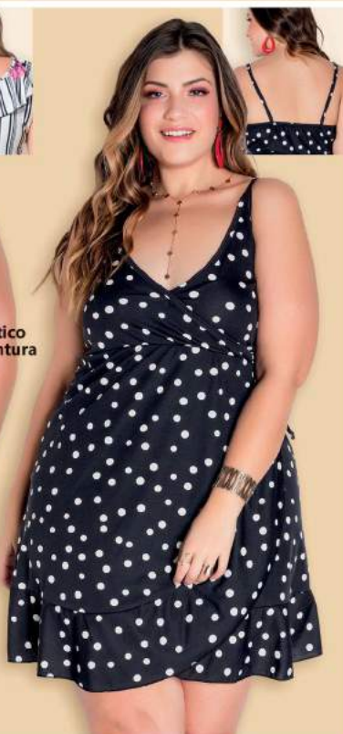
4. Vestido Loty , em helanca. Comp. clássico. Tam.: G-GG XXG-XLG. Cód.: 5.902.775