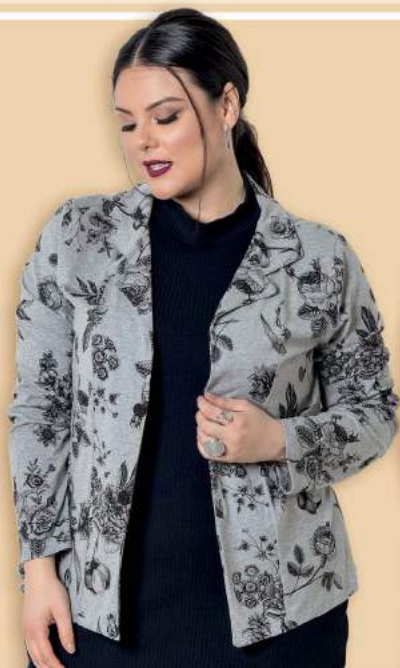
1. Blazer Telma Tam.: G-GG-XXG-XLG Cód.: 5.832.290 69,99