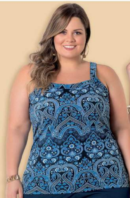
1. Blusa Ilinalva Tam.: G-GG-XXG-XLG Cód.: 5.750.941