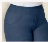
6. Legging Betania Cintura média. Tam.: G-GG-XXG-XLG Cód.: 5.567.560 54,99