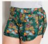
9. Short Savaira , em helanca. Cintura média. Tam.: G-GG-XXG-XLG 34,99 Cód.: 5.905.763