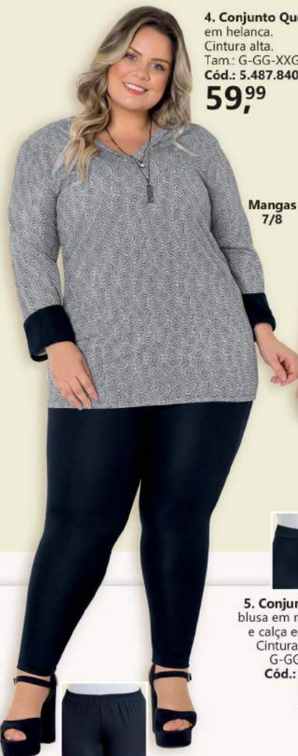
4. Conjunto Queila, em helanca. Cintura alta. Tam.: G-GG-XXG-XLG Cód.: 5.487.840 59,99