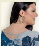
3. Blusa Joline, em malha de algodão com poliéster. Tam.: G-GG-XXG-XLG Cód.: 5.832.564 39,99