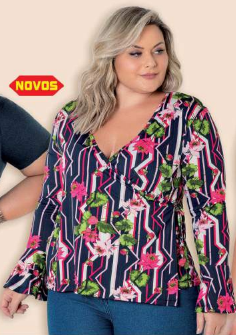
2. Blusa Jasmina Tam.: G-GG-XXG-XLG Cód.: 6.013.297 49,99