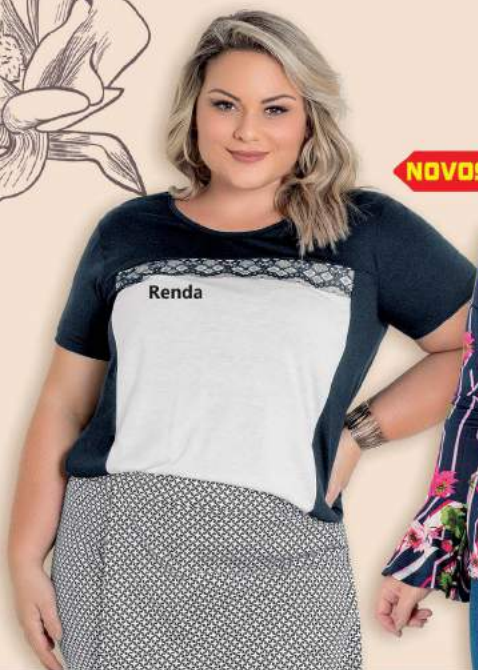
1. Blusa Ridina Tam.: G-GG-XXG-XLG Cód.: 6.013.333 39,99