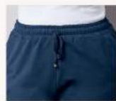
2. Calça Daniela, em moletinho. Cintura média. Tam.: G-GG-XXG-XLG Cód.: 5.683.290 69,99