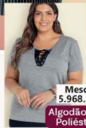
Mescla 5.968.380 Algodão com Poliéster