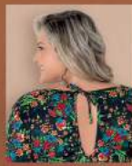
1. Macacão Laylanne, em helanca. Mangas 3/4. Tam.: G-GG-XXG-XLG Cód.: 6.013.415