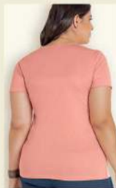
5. Blusa Belina, em helanca. Tam.: G-GG XXG-XLG Cód.: 5.966.946