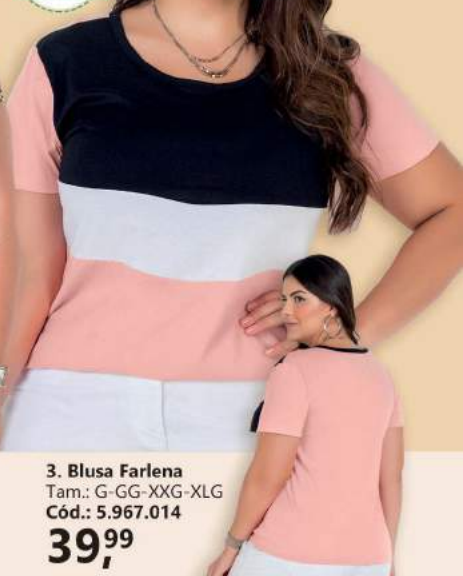
3. Blusa Farlena Tam.: G-GG-XXG-XLG Cód.: 5.967.014 39,99