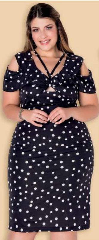
1. Vestido Lidyana , em helanca. Comp. midi. Tam.: G-GG XXG-XLG. Cód.: 5.899.524 59,99