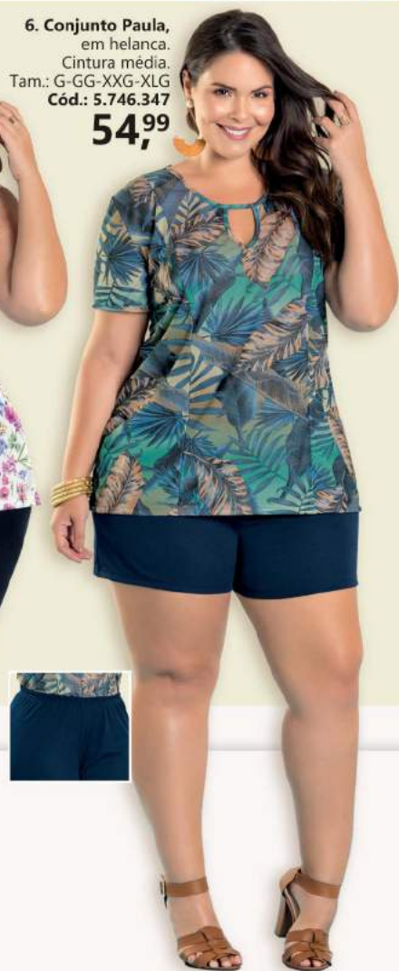
6. Conjunto Paula , em helanca. Cintura média. Tam.: G-GG-XXG-XLG Cód.: 5.746.347 54,99