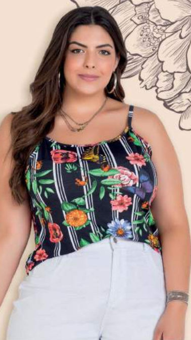
3. Blusa Dariene Tam.: G-GG-XXG-XLG Cód.: 5.967.412 29,99