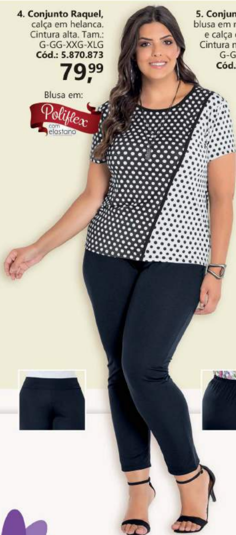
4. Conjunto Raquel , blusa em helanca, calça em helanca. Cintura alta. Tam.: G-GG-XXG-XLG Cód.: 5.870.873 79,99