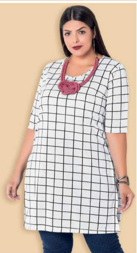
1. Blusa Korline Mangas 3/4. Tam.: G-GG-XXG-XLG Cód.: 5.872.781