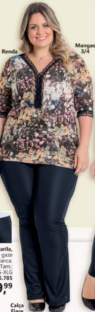
5. Conjunto Narila, blusa em malha gaze e calça em helanca. Cintura alta. Tam.: G-GG-XXG-XLG Cód.: 5.765.785 59,99