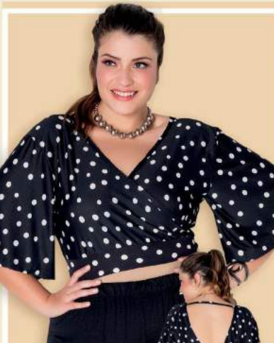
5. Cropped Analiz, em helanca. Mangas 3/4. Tam.: G-GG-XXG-XLG Cód.: 5.899.547

4. Blusa Nadjila, em helanca. Tam.: G-GG-XXG XLG. Cód.: 6.012.910 39,99