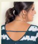
1. Blusa Gabiane Tam.: G-GG XXG-XLG Cód.: 5.870.393 39,99