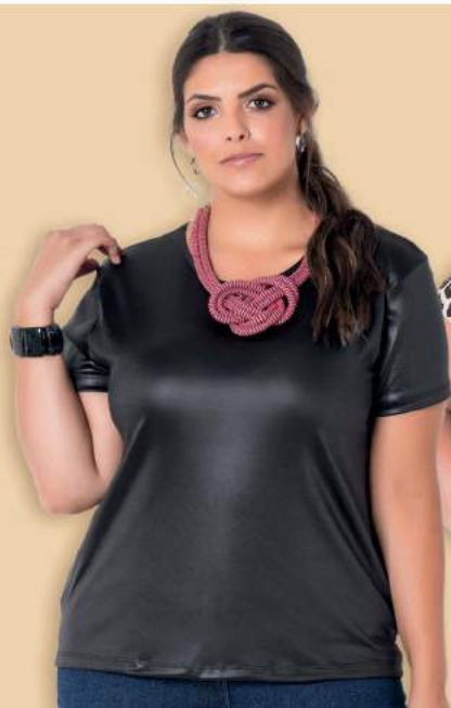
1. Blusa Cirlene , em cirrê. Tam.: G-GG-XXG-XLG Cód.: 5.872.471 49,99