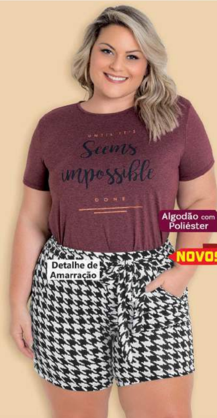
Algodão com Poliéster