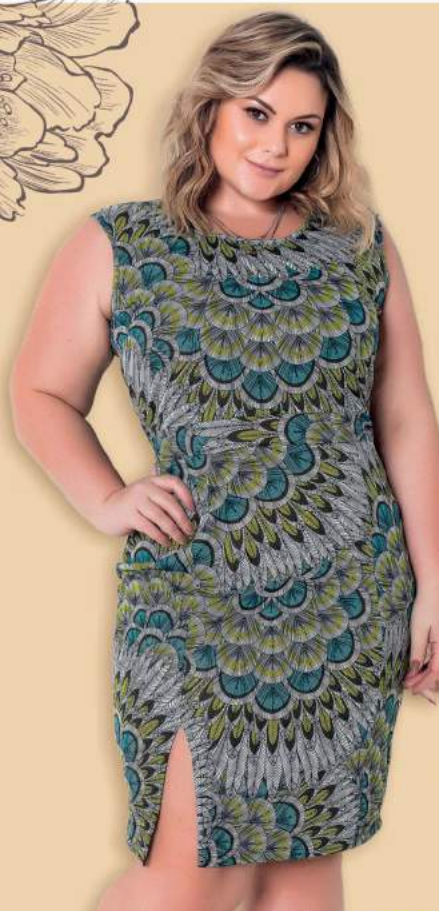
4. Vestido Aldyn, em helanca. Comp. no joelho. Tam.: G-GG-XXG-XLG Cód.: 5.906.790