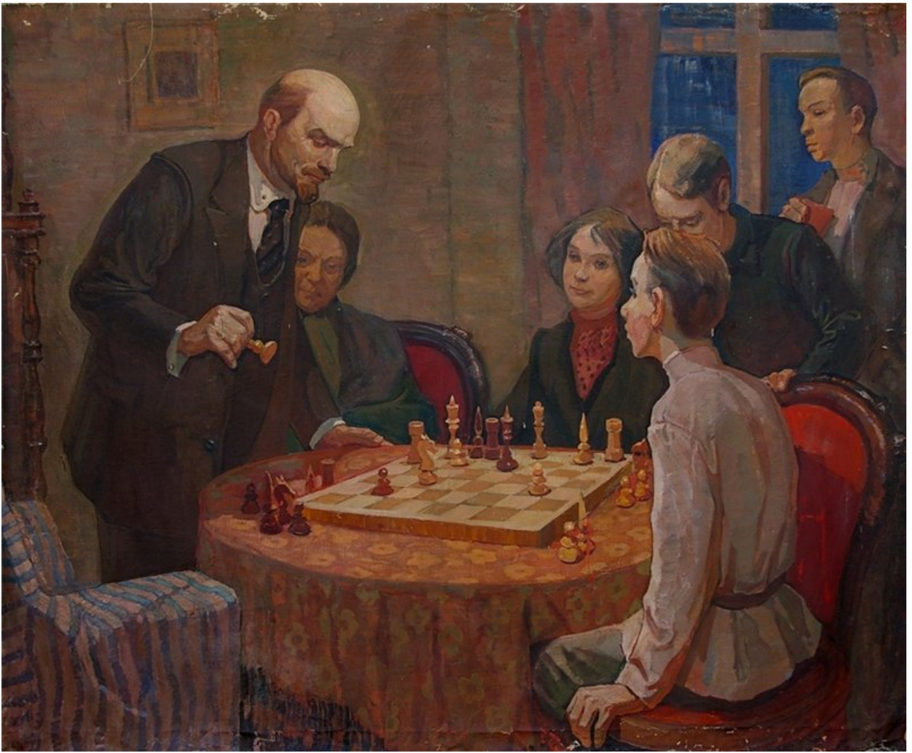
Художник Андреев (?). Ленин и шахматы