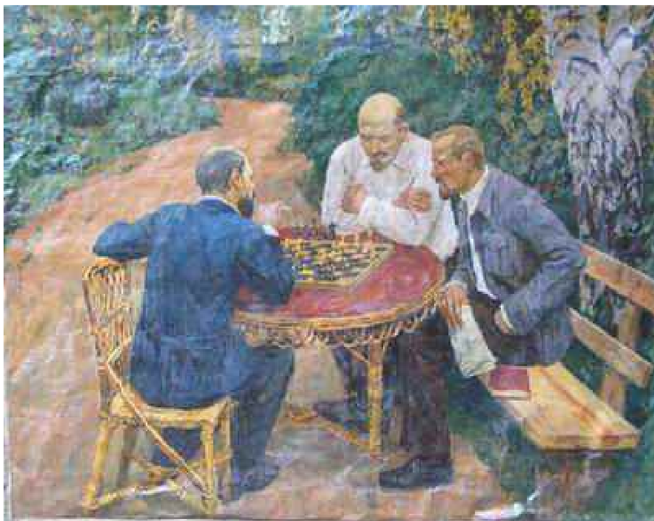
М. Федосов (1970). Ленин играет в шахматы