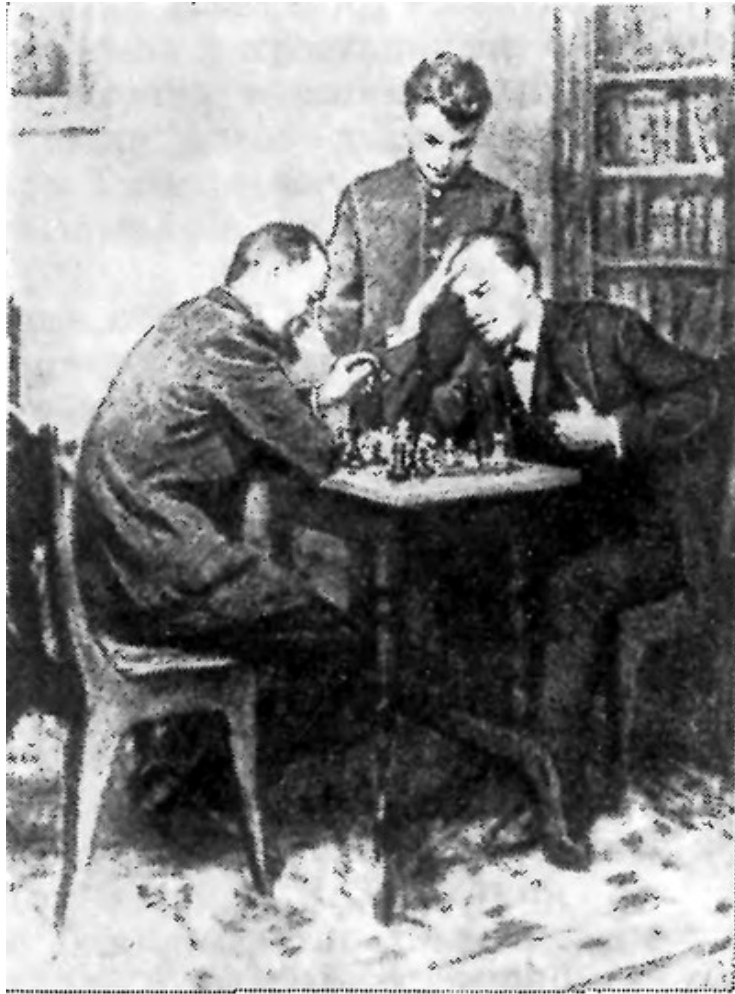
Рисунок из книги Исаака Линдера «Как сделать наилучший ход...» (М., 1988)