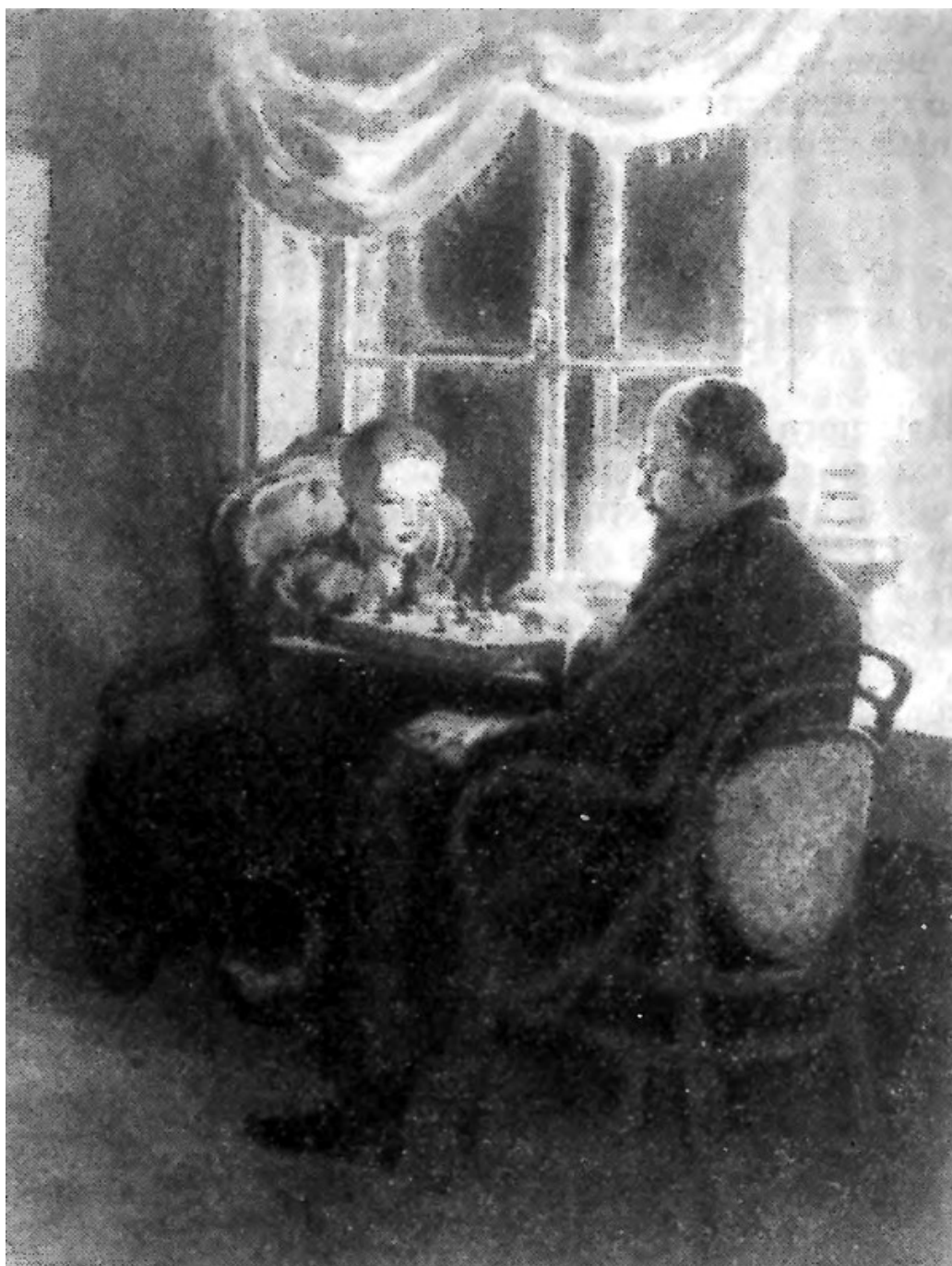
Д. Хайкин. Володя Ульянов играет в шахматы с отцом в его кабинете. Рисунок