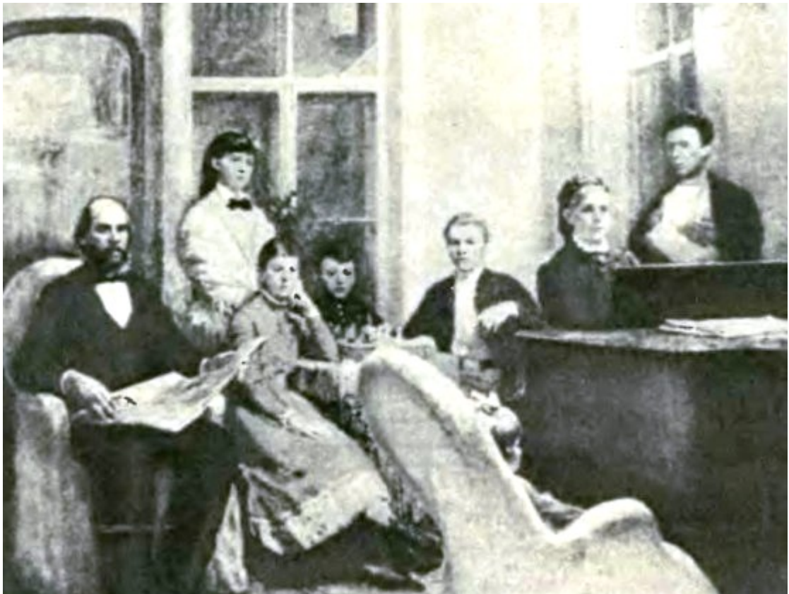
Лев Серафимович Котляров (1925-...). Семья Ульяновых. Картина