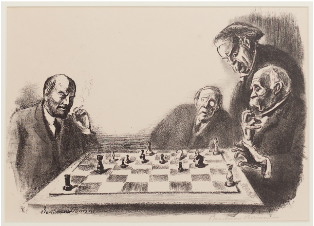
Боурдмен Робинсон. Игра в шахматы — Ленин, Вильсон, Ллойд Джордж и Кле- мансо. Линогравюра. Hampshire College Art Gallery