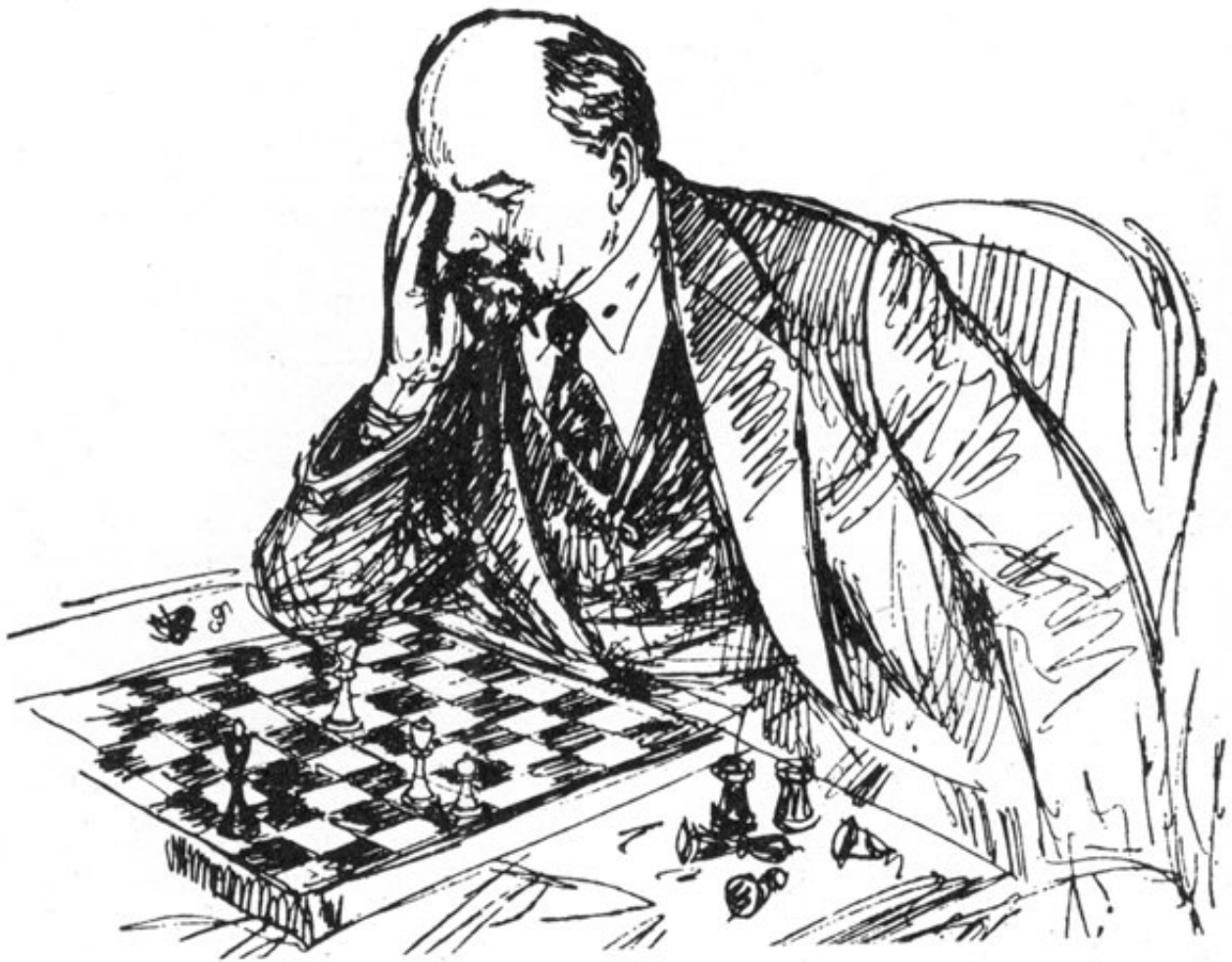
И. Ленин решает шахматную задачу. Рисунок Ю. И. Масютина (1960) Белые начинают и ставят мат в три хода. Автор композиции - американец Уильям Энтони Шинкман (1847– 1933), «Offiziers-Schachzeitung», 1905 г. 1. Фb2 Крd7 2. Фе5 Крс8 3. Фс7X, 2.... Крс6 3. Фd5X