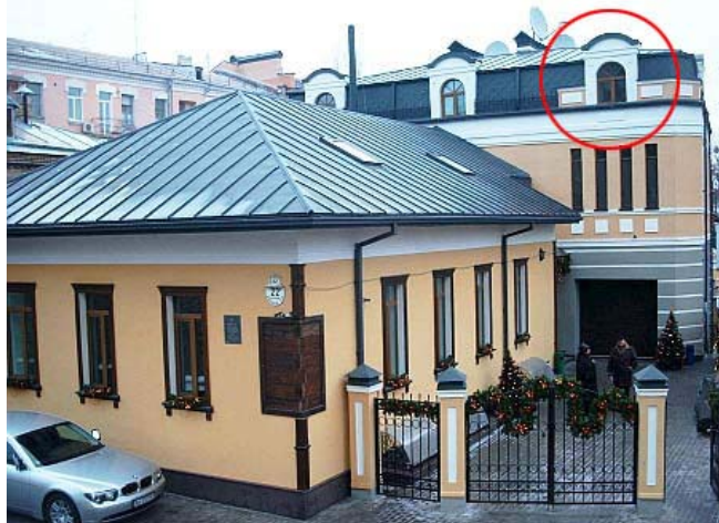
Передвиборча штаб-квартира Юшенка на Боричевом Току, будинок 22-а. Колом виділено вікно кабінету майбутнього президента

В ході підготовки до теракту зловмисники використовували три різні машини. Перше з авто, "Газель" зі схованкою, знадобилось, щоб таємно завезти вибухівку в Україну. Це сталося 22 жовтня.