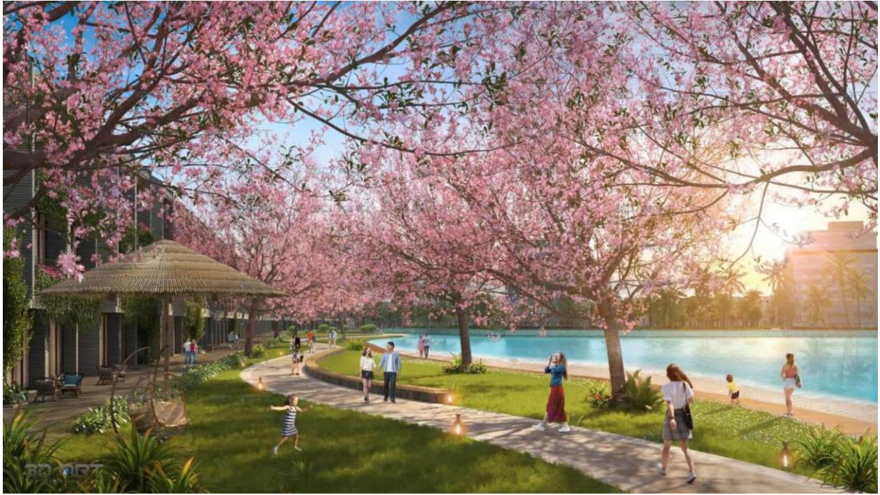
Vườn dáo Sakura