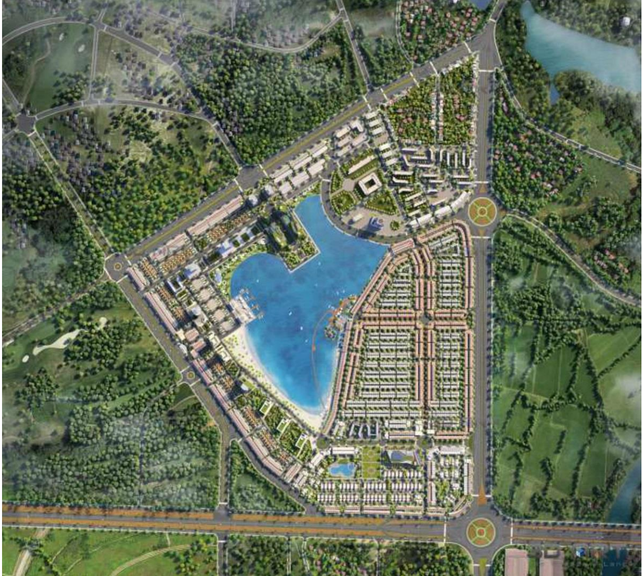
Mặt bằng dự án TMS Homes Wonder World Bắc Hà Nội

Thiết kế biệt thự, liền kề TMS Homes Wonder World Bắc Hà Nội sở hữu thiết kế theo phong cách hiện đại. Các ngôi nhà được sơn theo màu sắc thiết kế đồng bộ, tạo nên những dãy nhà thanh lịch. Đặc biệt, một số biệt thự tại dự án còn có ưu thế nằm ngay ven hồ, hứa hẹn không gian sống trong lành, mát mẻ cùng cảnh quan lãng mạn ngay trước khung cửa sổ.