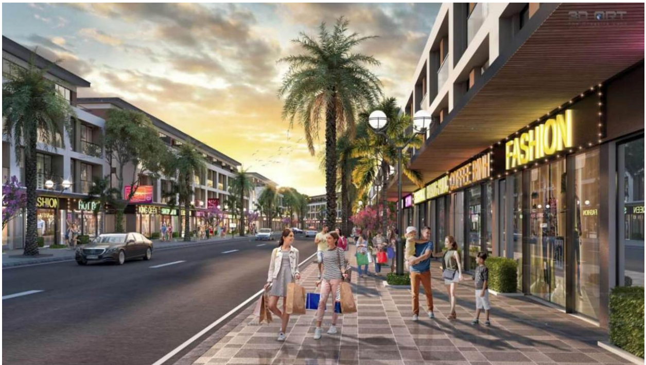
Trục phố đi bộ