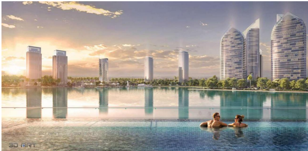
Bể bơi vô cực