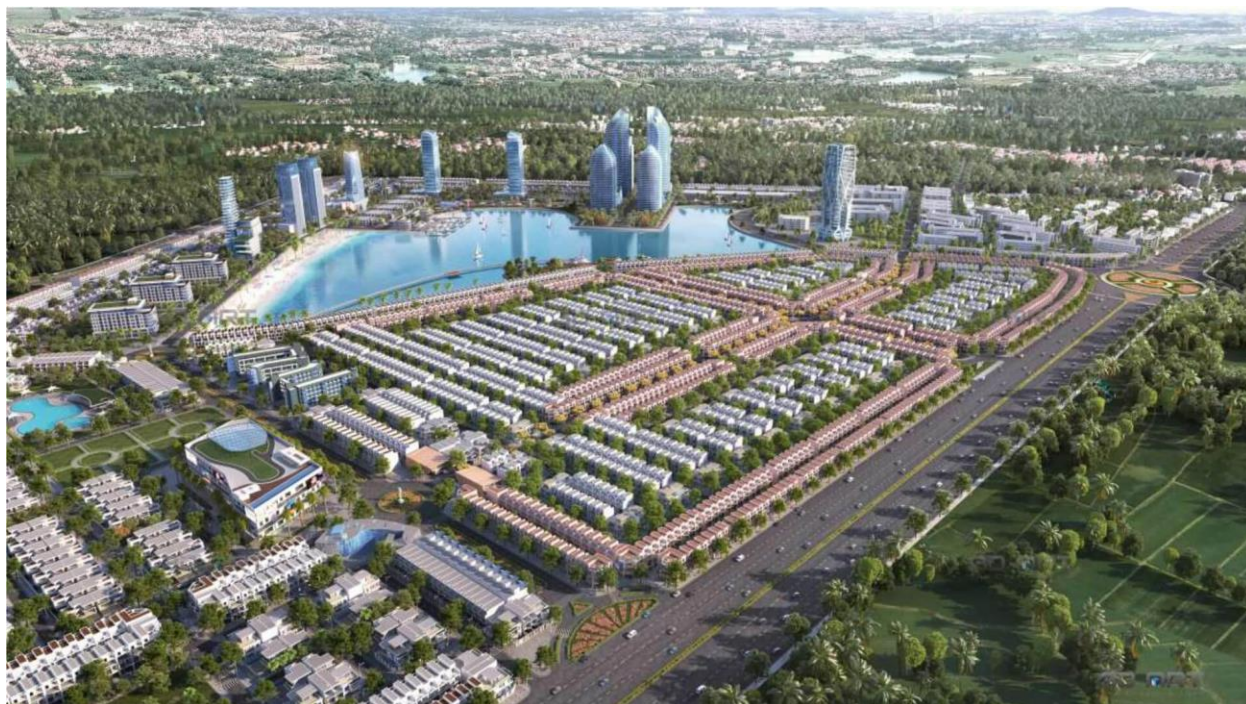
Phối cảnh dự án TMS Homes Wonder World Bắc Hà Nội

TMS Homes Wonder World tọa lạc tại khu vực trung tâm thành phố Vĩnh Yên, phía Bắc Hà Nội được quy hoạch trên diện tích đất 154,4 ha, với các hạng mục chính: nhà phố thương mại (Shophouse), Khu Biệt thự Liên kề. Dự án TMS Homes Wonder World Bắc Hà Nội là quần thể đô thị thương mại sinh thái đẳng cấp, với đầy đủ tất cả những tiện ích 5 sao bậc nhất như bể bơi tiêu chuẩn, khu thể thao ngoài trời, hầm đỗ xe thông minh, hạ tầng cây xanh cùng hồ điều hòa tại trung tâm dự án.