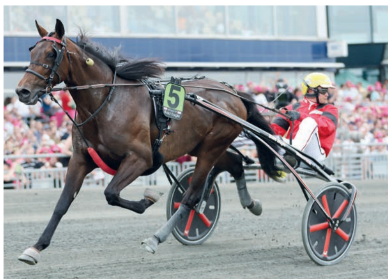
Bold Eagle à l'arrivée de sa batterie.