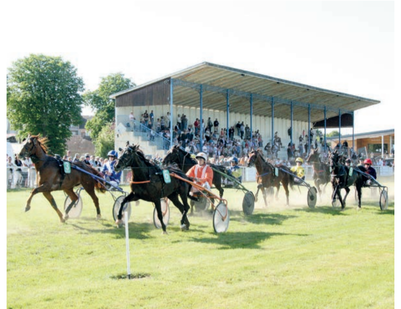
L'hippodrome d'Alençon sera le cadre, ce dimanche, de la 6 ème étape du Trophée Vert.