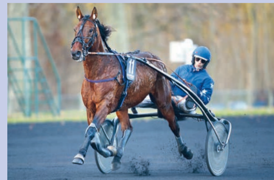
Amiral Sacha