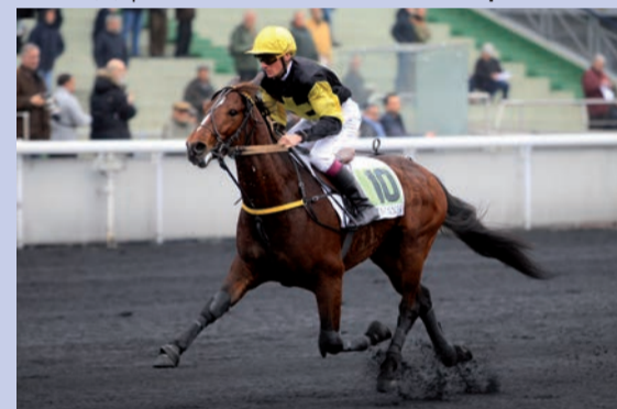
Dragon du Fresne

LE TICKET MALIN : difficile de prévoir le comportement de Django Riff (8) et de Draft Life (6) qui vont effectuer leur premiers pas dans la spécialité. Aussi, on fera confiance au double lauréat classique Dragon du Fresne (7) et à Dahlia du Rib (4), probant lauréat en dernier lieu. Couplé G/P 7-4