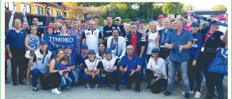
Les supporters de Timoko posent dans les écuries de Solvalla après le 15 ème Groupe I du champion.