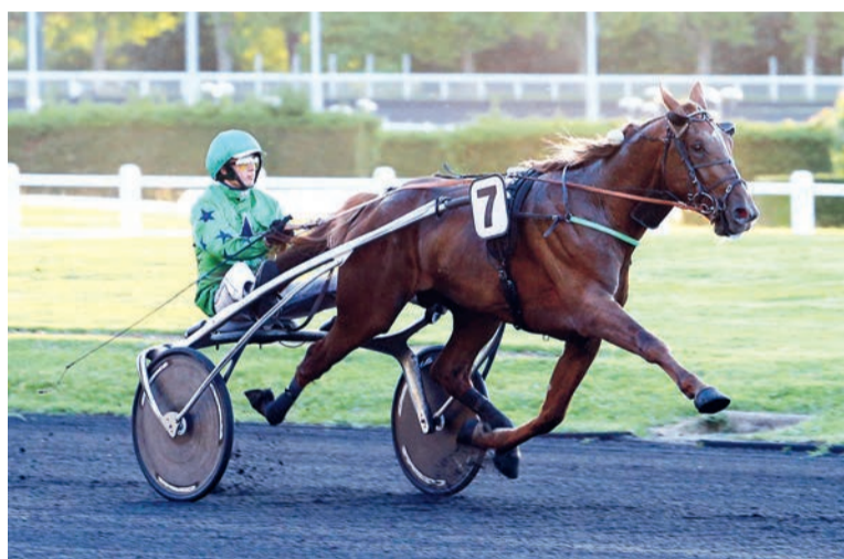
Ecu Pierji en démonstration dans le Prix Kalmia la semaine dernière à Vincennes.

★★ DANSE CADENCE: suit l'animateur, Délice du Wallon, puis tente de mettre en doute sa supériorité lorsqu'elle se montre fautive avant la mi-ligne droite.