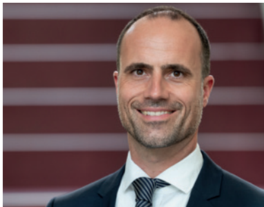
CLEMENS HOCH MINISTER FÜR WISSENSCHAFT UND GESUNDHEIT RHEINLAND-PFALZ - SCHIRMHERR

Neues Wissen entsteht gerade auch durch Vernetzung und Austausch – hierbei wünsche ich den Veranstaltungsteilnehmenden viel Erfolg!"