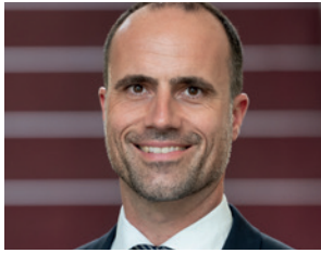
CLEMENS HOCH Minister für Wissenschaft und Gesundheit Rheinland-Pfalz