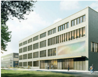
Centrum für Fundamentale Physik (CFP)