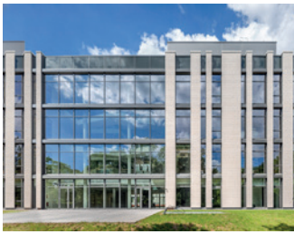
BioZentrum I und II